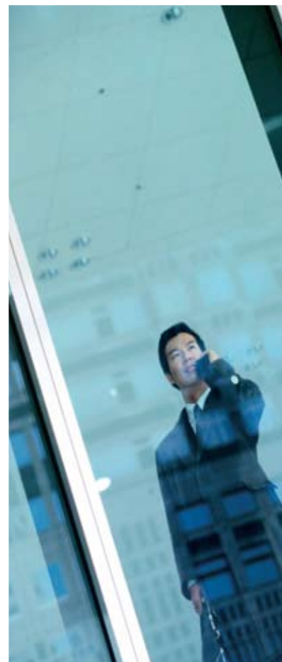
Страны со средним уровнем дохода

Страны со средним уровнем дохода по-прежнему сталкиваются с серьезными проблемами развития, особенно в части обеспечения важнейших видов общественного обслуживания и создания объектов инфраструктуры.