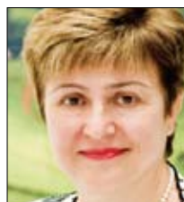
Кристиалина Георгиева Вице-президент и корпоративный секретарь