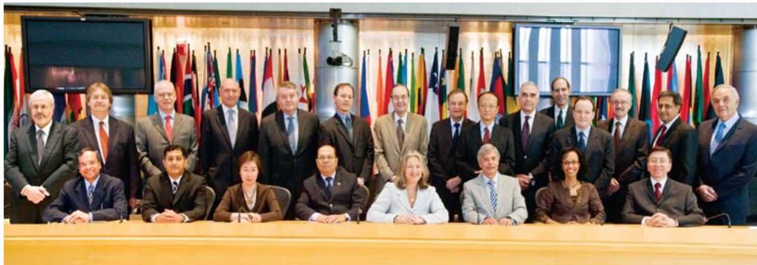
Совет исполнительных директоров МИГА (по состоянию на 30 июня 2008 года)

Ревизионный комитет консультирует Совет по вопросам управления финансовыми средствами и прочим вопросам управления, облегчая принятие решений в области финансовой политики и контроля. Бюджетный комитет рассматривает отдельные аспекты операционной деятельности, административной политики, норм и статей бюджета, оказывающих существенное влияние на эффективность экономической деятельности Группы организаций Всемирного банка. Комитет по вопросам эффективности деятельности в области развития консультирует Совет по вопросам оценки операций и эффективности деятельности в области развития в целях мониторинга достижений МИГА в решении стоящей перед Агентством основной задачи – сокращения масштабов бедности. Комитет по кадровой политике консультирует Совет по вопросам заработной платы и другим важнейшим вопросам кадровой политики. Исполнительные директора работают также в Комитете по управлению и административным вопросам Совета исполнительных директоров.