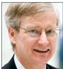
Фрэнк Дж. Лизи Главный экономист и директор по вопросам экономики и политики