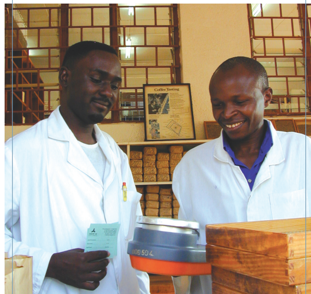
"Угакоф, лтд", Уганда

Недавний опыт говорит о том, что малые компании, рассматривающие вопрос о расширении своей деятельности за границу, могут стимулировать экономическое развитие в регионе через свою поддержку МСП. Экономические успехи в южных провинциях Китая в основном объясняются высокоэффективными трансграничными союзами МСИ и совместными предприятиями с участием китайских предпринимателей с материка и базирующихся в Гонконге МСИ. В Европе возникло большое количество различных партнерств с участием немецких и австрийских МСИ, которые предоставляют средства МСП в странах Восточной Европы, таких как Чешская Республика, Венгрия и Польша. И в Африке малые южноафрикан-