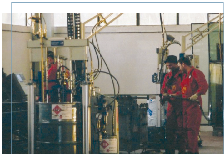
"Альтипко констракшн, лтд", Румыния

На данный момент МИГА оказало поддержку 117 проектам, от которых напрямую выгадали МСП – 14 проектов лишь в 2004 финансовом году. Один из таких проектов осуществляется в Уганде, где сектор МСП сыграл ключевую роль в примечательном изменении ситуации в стране. В 1999 финансовом году МИГА предоставило две гарантии на сумму 6,5 млн. долл.