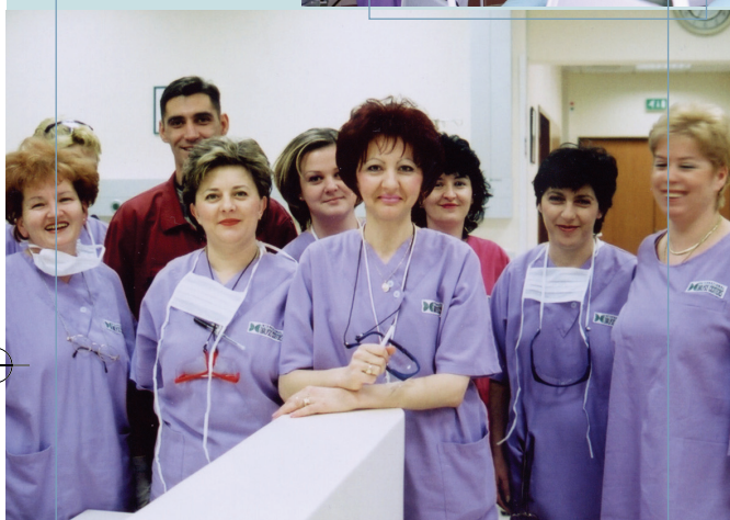
Центр гемодиализа в городе Баня-Лука, Босния и Герцеговина