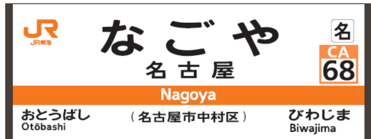
ホーム上の駅名サイン（イメージ）