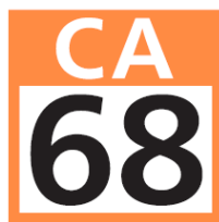
駅ナンバリングの表記例

このたび、訪日外国人のお客様が、当社線をよりわかりやすく、安心してご利用いただけるように、在来線の駅に駅ナンバリングを導入し、更に案内を充実してまいります。