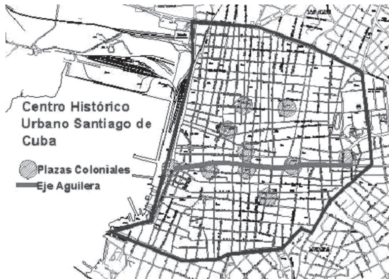
Plano 1 – Centro histórico: el trazado vial propicia el elemento sorpresa en los recorridos peatonales pues se producen cierres de perspectivas e inflexiones viales muy agradables.