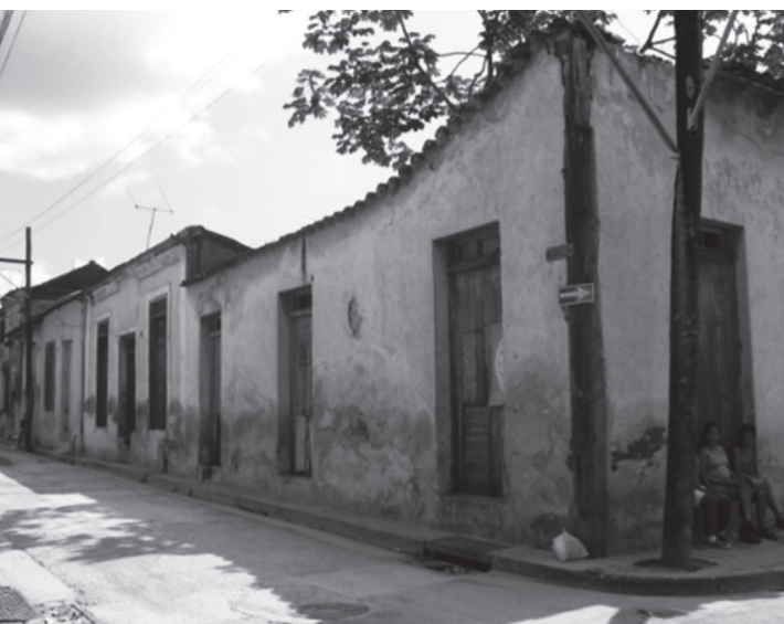
Foto 2 – En el conjunto se manifiesta la reiteración de los altos puntales, la presencia de pretiles, cubiertas inclinadas de tejas criollas ó francesas; las proporciones de vanos alargados y estrechos; la tipología de fachadas simple. Foto 3 – Se mantiene la coherencia formal de las construcciones debido a la tipología arquitectónica.