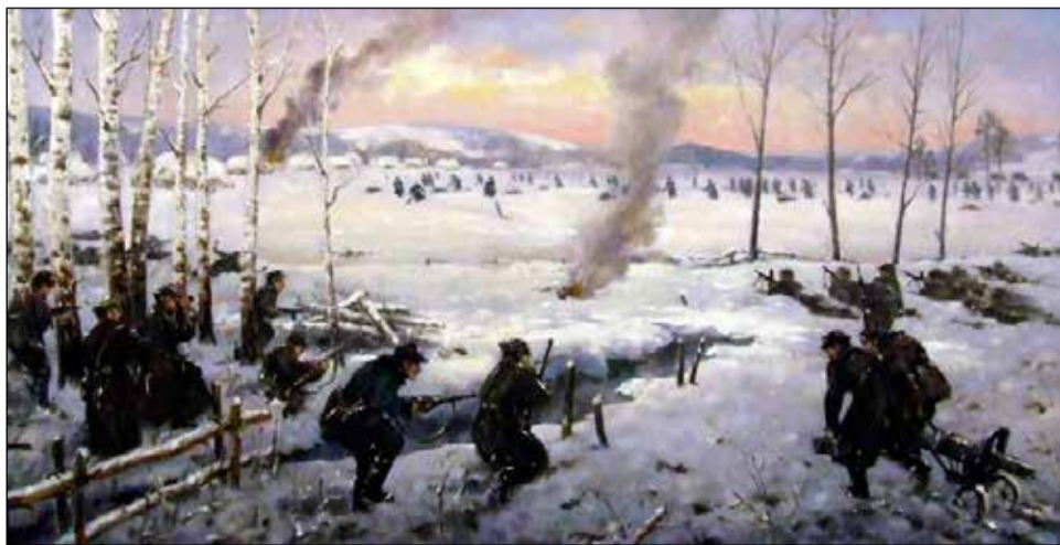
„Bitwa pod Zaborecznem – studium” z cyklu „Powstanie Zamojskie – tryptyk” – autorzy Maciej Milewski, Andrzej Tryzno (obraz ze zbiorów MHPRL)

W roku 1944 na terenie 166 powiatów w walce z okupantem w uczestniczyło ponad 157 tysięcy żołnierzy BCh, 70 oddziałów partyzanckich i około 400 Oddziałów Specjalnych BCh, które przeprowadziły kilka tysięcy akcji, w tym 830 bitew i potyczek. BCh były pierwszą organizacją zbrojną, któ-