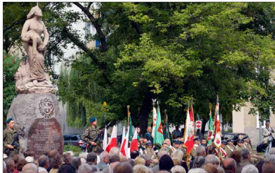
Zarząd Główny OZŻBCh organizuje także uroczystości upamiętniające stoczone przez oddziały bitwy i miejsca popełnionych przez okupanta zbrodni

ny Chłopskie) na Cmentarzu Wojskowym na Powązkach z ceremoniałem wojskowym przy pomniku w Kwaterze Żołnierzy Batalionów Chłopskich. Organizowane są także uroczystości upamiętniające stoczone przez oddziały bitwy i miejsca popełnionych zbrodni przez okupanta. Miejsc upamiętniających poniesione ofiary jest w kraju wiele. Szczególnie cieszy uczestnictwo w uroczystościach młodzieży szkolnej. Bataliony Chłopskie są patronem ponad 100 szkół na terenie całego kraju.