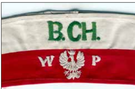
Opaska Batalionów Chłopskich

chłopski. Akcją tą objęto praktycznie wszystkie okręgi BCh, przy czym najsilniej rozwinęła się ona na terenach GG. Żołnierze BCh zorganizowali około 800 kompletów tajnego nauczania. Na ich bazie po wyzwoleniu powstawały szkoły średnie ogólnokształcące.