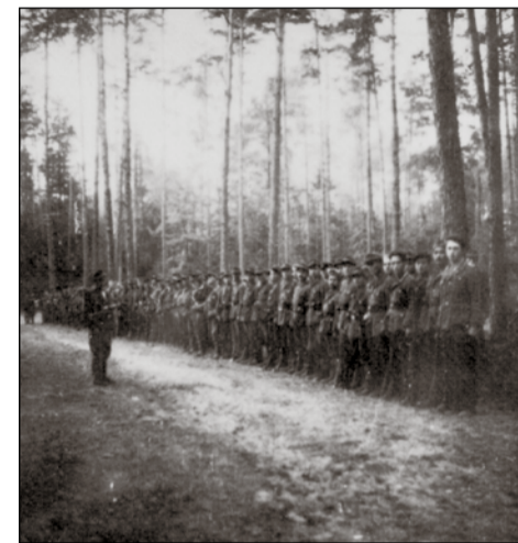
Apel Zgrupowania „Ośki”, obwód Ilża

W walce z hitlerowskim najeźdźcą ruch ludowy poniósł wielką ofiarę krwi, zginęło lub zostało zamordowanych ponad 10 tysięcy jego działaczy i żołnierzy BCh.