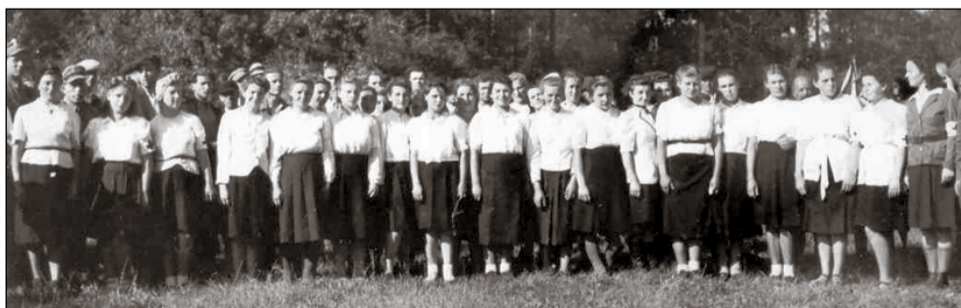
Odprawa „Zielonego Krzyża” w lesie nienadowskim, obw. Przemyśl, 1944 r.