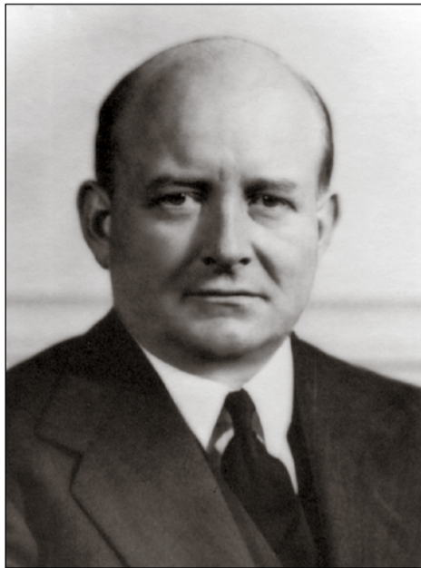
Stanisław Mikołajczyk – premier rządu RP na emigracji w Londynie od lipca 1943 r. do listopada 1944 r.

Znaczne zasługi działacze ludowi mieli także w organizowaniu tajnego nauczania. Spośród wszystkich środowisk politycznych najwięcej kompletów tajnego nauczania na wsi zorganizowali i prowadzili właśnie działacze