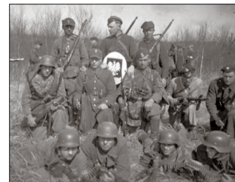
Elewi szkoły podchorążych BCh na ćwiczeniach w Mokrem, obwód Biała Podlaska