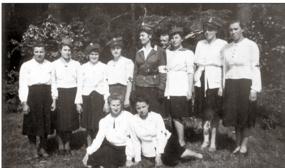
Członkinie LZK i ZK z obw. Przemyśl, las Siewnica

Główne formy pracy LZK to działalność oświatowo-wychowawcza, samokształceniowa i samopomocowa. Członkinie LZK organizowały biblioteki wiejskie, kursy korespondencyjne, szkoliły się jako wychowawczynie dziecińców wiejskich, zdobywały doświadczenia w prowadzeniu gospodarstwa domowego. Pracę szkoleniową prowadzono na kursach-konferencjach, na których poruszano problemy społeczno-polityczne. Ogniwa LZK pełniły w konspiracji szereg ważnych funkcji oraz wykonywały odpowiedzialne zadania. Organizowały kwatery, wyżywienie, kolportowały prasę, prowadziły zielone świetlice dla żołnierzy BCh.