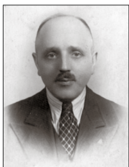
1. Franciszek Kamiński „Zenon Trawiński” – komendant główny Batalionów Chłopskich