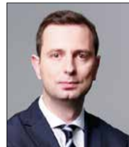
Władysław Kosiniak-Kamysz Prezes Polskiego Stronnictwa Ludowego

Z okazji Jubileuszu 76. rocznicy powołania Batalionów Chłopskich, wyrażam szacunek i wdzięczność żołnierzom tej formacji. Składam hołd pamięci tym, którzy odeszli na wieczną wartę. Tym zaś, którzy są wśród nas życząc dalszych osiągnięć i aktywności w życiu publicznym, powszechnego szacunku, niezawodnego zdrowia oraz satysfakcji z dotychczasowych dokonań.