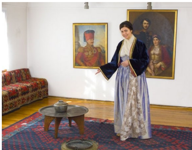
Fig. 4. Portretul lui Miloš Obrenović expus în Muzeul „Palatul Prințesei Ljubica“