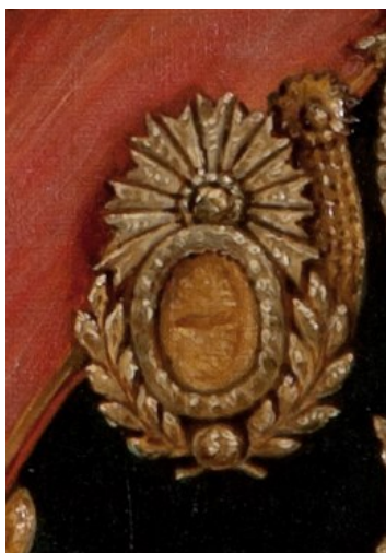
Fig. 6. Ordinul otoman Nisban Istikbar