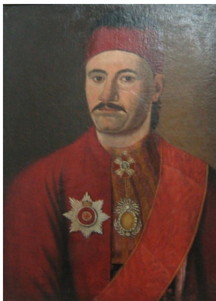
Fig. 15. Anonim, Milan Obrenović, (d. 1835) (Muzeul Național Belgrad)