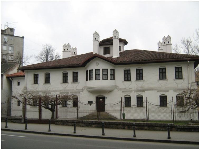
Fig. 3. Reședința prințesei Ljubica (Belgrad), astăzi muzeu