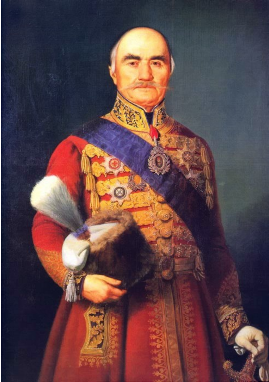
Fig. 11. Miloš Obrenović (a. 1848), portret de Moritz M. Dafinger (copie)