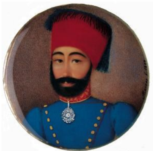
Fig. 5. Portretul-medalion al lui Mahmud II