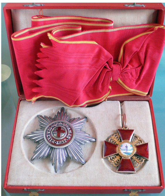
Fig. 7. Ordinul rusesc St. Ana , cls. I