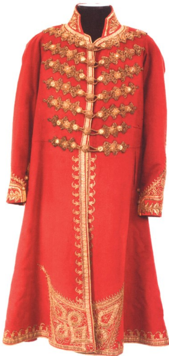
Fig. 12. „Dolmanul” principelui Miloš Obrenović (reconstituire) (Muzeul Național din Belgrad)