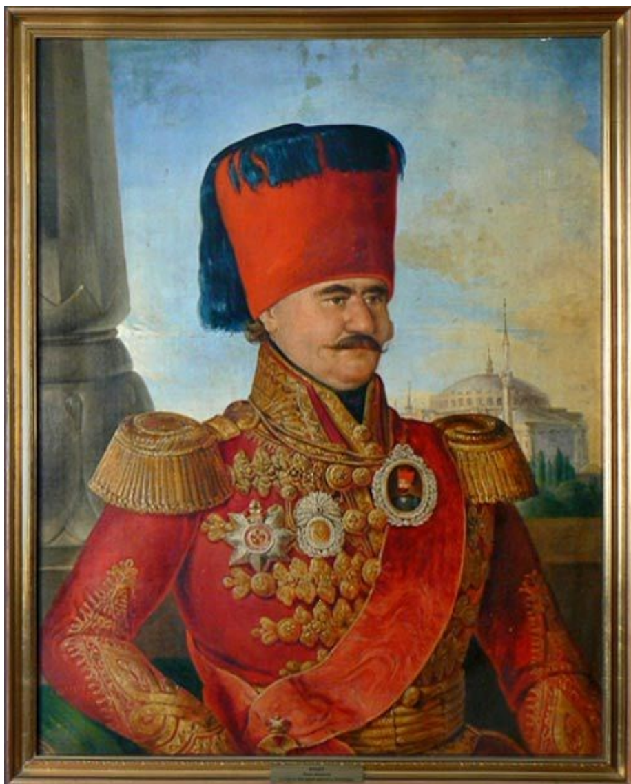
Fig. 2. Miloš Obrenović, portret de Josef Aug. Schoefft, 1835 (Muzeul de Istorie din Belgrad, copie din 1858?)