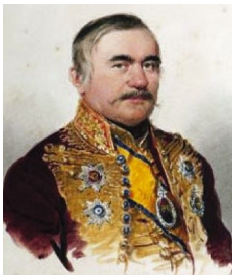
Fig. 17. Miloš Obrenović de M. Dafinger (1842)