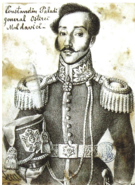
Fig. 8. Generalul Constantin Paladi (c. 1830)