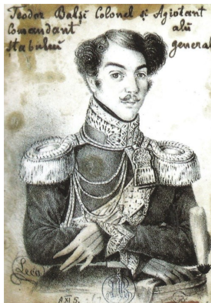
Fig. 9. Colonelul Theodor Balș (c. 1830)