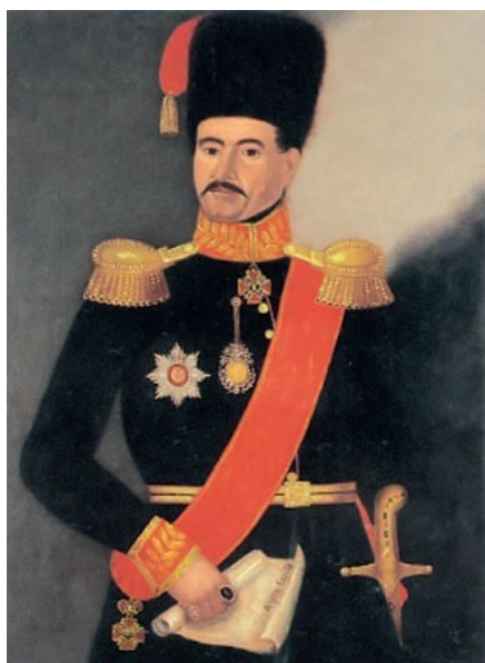
Fig. 16. Miloš Obrenović (d. 1835)