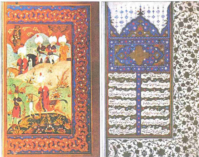
1. Selim'in Farsça divanının ilk sayfasıyla minyatürlü bir sayfası (İÜ Ktp., FY, nr. 1330, vr. 1 a , 25 b )

Onun sekiz yıldan biraz fazla süren saltanatı dönemi Osmanlı tarihi için bir dönüm noktası teşkil eder. Özellikle Doğu meselelerini ele alış ve bunlara kesin çözüm bulma çabalarıyla dikkatini çekmiştir. Safevî tehdidini önlemesi ve onlara karşı ileride Osmanlı dinî düşüncesinin sınırlarını tayin edecek ölçüde katı Sünnî anlayışı öne çıkarması aynı zamanda siyasal ve sosyal hayatta da mühim bir dönüşümün habercisi olmuştur. Memlûk Sultanlığı'na son veriş ise İslâm dünyasının tek bir bayrak altında toplanması projesinin ilk adımını teşkil etmiştir. Böylece Osmanlılar önemli bir dinî misyonun temsilcisi sıfatıyla şöhret kazanmıştır. Bununla birlikte bizzat kendisinin hilâfeti devralarak bu