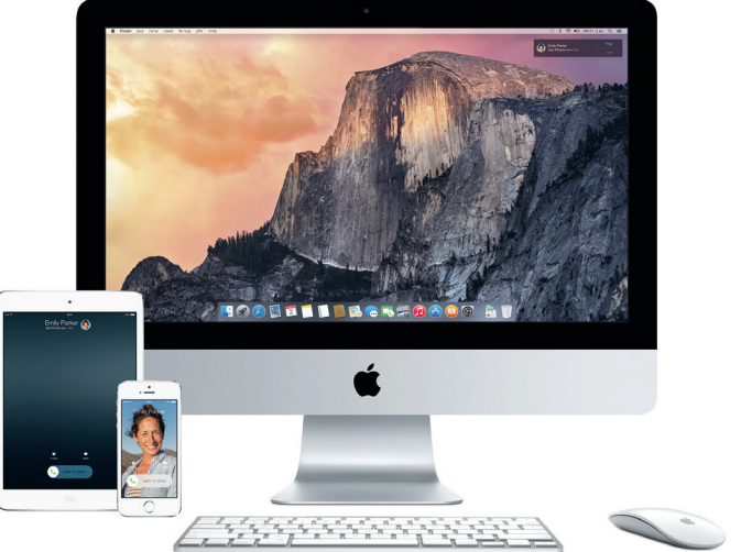
*נדרש מכשיר שמתוקן בו iOS. על ה-Mac ומכשירי ה-iOS שלך להיות מחוברים ליאונתו חשבון iCloud.

Spotlight רשת אלחוטית שורת התפריטים תפריט "עזרה" העדפות המערכת ה-Dock ה-Finder