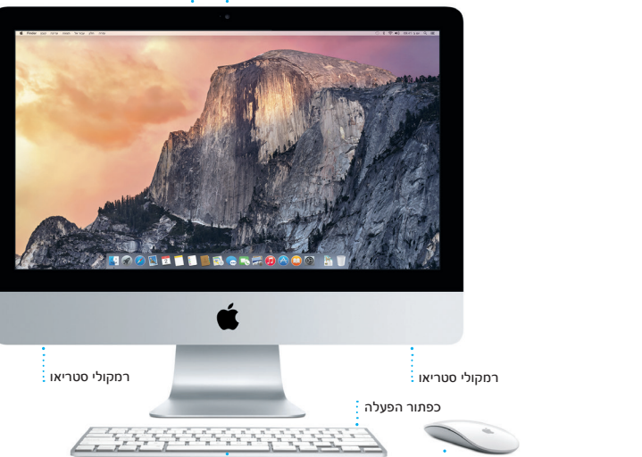
מקלדת אלחוטית מקולי סטריאו כפתור הפעלה Magic Mouse

בוא/י נתחיל לחץ/י על כפתור הפעלה כדי להפעיל את ה-iMac. כעת, מדריך ההגדרות ינחה אותך לאורך כמה שלבים פשוטים שסייעו לך להתחיל לעבוד. המדריך ינחה אותך במהלך התחברות לרשת האלחוטית ויצירת חשבון משתמש. בנוסף, מדריך ההגדרות יכול להעביר את המסמכים, הדוא"ל, התמונות, המוסיקה והסרטים שלך ל-Mac החדש מ-Mac או PC אחר.