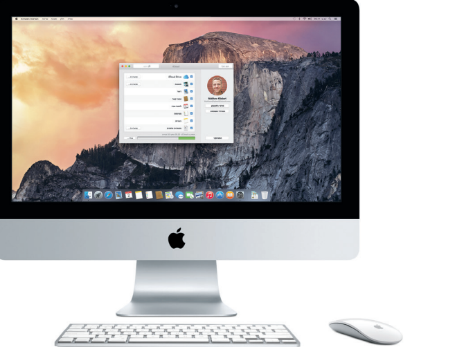
*נדרש מכשיר שמתוקן בו iOS. על ה-Mac ומכשירי ה-iOS שלך להיות מחוברים ליאונתו חשבון iCloud.

עיון ב-Mac App Store לחץ/י על הצלמית ב-Dock. מתיחת Launchpad לחץ/י על Launchpad על צלמית ב-Dock. תיקיות קבץ/י יישומים על-ידי גרירת יישום אחד על-גבי יישום אחר.