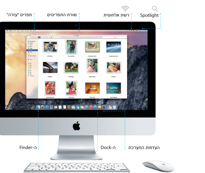
העדפות המערכת ה-Dock ה-Finder

שורת התפריטים, הממוקמת בראש המכתבה, כוללת מידע שימושי לגבי ה-Mac שלך. כדי לבדוק את מצב החיבור האלחוטי שלך לאינטרנט, לחץ/י על צלמית הרשת האלחוטית. ה-Mac מתחבר אוטומטית לרשת שבחרת במהלך ההתקנה. באמצעות Spotlight, תוכלו/י גם למצוא כל דבר ב-Mac ולחפש מידע.