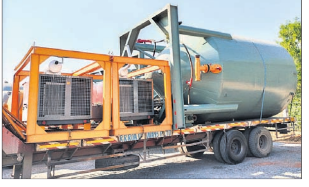
ଗୋପରେ ଗ୍ୟାସ୍, ଟେକ୍ସି ସାମଗ୍ରୀ ପ୍ରସଙ୍ଗ

ପୂର୍ଣ୍ଣା ଲିମ୍ବା ଗୋପ ନିକଟସ୍ଥ କୁନ୍ତୁପୁରର ପ୍ରାକୃତିକ ଗ୍ୟାସ୍ ସହିତ ପେଟ୍ରୋଲ, ଡିଜେଲ୍ ବାହାରିବା ନେଇ ରବିବାର ୪ଟି ରାଜ୍ୟରୁ ୧୧ଟି ଅତ୍ୟାଧୁନିକ ମେଣ୍ଟିନ ପହଞ୍ଚିଛି। ଏହି ଅତ୍ୟାଧୁନିକ ମେଣ୍ଟିନ ଦ୍ୱାରା ପ୍ରାୟ ୯ ଶହ ପୁଟ୍ ଚଳୁ ବାହାରିବା ପାଇଁ ଓ ମାଟି ବାଲିକୁ ନିଆଯାଇ ରି-ଫାଇନ କରାଯିବା ପ୍ରକ୍ରିୟା ନିଆଯାଇ ରି-ଫାଇନ କରାଯିବ ବୋଲି ଅଧିକାରୀ କହିଛନ୍ତି। ଏହା ପରେ ଗୁରୁପୁରୁ ଅଞ୍ଚଳର ୮ ଏକର ଜମି ବିକ୍ରି କରାଯାଇ ୩୭ ଜଣ ଚାଷୀଙ୍କ ଜମିକୁ ଲିଙ୍ଗି ଏହା କେନ୍ଦ୍ରକୁ କିପରି ବିଶୋଧନ କରାଯିବ ସେ ସମ୍ପର୍କରେ କୌଣସି ଠିକ୍ ତଥ୍ୟ କମ୍ପାନୀ ପକ୍ଷରୁ ସୂଚନା ଦିଆଯାଇ ନାହିଁ। ମାତ୍ର ବିଶାଖାରେ ଲାଗି ଆଣ୍ଡ୍ର ପ୍ରଦେଶ, କର୍ନାଟକ, ମହାରାଷ୍ଟ୍ର ସହିତ ଆଉ କେତେକ ରାଜ୍ୟରୁ ଏହି ଅତ୍ୟାଧୁନିକ ମେଣ୍ଟିନ ଆସିଥିବା ବେଳେ ଆହୁରି ଅତ୍ୟାଧୁନିକ ସାମଗ୍ରୀ ଆସିବାର