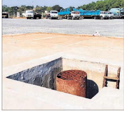
ଗୋପ, ୮୧ (ଡି.ଏନ୍.ଏ.)