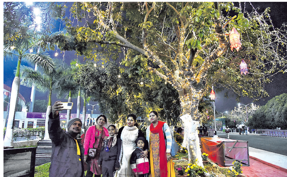
ଲିଟୁ ଓ ବିଭିନ୍ନ ଲାଇଟ୍‌ସ୍ରେ ଗଛଗୁଡ଼ିକୁ ସଜାଯାଇଥିବାବେଳେ ଲୋକେ ସେଲଫିର ମଜା ନେଉଛନ୍ତି ।