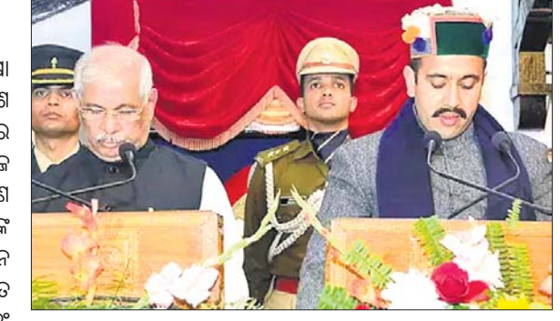
ହିମାଚଳ ପ୍ରଦେଶ ରାଜ୍ୟପାଳ ରାଜେନ୍ଦ୍ର ବିଶ୍ୱନାଥ ଆଲୋଚନା ରବିବାର ବିଜ୍ଞାପନ ଦିଆଯାଇଛି।

୪ ସପ୍ତାହର ପ୍ରତୀକ୍ଷା ପରେ ହିମାଚଳ ପ୍ରଦେଶ ମୁଖ୍ୟମନ୍ତ୍ରୀ ସୁଖବୀର ସିଂହ ପୁଣି ରବିବାର ନିଜ କ୍ୟାବିନେଟ୍ ସମ୍ପ୍ରସାରଣ କରିଛନ୍ତି। ସୁଖୁଳ ମନ୍ତ୍ରମଣ୍ଡଳରେ ପୂର୍ବତନ ମୁଖ୍ୟମନ୍ତ୍ରୀ ସ୍ୱର୍ଗତ ବୀରଭଦ୍ର ସିଂହ ଏବଂ ପ୍ରଦେଶ କଂଗ୍ରେସ କମିଟି (ପିସିସି) ସଭାନେତ୍ରୀ ପ୍ରତିଭା ସିଂହଙ୍କୁ ପୁଣି ବିଜ୍ଞାପନ ଦିଆଯାଇଛି।