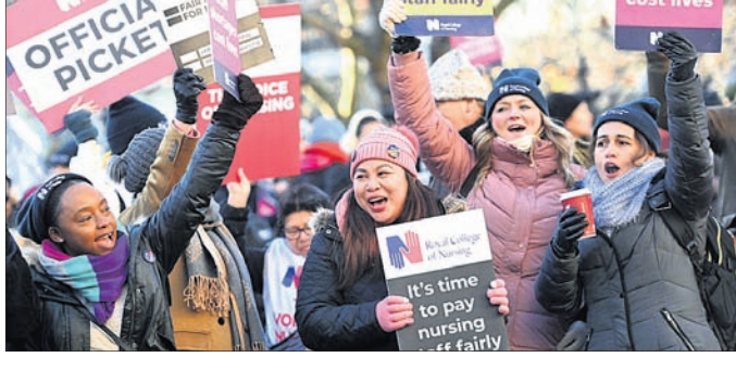
ନର୍ସିଙ୍ଗ କାର୍ଯ୍ୟରେ ଯୋଗ ନ ଦେବାକୁ ନେତାଙ୍କ ସହ ଆଲୋଚନା ପାଇଁ ପ୍ରସ୍ତୁତ ସ୍ୱାସ୍ଥ୍ୟ ସେବା ବ୍ୟାହତ ହୋଇଥିଲା। ଏହି ଆନ୍ଦୋଳନ ଜାରି ରହିଥିବାବେଳେ ଗପରେ ଥିବା ପ୍ରଧାନମନ୍ତ୍ରୀ ରକ୍ଷି ସୁନକ ରବିବାର ନର୍ସିଙ୍ଗଙ୍କ ଟ୍ରେଡ୍ ୟୁନିୟନ୍