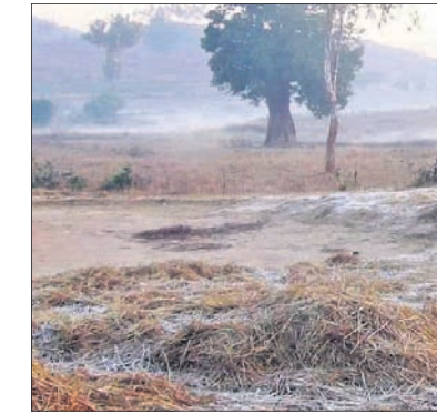
କୋରାପୁଟ ମୁନିସିପାଲିଟି ଅଧୀନ ରେଲିକୁସା ଗ୍ରାମ ଧାନଖଳାରେ ରବିବାର ଭୋର ସମୟରେ ହୋଇଥିବା ବୁଝାପଡ଼ା ।

ହୋଇଛି । ସୂଚନାଯୋଗ୍ୟ ଯେ, ସମ୍ପୃକ୍ତ ୩ ଯୁବକ ସ୍ଥାନୀୟ ଉଲ୍ଲେଖାକୁ କ୍ରିକେଟ୍ ଖେଳି ବାଇକ୍ (ନଂ.୧୭୮୭୭-୧୭-୦୮୭୭)ରେ ଗାଁକୁ ଫେରୁଥିଲେ । ଏହି ସମୟରେ ବେଲମାଳ ଛକ ନିକଟରେ ଏକ ଗ୍ୟାସ୍ ବୋମ୍ବେଜ୍ ଟ୍ୟାକ୍‌ର (ନଂ.ଟିଏନଫ୍ ୮୩-୩୫୮୫) ଭାରସାମ୍ୟ ହରାଇ ବାଇକ୍‌କୁ ଧକ୍କା ଦେଇଥିଲା । ଘଟଣାସ୍ଥଳରେ ମାଲିକଙ୍କ ମୃତ୍ୟୁ ଘଟିଥିଲା ।