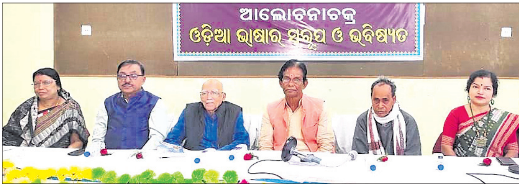
ଯୁଥ୍ ହଷ୍ଟେଲ ପରିସରରେ ଅନୁଷ୍ଠିତ ରାଜ୍ୟସ୍ତରୀୟ ଆଲୋଚନାଚକ୍ରରେ ଯୋଗଦେଇଥିବା ଅତିଥିମାନେ।