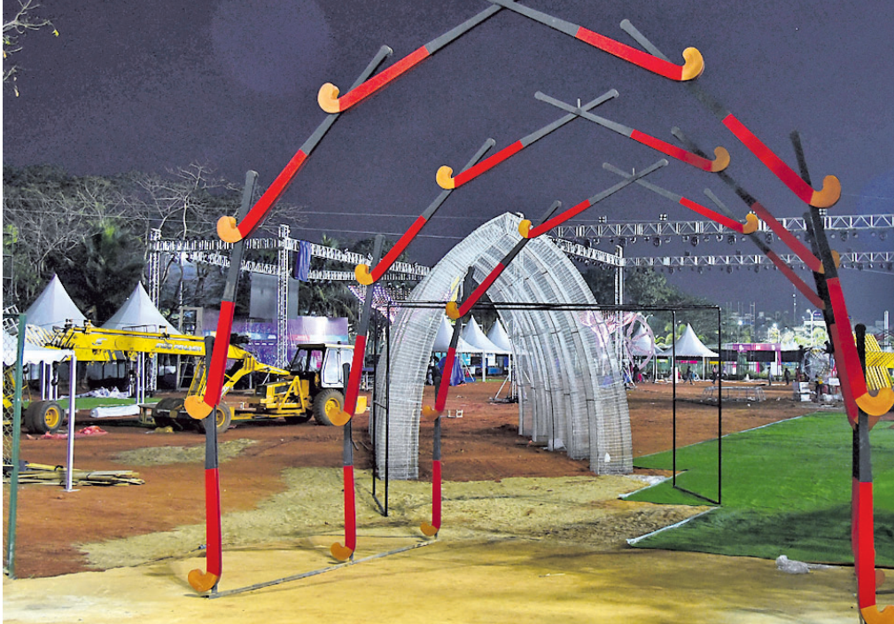
ହକି ବିଶ୍ୱକପ ପାଇଁ ଭୁବନେଶ୍ୱରସ୍ଥିତ କଳିଙ୍ଗ ଷ୍ଟାଡ଼ିୟମ ପରିସରରୁ ବିଭିନ୍ନ କଳାକୃତି, ତିନାଇନ୍ ସହ ରଞ୍ଜିନ ଆଲୋକରେ ସଜାଯାଇଛି ।