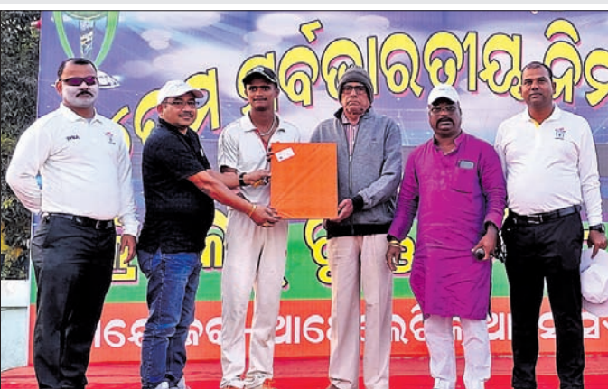
କ୍ରିକେଟ୍ ପ୍ରତିଯୋଗିତାରେ ଉପସ୍ଥିତ ଅତିଥିମାନେ ଖେଳାଳିଙ୍କୁ ପୁରସ୍କୃତ କରୁଛନ୍ତି।

୧୪ତମ ସର୍ବଭାରତୀୟ ନିମାପଡ଼ା କପ୍ କ୍ରିକେଟ୍ ଉଦ୍‌ଘାଟିତ