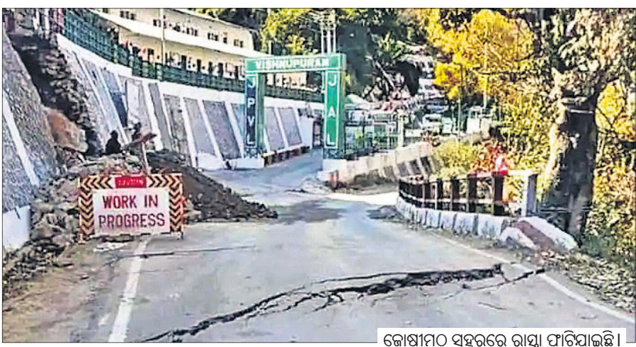
କୋଷାମନ ସହରରେ ରାସ୍ତା ଫାଟିଯାଇଛି।

ଦେବାକୁନ/ନୂଆଦିଲ୍ଲୀ, ୮୧ ଦେବକୁନି ରୂପେ ପରିଚିତ ଭରତାଖଣ୍ଡର ଛୋଟ ସହର କୋଷାମନ ଉପରେ ବଡ଼ ବିପଦ ଦେଖାଦେଇଛି। ତମୋଲି ଜିଲାର ଏହି ଅଞ୍ଚଳରେ ଲଗାତର ଭାବେ ଘର କାନ୍ଥ ଭାଙ୍ଗିବା ସହ ରାସ୍ତା ଧସିବାରେ ଲାଗିଥିବାରୁ ରବିବାର ଏହାକୁ 'ଭୃଷ୍ଟକନ ପ୍ରବଣ କୋନ୍' ଘୋଷଣା କରାଯାଇଛି। ହିମାଳୟ ପାଦରେ ତଥା ସମୁଦ୍ର ପତ୍ତନଠାରୁ ୨,୧୫୦ ଫୁଟ ଉଚ୍ଚତାରେ ଅବସ୍ଥିତ କୋଷାମନ ପ୍ରତି ବିପଦି ମାଡ଼ିଆସିଥିବାରୁ ଲୋକେ ଆତଙ୍କିତ ହୋଇ ଘରଦ୍ୱାର ଛାଡ଼ି ଅନ୍ୟତ୍ର ଆଶ୍ରୟ ନେଇଛନ୍ତି। ୬୦ ପରିବାରକୁ ସୁରକ୍ଷିତ ସ୍ଥାନକୁ ସ୍ଥାନାନ୍ତର କରାଯାଇଥିବାବେଳେ ଆହୁରି ଅନ୍ୟ ୯୦ ପରିବାରକୁ ଅସ୍ଥାୟୀ ରିଲିଫ୍ କ୍ୟାମ୍ପକୁ ନିଆଯିବ ବୋଲି ପ୍ରଶାସନ ପକ୍ଷରୁ କୁହାଯାଇଛି। ହାଡ଼ଭଙ୍ଗା ଶୀତରେ ଲୋକଙ୍କ ପାଇଁ ବଞ୍ଚିବା ଦୁର୍ଦ୍ଦିନ ହୋଇଯାଇଛି। ଏହାକୁ ଦୂରରେ ରଖି ପ୍ରଧାନମନ୍ତ୍ରୀଙ୍କ କାର୍ଯ୍ୟାଳୟ (ପିଏମଓ) ପକ୍ଷରୁ ଉଚ୍ଚସ୍ତରୀୟ ବୈଠକ କରାଯାଇଛି।