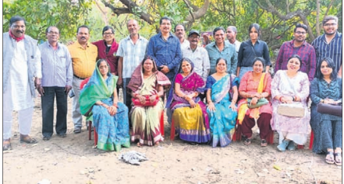
ବନ୍ଧୁ ମିଳନରେ ଯୋଗଦେଇଥିବା ପୁରୀର ଛାତ୍ରାଛାତ୍ରୀମାନେ।