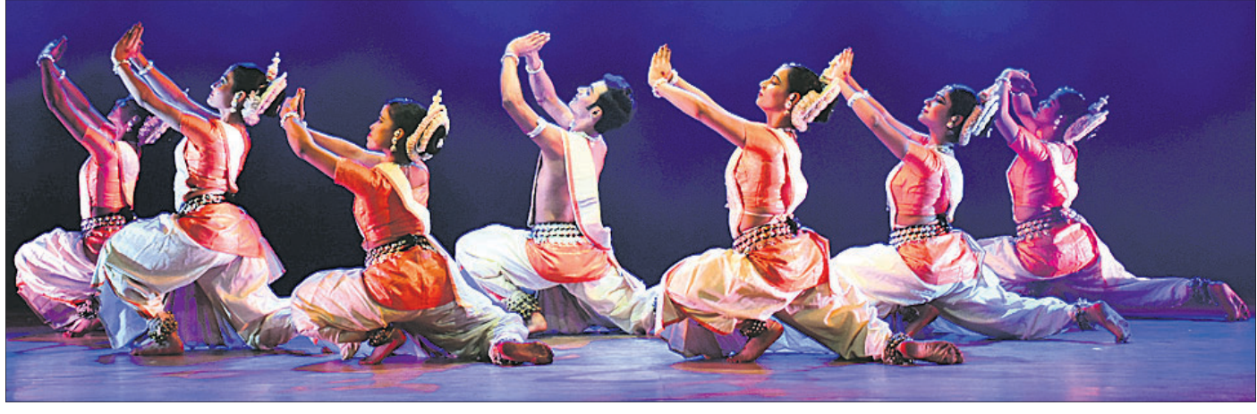
ଭୁବନେଶ୍ୱର ଉତ୍କଳ ରଙ୍ଗମଞ୍ଚରେ ରବିବାର ଗୁରୁ କେଳୁଚରଣ ମହାପାତ୍ରଙ୍କ ୯୭ତମ ଜନ୍ମଦିନ ଉତ୍ସବରେ ଶିଳ୍ପୀମାନେ ଓଡ଼ିଶୀ ନୃତ୍ୟ ପରିବେଷଣ କରୁଛନ୍ତି।

ସେଲ୍ଫି ପଠାଇବା ସମୟରେ ନିଜର ନାମ ଏବଂ ଗୋପାଳନ ନମ୍ବର ଦେବାକୁ ଭୁଲନ୍ତୁ ନାହିଁ। ଯୋଗ୍ୟ ବିବେଚିତ ପଠେ ପ୍ରକାଶ ପାଇବ।