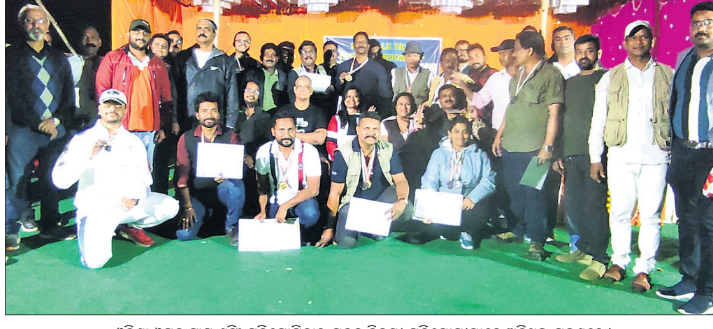
ଓଡ଼ିଶା ଓପନ୍ ଗ୍ରାପ୍ ଶୁଟିଂ ପ୍ରତିଯୋଗିତାର ପଦକ ବିଜୟୀ ପ୍ରତିଯୋଗୀମାନେ ଅତିଥିଙ୍କ ଗହଣରେ।