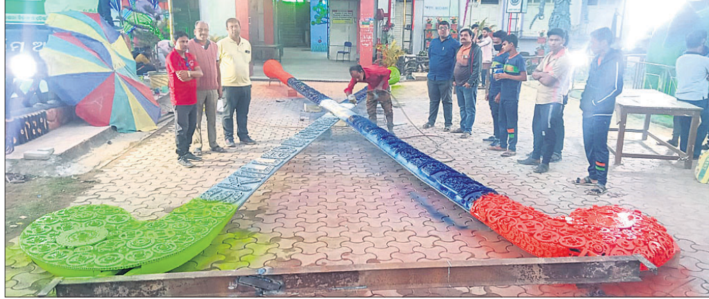
ଆଇଟିଆଇ ପକ୍ଷରୁ ନିର୍ମାଣ ହେଉଥିବା ସ୍ତ୍ରୀୟ ହକି ଷ୍ଟିକ୍।