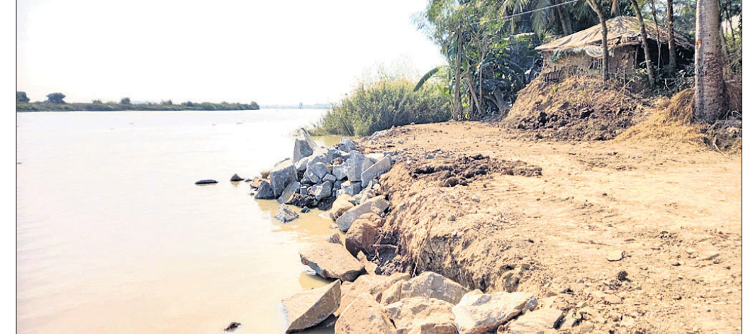
ଆରଡ଼ି ପଞ୍ଚାୟତ ଶାତକପୁର ଗାଁ ନିକଟରେ ପଥରପ୍ୟାକିଂ ସହ ନଦୀରକ୍ଷ ଧର୍ଯ୍ୟାଳା

ଗୁମାସ୍ତା ଭାବେ ନିର୍ମାଣ କରି ସମସ୍ୟାର ସମାଧାନ କରାଯିବ। ଭଦ୍ରକ ଜିଲ୍ଲା ବିଧିସଭା ମୁଖ୍ୟ କହିଛନ୍ତି, ନଦୀରକ୍ଷ ପଥରପ୍ୟାକିଂ କାର୍ଯ୍ୟ ଚାଲୁଥିବା ବେଳେ ଧର୍ଯ୍ୟାଳା ନଦୀରକ୍ଷ କିଛି ନଦୀରକ୍ଷ ସମସ୍ୟା ନାହିଁ। ଯେଉଁ ସ୍ଥାନରେ ପଥର ଧର୍ଯ୍ୟାଳା ନଦୀରକ୍ଷରେ ପଥର ପକାଯାଇ କାମ ଚଳା ଯାଉଥିଲା। ପ୍ରାୟ ୧ ବର୍ଷ ତଳେ ପଥରପ୍ୟାକିଂ କାର୍ଯ୍ୟ ଚାଲୁ ରହିଛି। ଏହାକୁ