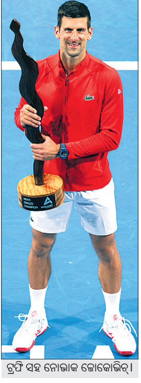
ଟ୍ରଫି ସହ ନୋଭାକ ଜୋକୋଭିଚ୍।