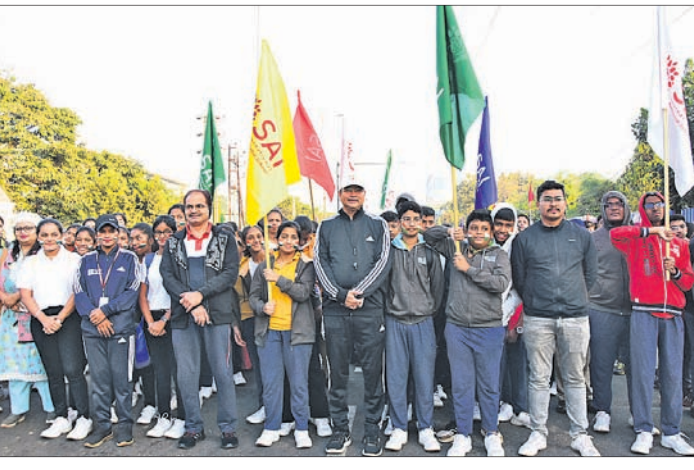
ପଥ ଉତ୍ସବରେ ସାମିଲ ହୋଇଥିବା ସାଇକେଲିଂ ଷ୍ଟୁଡିଂ ଷ୍ଟୁଡିଂ ।