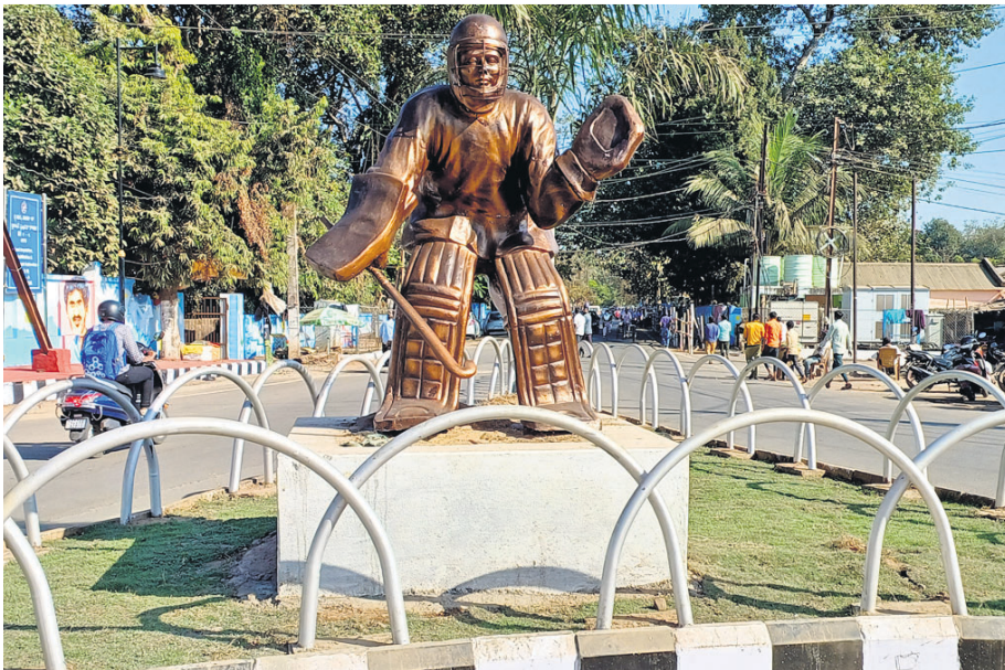
ବାରବାଟୀ ଷ୍ଟାଡ଼ିୟମ ନିକଟରେ ହକି ଖେଳାଳିଙ୍କ ପ୍ରତିକୃତି ।