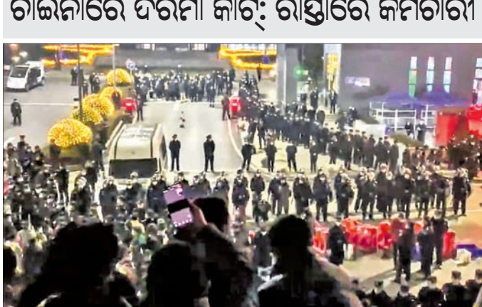
ଚାଲିଯାଇଛି ଓ ପୋଲିସଙ୍କ ମଧ୍ୟରେ ମୁହାଁମୁହିଁ ଛାଡ଼ି ଉଠୁଛି। ସେଣ୍ଟ୍ରାଲ ଚାଲିଯାଇ ଥିବା କାଳିଫ-୧୯ ଆଫିକେନ୍ କିର୍ ନିର୍ମାଣକାରୀ କମ୍ପାନୀ କାଲିଫିଓ ବିନା ନୋଟିସ୍ରେ ଅନେକ ଲୋକଙ୍କୁ ଚାକିରିରୁ ବାହାର କରିଥିବାବେଳେ ଏହାକୁ ବିରୋଧ କରି ଶନିବାର କର୍ମଚାରୀମାନେ କମ୍ପାନୀ ସମ୍ମୁଖରେ ବିକ୍ଷୋଭ ପ୍ରଦର୍ଶନ କରିଥିଲେ। ଘଟଣା ସମ୍ପର୍କରେ ସୂଚନା ପାଇ ଆନ୍ଦୋଳନ ଘୁଳିରେ ପୋଲିସ ପହଞ୍ଚିଥିବାବେଳେ ଉଭେଇଟ ଲୋକେ ପୋଲିସ ଉପରକୁ ଆକ୍ରମଣ କରିବାକୁ ପଛାଇ ନ ଥିଲେ। ରାସ୍ତାରେ ଥିବା ଟ୍ରାଫିକ୍ କୋର୍ଡ, ବାକ୍ସ ଆଦି ସେମାନେ ପୋଲିସ ଉପରକୁ ଫୋପାଡ଼ିବା ଆରମ୍ଭ କରିଥିଲେ। ଘଟଣା ନେଇ ଅନେକ ଭିଡିଓ ଏବେ ସୋସିଆଲ

ସାଂଘାଲ, ଗା: ଚାଲିଯାଇଛି ଓ ପୋଲିସଙ୍କ ମଧ୍ୟରେ ମୁହାଁମୁହିଁ ଛାଡ଼ି ଉଠୁଛି। ସେଣ୍ଟ୍ରାଲ ଚାଲିଯାଇ ଥିବା କାଳିଫ-୧୯ ଆଫିକେନ୍ କିର୍ ନିର୍ମାଣକାରୀ କମ୍ପାନୀ କାଲିଫିଓ ବିନା ନୋଟିସ୍ରେ ଅନେକ ଲୋକଙ୍କୁ ଚାକିରିରୁ ବାହାର କରିଥିବାବେଳେ ଏହାକୁ ବିରୋଧ କରି ଶନିବାର କର୍ମଚାରୀମାନେ କମ୍ପାନୀ ସମ୍ମୁଖରେ ବିକ୍ଷୋଭ ପ୍ରଦର୍ଶନ କରିଥିଲେ। ଘଟଣା ସମ୍ପର୍କରେ ସୂଚନା ପାଇ ଆନ୍ଦୋଳନ ଘୁଳିରେ ପୋଲିସ ପହଞ୍ଚିଥିବାବେଳେ ଉଭେଇଟ ଲୋକେ ପୋଲିସ ଉପରକୁ ଆକ୍ରମଣ କରିବାକୁ ପଛାଇ ନ ଥିଲେ। ରାସ୍ତାରେ ଥିବା ଟ୍ରାଫିକ୍ କୋର୍ଡ, ବାକ୍ସ ଆଦି ସେମାନେ ପୋଲିସ ଉପରକୁ ଫୋପାଡ଼ିବା ଆରମ୍ଭ କରିଥିଲେ। ଘଟଣା ନେଇ ଅନେକ ଭିଡିଓ ଏବେ ସୋସିଆଲ