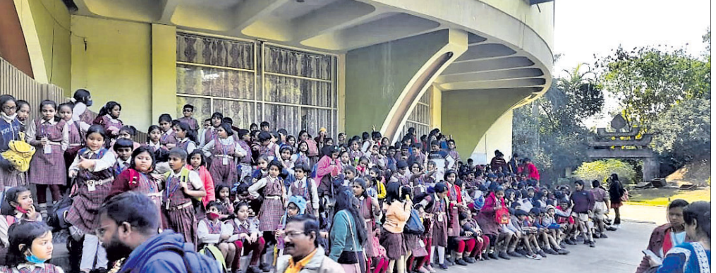
ପଠାଣି ସାମନ୍ତ ପ୍ଲାନେଟାରିୟମ ପରିସରରେ ଶୋ' ଦେଖିବା ପାଇଁ ଭିଡ଼ ଜମାଇଥିବା ଛାତ୍ରାଛାତ୍ରୀ ଓ ଅନ୍ୟମାନେ ।