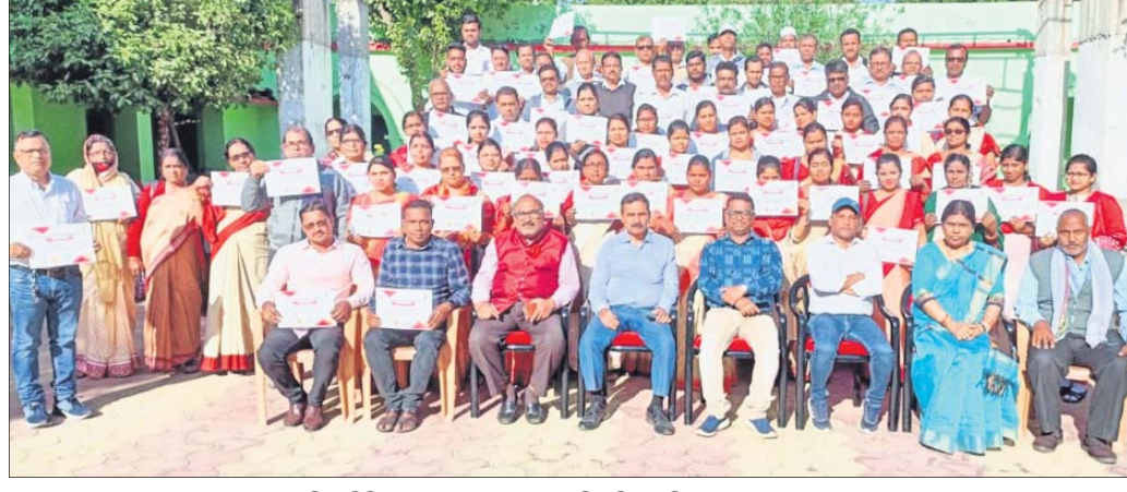
ତାଲିମ ଶିବିରରେ ଯୋଗଦେଇଥିବା ଶିକ୍ଷୟିତ୍ରୀ, ଶିକ୍ଷକ ଓ ଅନ୍ୟମାନେ।