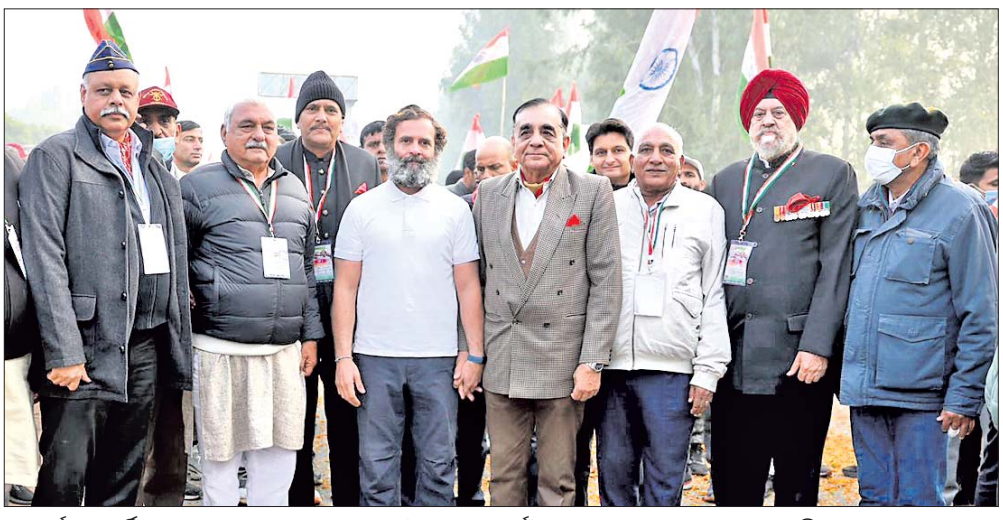
ପୂର୍ବତନ ଆର୍ମି ମୁଖ୍ୟ ଜେନେରାଲ ଦୀପକ କପୁର (ତାହାଣ୍ଡା ଚତୁର୍ଥ) ଏବଂ କେତେକ ଅବସରପ୍ରାପ୍ତ ବରିଷ୍ଠ ସେନା ଅଧିକାରୀ ହରିଆଣାର କୁରୁକ୍ଷେତ୍ରରେ ରବିବାର 'ଭାରତ ଯୋଡ଼ା ଯାତ୍ରା'ରେ କଂଗ୍ରେସ ନେତା ରାହୁଲ ଗାନ୍ଧୀଙ୍କ ସହ ସାମିଲ ହୋଇଛନ୍ତି।