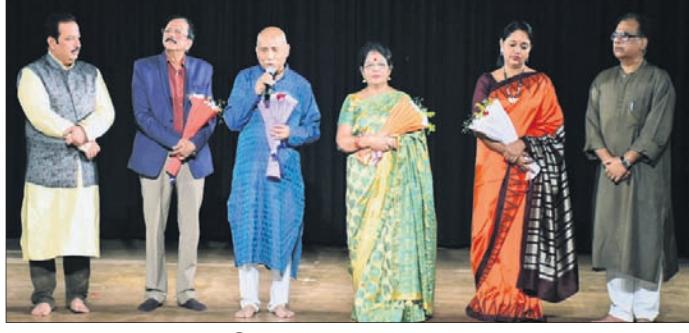
ଉତ୍ସବରେ ଯୋଗଦେଇଥିବା ଅତିଥିମାନେ।