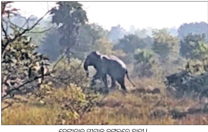
ଡେକାନାଲ ସୀମାରେ ଜଙ୍ଗଲରେ ହାତୀ।

ଅନୁଗୋଳ ଜିଲ୍ଲା ଛେଳିଆପଡ଼ା, ଅଜୀବନହ, ବାରସିଙ୍ଗା, ବଅଁରପାଳର ଗଡ଼ସନ୍ତା ଅଞ୍ଚଳରେ ଆତଙ୍କ ସୃଷ୍ଟି କରି ୪ ଜୀବନ ନେଇଥିବା ନରହତ୍ୟା ହାତୀ ଡେକାନାଲମୁହାଁ ହୋଇଛି। ଶନିବାର ସନ୍ଧ୍ୟାରେ ଉକ୍ତ ହାତୀ ହିନ୍ଦୋଳ ରେଞ୍ଜି ସଞ୍ଚାପଡ଼ା ଅଞ୍ଚଳରେ ପ୍ରବେଶ କରିଥିବାବେଳେ ରବିବାର ଏହାକୁ ଡେକାନାଲରେ ଠାବ କରାଯାଇଛି। ଅନୁଗୋଳ ଘଟଣାର ପୁନରାବୃତ୍ତି ଯେପରି ଡେକାନାଲରେ ନ ହୁଏ, ସେଥିଲାଗି ବନ ବିଭାଗ ସତର୍କ ହୋଇଉଠିଛି। ହାତୀ ଚୁଲୁଥିବା ସ୍ଥାନରେ ପାଟ୍ରୋଲିଂ କଡ଼ାକଡ଼ି କରାଯାଇଛି।