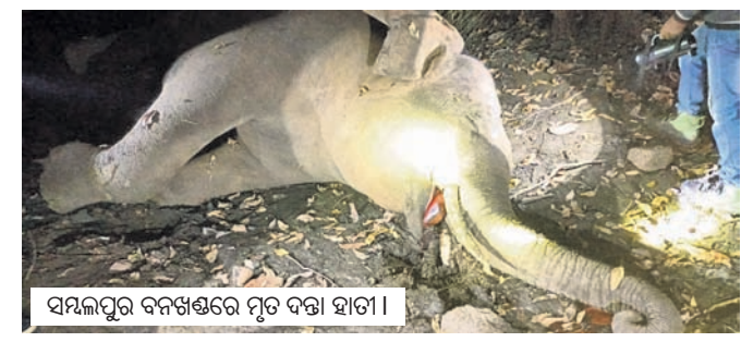
ସମ୍ବଲପୁର ବନଖଣ୍ଡରେ ମୃତ ଦନ୍ତା ହାତୀ।