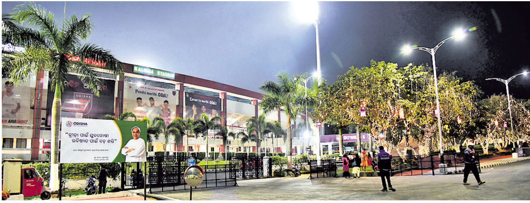
ହକି ବିଶ୍ୱକପ ଅପେକ୍ଷାରେ କଳିଙ୍ଗ ଷ୍ଟାଡ଼ିୟମ ।