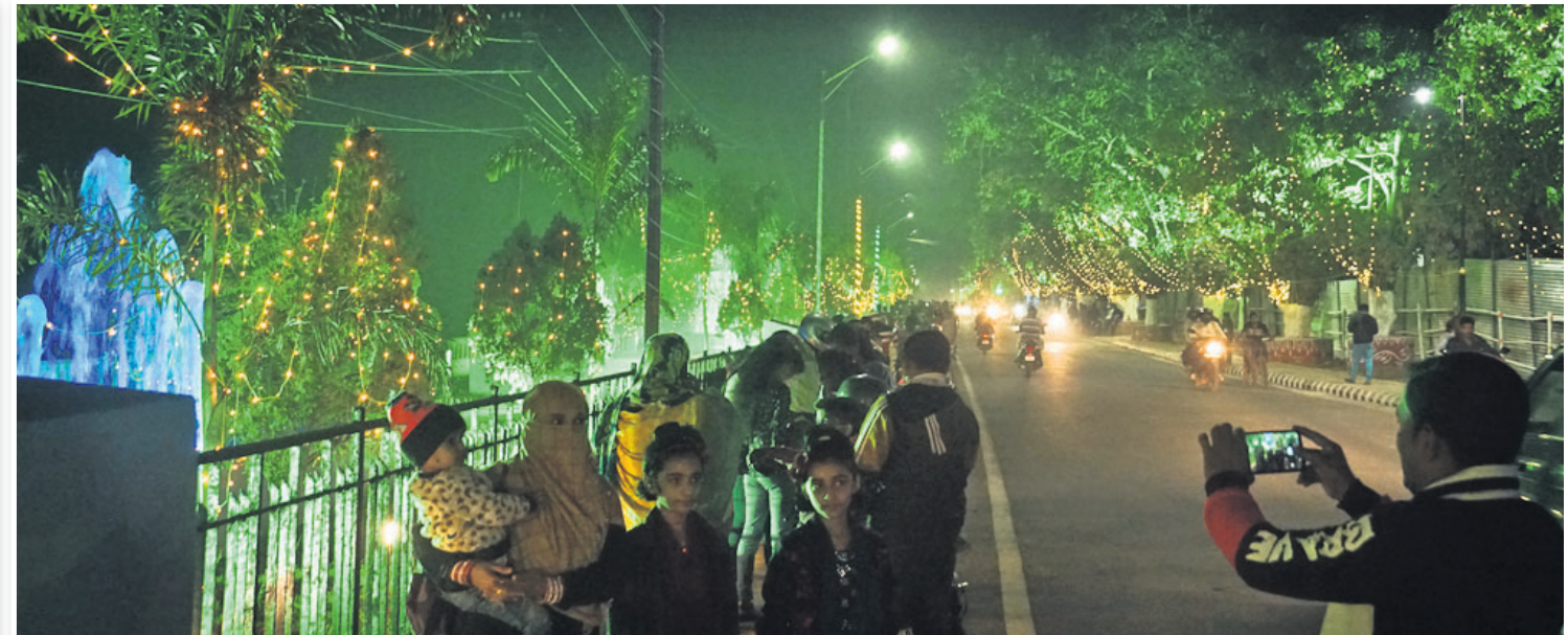
ବାରବାଟୀ ଷ୍ଟାଡ଼ିୟମ ଅଞ୍ଚଳକୁ ଆଲୋକରେ ସଜା ଯାଇଛି ।