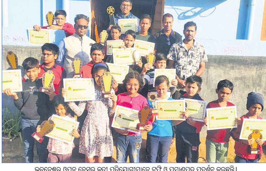
ଭୁବନେଶ୍ୱର ଓପନ୍ ଚେସ୍ କୃତୀ ପ୍ରତିଯୋଗୀମାନେ ଟ୍ରଫି ଓ ପ୍ରମାଣପତ୍ର ପ୍ରଦର୍ଶନ କରୁଛନ୍ତି।

ଲଭେଜକୁ ଚିତ୍ତି ସମୟ ସ୍ଥଗିତ ରଖିବାକୁ ହୋଇଥିଲା। ମ୍ୟାଚ୍ ଶେଷ ବେଳ୍ ବାକିବା ପର୍ଯ୍ୟନ୍ତ ଡେଭିସ୍ ଯଥେଷ୍ଟ ପଞ୍ଚ ମାରିସାରିଥିଲେ। ଟାକ୍‌ର ବିଜୟ ଓ ପରାଜୟ ରେକର୍ଡ୍ ବର୍ତ୍ତମାନ ୨୮-୦ରେ ପହଞ୍ଚିଛି। ଡକ୍‌ଲ୍ୟୁରୀ ଟାଇଟଲ୍ ୨୬ଟି ନକ୍‌ଆଉଟ୍। ବାଲଟିମୋରରେ ଜନ୍ମ ଗ୍ରହଣ କରିଥିବା ଏହି ବକ୍ସର ସହରରେ ବିତାୟ ଲଭେଜ ଏପ୍ରିଲରେ ର୍ୟାନ ଗାସିଆଙ୍କ ସହ ହେବ। ବର୍ଷର ଏହା ଅନ୍ୟତମ ଶ୍ରେଷ୍ଠ ଲଭେଜ ହେବ ବୋଲି ଆଶା କରାଯାଉଛି।