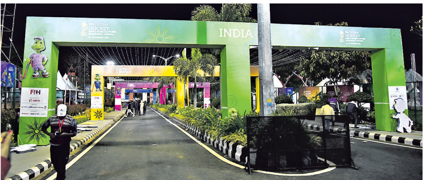
କଳିଙ୍ଗ ଷ୍ଟାଡ଼ିୟମ ପ୍ରବେଶ ପଥରେ ତିଆରି ହୋଇଥିବା ଏକାଧିକ ତୋରଣ ।