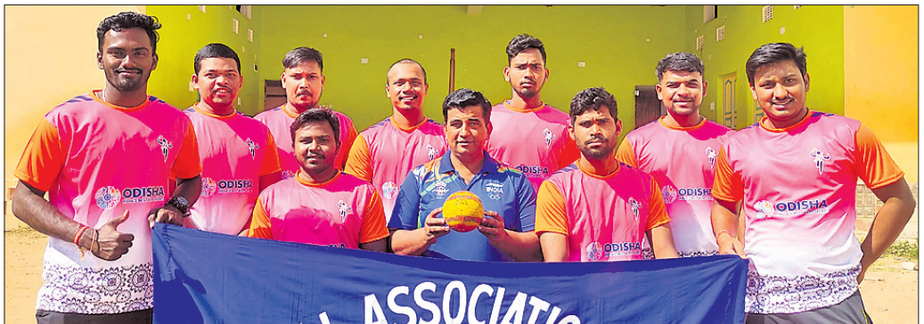
ଭୁବନେଶ୍ୱରରେ ହେବାକୁଥିବା ଜାତୀୟସ୍ତରୀୟ ଓଡ଼ିଶା ଛୁଇଁ ବଲ୍ ପ୍ରତିଯୋଗିତା ପାଇଁ ଯାତ୍ରାରେ ବାହାରିଥିବା ପୁରୀ ଝାଡ଼େଶ୍ୱରୀ କ୍ଲବର ଖେଳାଳିମାନେ।