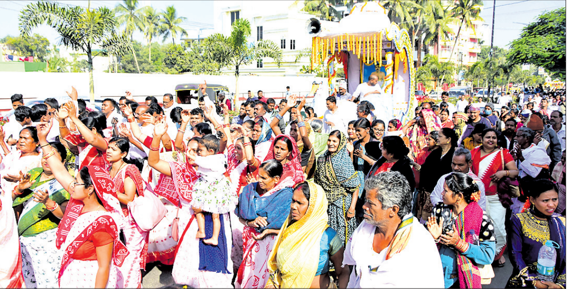
ଠାକୁର ଅନୁକୂଳଚକ୍ରଙ୍କ ଶ୍ରୀକ୍ଷେତ୍ର ଆଗମନର ରବିବାର ଶତବାର୍ଷିକୀ ଅବସରରେ ଅନୁଗାମୀମାନେ ଶୋଭାଯାତ୍ରାରେ ସହର ପରିକ୍ରମା କରୁଛନ୍ତି।