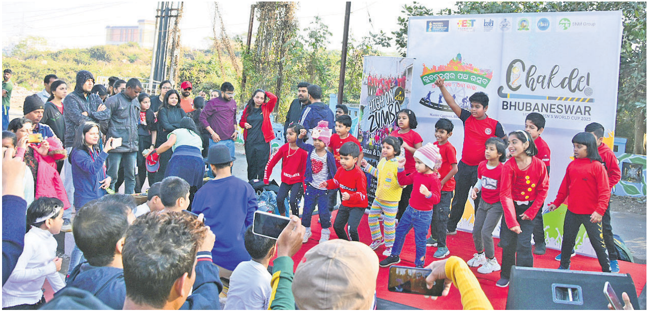
ରବିବାର ଶିଖରଚଣ୍ଡୀରୁ ଇନ୍‌ଫୋସିଟି ରାସ୍ତାରେ ଅନୁଷ୍ଠିତ ପଥ ଉତ୍ସବରେ ନାଚ, ଗୀତ ଓ ମଉଜ ମସ୍‌କିଲିଂରେ ଛୋଟ ପିଲା, ଛାତ୍ରାଛାତ୍ରୀ, ଯୁବବର୍ଗଙ୍କ ସହ ସହରବାସୀ ।