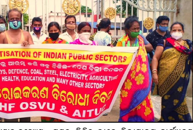
ବାଲେଶ୍ୱର, ୧୮୮୮ (ନି.ପ୍ର): ରାଷ୍ଟ୍ରାଧାର ଉଦ୍ୟୋଗ କ୍ଷେତ୍ରରେ କେନ୍ଦ୍ର ସରକାରଙ୍କ ଘରୋଇକରଣ ମାଟି ବିରୋଧରେ କେନ୍ଦ୍ରୀୟ ଶ୍ରମିକ ସଂଗଠନମାନେ ଆଜି ଦେଶବ୍ୟାପୀ ବିକ୍ଷୋଭ କରିଥିବା ବେଳେ ବାଲେଶ୍ୱରରେ ମଧ୍ୟ ଅନୁରୂପ ପ୍ରତିଫଳନ ପରିଲକ୍ଷିତ ହୋଇଛି । ନ୍ୟାସନାଲ ହର୍ବର୍ଡ଼ ଫେଡ଼େରେସନ, ଓଡ଼ିଶା ପଥବିଜ୍ଞେତା ସଂଘ ଓ ଶ୍ରମିକ ସଂଗଠନ ଏଆଇଟିସିସି

ମହିଳା, ବାହାନଗା ବୁକରୁ ୩ ଜଣ ପୁରୁଷ, ବସ୍ତା ବୁକରୁ ୮ ଜଣ ମହିଳା ଓ ୮ ଜଣ ପୁରୁଷ, ଖଇରା ବୁକରୁ ୫ ଜଣ ପୁରୁଷ ଓ କଣ୍ଠେ ମହିଳା, ସୋର ବୁକରୁ ୬ ଜଣ ପୁରୁଷ, ନାଳଗିରି ବୁକରୁ ୧୭ ଜଣ ପୁରୁଷ ଓ ୬ ଜଣ ମହିଳା, ସିମୁଳିଆ ବୁକରୁ ୩ ଜଣ ପୁରୁଷ, ଓପିଦା ବୁକରୁ କଣ୍ଠେ ପୁରୁଷ କରୋନା ସଂକ୍ରମିତ ହୋଇଥିବା ସରକାରୀ ସ୍ତରକୁ ଜଣାପଡ଼ିଛି । ତେବେ ନୂଆଭାବେ ଚିହ୍ନଟ ହୋଇଥିବା ସମସ୍ତ ସ୍ଥାନୀୟ ସଂକ୍ରମିତ ପୂର୍ବ ସଂକ୍ରମିତଙ୍କ ସଂସ୍ପର୍ଶରେ ଆସିଥିବା ଯୋଗୁଁ କରୋନା ପଜିଟିଭ୍ ହୋଇଥିବା ପ୍ରଶ୍ନାସନ ପକ୍ଷରୁ ସୂଚନା ଦିଆଯାଇଛି ।