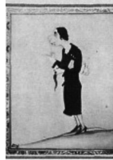
Isabel Oyarzábal de Palencia