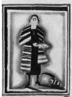
María Lejárraga de Martínez Sierra