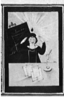
María de Maeztu