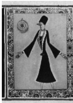
Pura Maortua de Ucelay