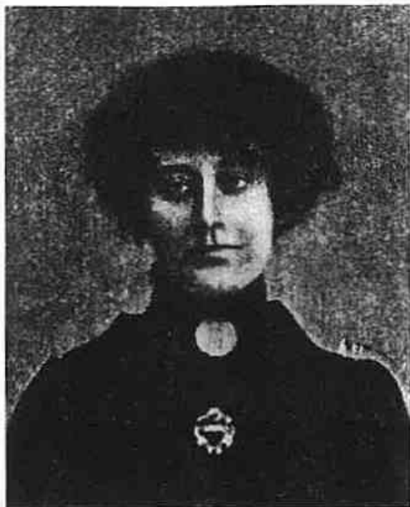
Tegning av Ragnhild Jølsen etter et fotografi tatt i Firenze i 1907.

Under oppholdet i Roma var hun lite opptatt av å farte omkring på museer og i parker. Hun trivdes best sammen med de andre kunstnerne i barer og på kafeer. Det er blitt spekulert vedrørende Ragnhild Jølsens helsetilstand under Italia-oppholdet. Flere kilder hevder at hun til tider var svært syk og noen har gått så langt som å antyde at hun til og med ble smittet av malaria. I et brev til søstrene i juni 1907 forteller Ragnhild at hun hadde hallusinasjoner mens hun oppholdt seg i Roma. Ved et tilfelle skal hun også ha fått blodstyrning. På tross av den dårlige helsen virket det som om hun i Italia var full av optimisme og skapertrang. I sine brev forteller hun om flere prosjekter som hun ville fullføre når hun kom hjem. I realiteten fikk hun skrevet lite mens hun oppholdt seg i Roma.