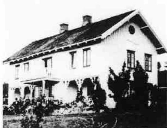
Solbakken, hvor Ragnhild Jølsen bodde sine siste leveår og døde i januar 1908.