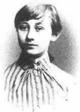
Ragnhild Jølsen som svært ung.

Hun lyttet interessert til dem begge og sugde til seg disse gamle sagnene og fortellingene med stor iver. Den store, vakre hagen på Ekeberg og de dype skogene som omkranset gården var Ragnhild Jølsens barndomsparadis. Her vandret hun fritt omkring, alene eller sammen med katten Piltis. Fyrstikkfabrikken og bruksbyen nede i dalen brydde hun seg mindre om. Den tilhørte det moderne samfunnet og dessuten skremte den henne. Etterhvert som hun ble eldre, gikk hun stadig lengre turer innover i skogene. Aller helst gikk hun i mørket om natten eller når det var måneskinn.