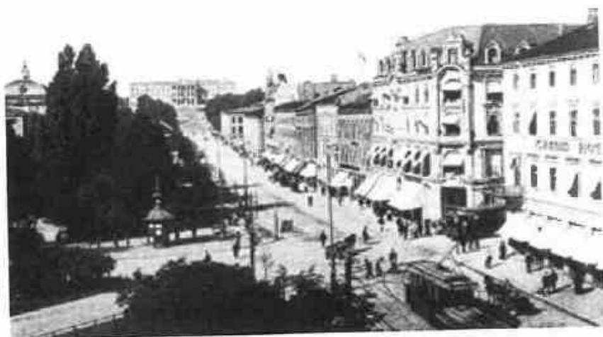
Karl Johans gate i Kristiania omkring 1900.

Hjemme på Ekeberg hadde hun kunnet vandre omkring som det passet henne, og det fortsatte hun også med i hovedstaden.