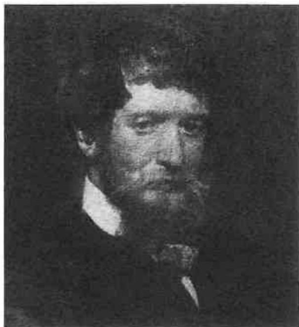
Forfatteren Thomas P. Krag. Han var forlovet med Ragnhild Jølsen i 1895.

Etter Ragnhild Jølsens død i 1908, fant man i hennes etterlatte papirer en bunt med brev, skrevet til henne fra Thomas Krag. På omslaget var det festet en lapp. Det sto: "Dette menneske har for mig aldrig hatt anden betydning end den at han skaffed mig lidt glæmsel for en stærk og ulykkelig kiærlighed jeg dengang bar paa" .