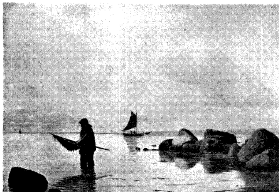
VED KALØVIG. Malet 1876. (Tilhører Stiftsdame Frøken Fr. von Späth)

Billede »Store Dønninger ved Fyrtaarnet Bell-Rock« netop ejer noget af denne imponante Karakter — men vi har næppe haft nogen, der var mere fortrolig med sit Emne end han og kendte baade Skibe og Sø og Himmel mere intimt. Helst maler han vel den kraftigt bevægede Sø under høj Himmel, men ogsaa Naturens fattigere Farver har han paa sin Pallet, og en Gang imellem frister Vesterhavets vidunderlige Solnedgange ham til at svælge i de allerstærkeste Farver som i de pragtfulde Billeder fra Vestkysten.