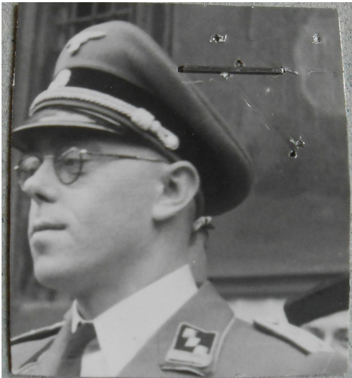
Obrázek č. 1: Walter Jacobi. Podle insignií SS-Hauptsturmführera pořízeno mezi prosincem 1939 a jarem 1942.