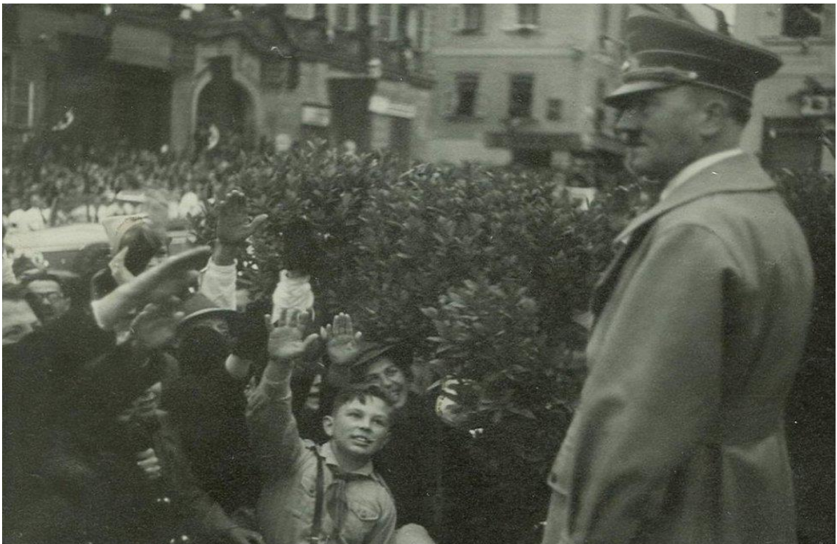
Obrázek 4: Adolf Hitler ve Znojmě dne 26. října 1938 (zdroj: fotoarchiv Jihomoravského muzea ve Znojmě).