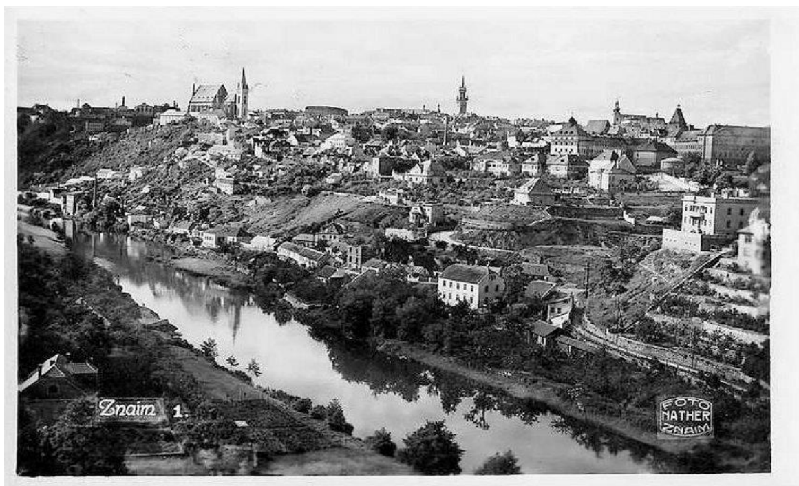
Obrázek 1: Město Znojmo v roce 1938, pohlednice.