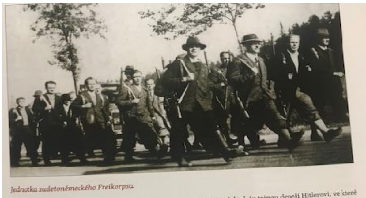
Obrázek 13: Členové německých svobodných sborů.