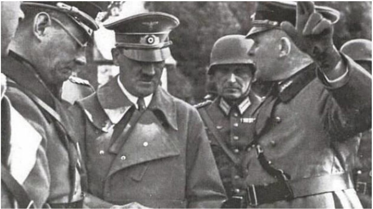
Obrázek 7: Adolf Hitler s důstojníky Wehrmachtu při návštěvě Sudet.