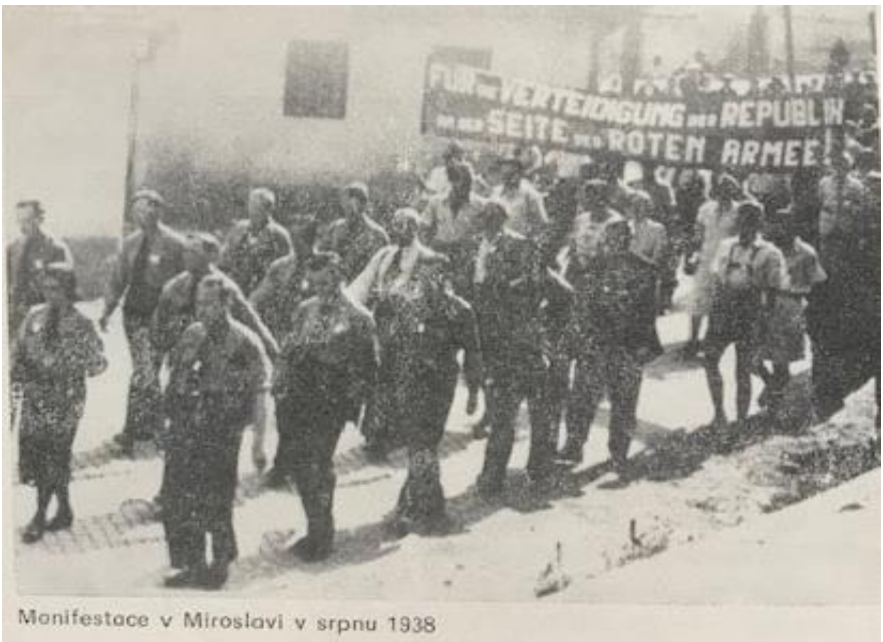
Manifestace v Miroslavi v srpnu 1938