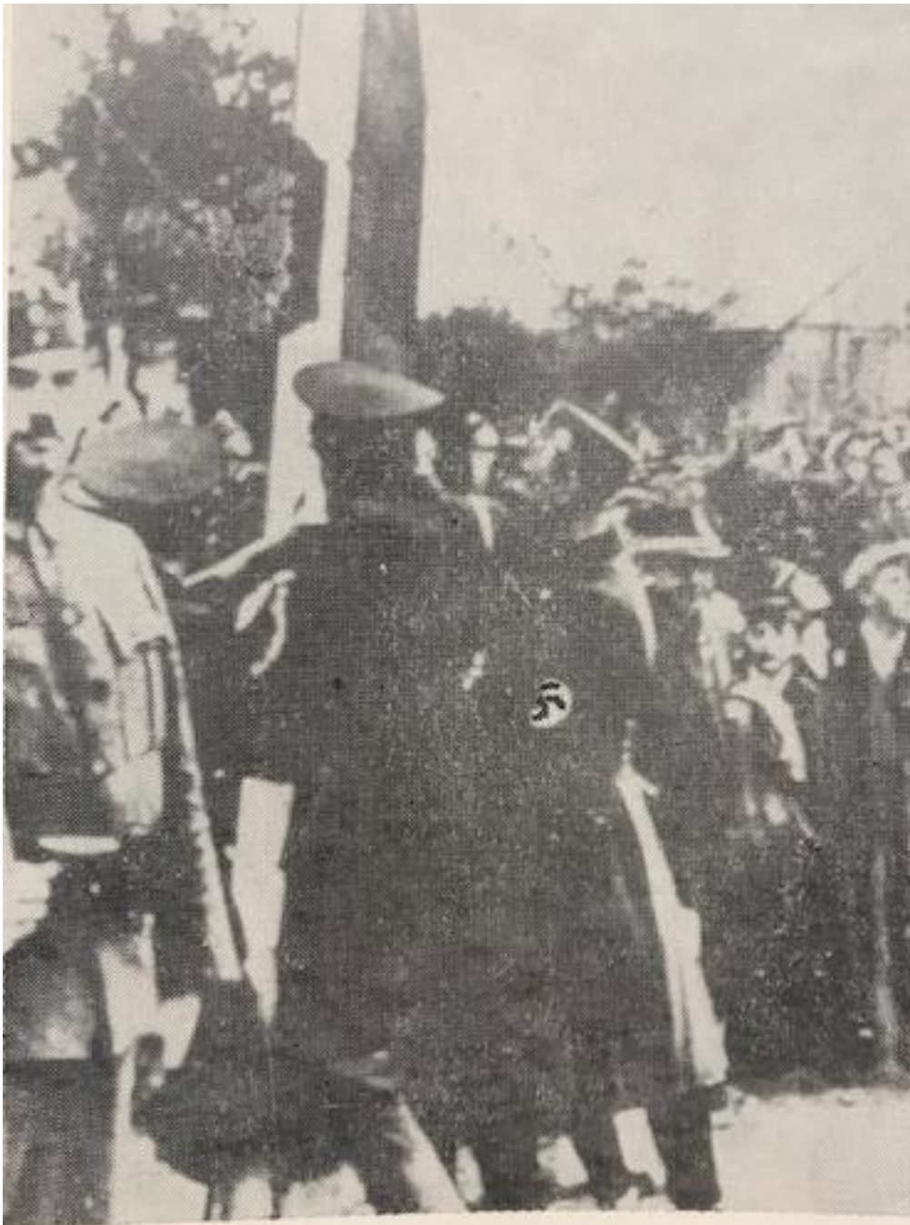
Nacisté odstraňují hraniční sloup v Hatích

Obrázek 31: Nacisté ničí hraniční sloupy v Hatích u Znojma.