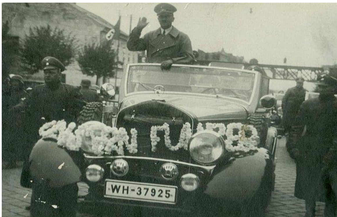
Obrázek 2: Adolf Hitler ve Znojmě dne 26. října 1938.