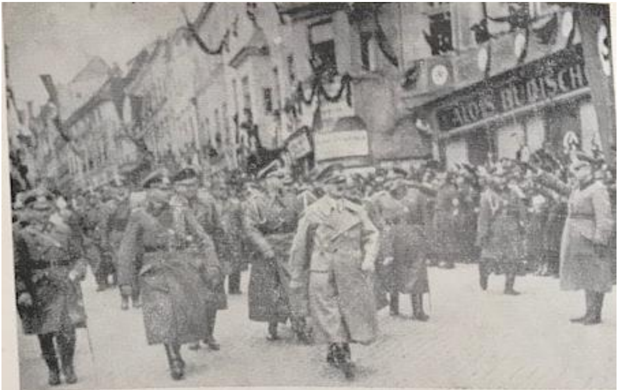
26. října 1938 pochoduje A. Hitler znojemskými ulicemi