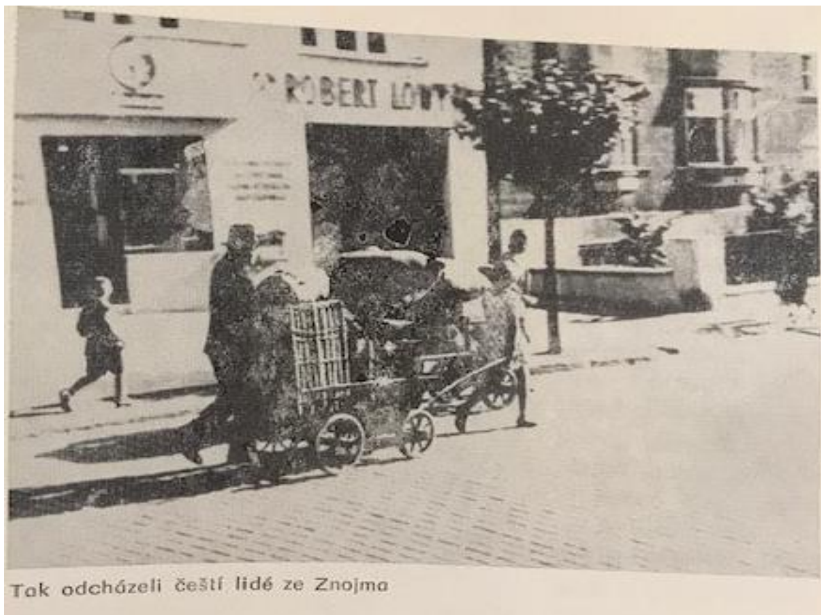
Obrázek 14: Lidé odchází ze Znojma do vnitrozemí Československa.