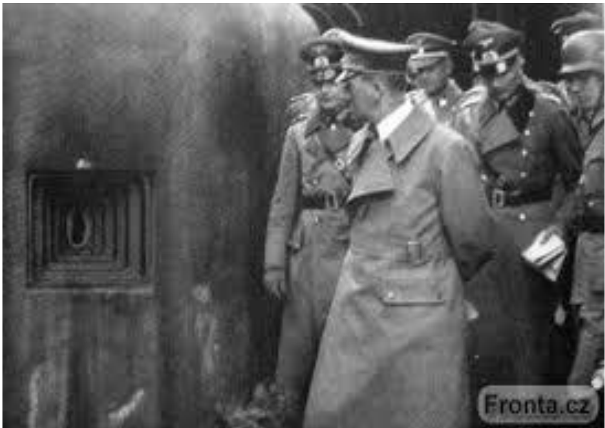
Obrázek 5: Adolf Hitler si prohlíží československé opevnění v Šatově v roce 1938.