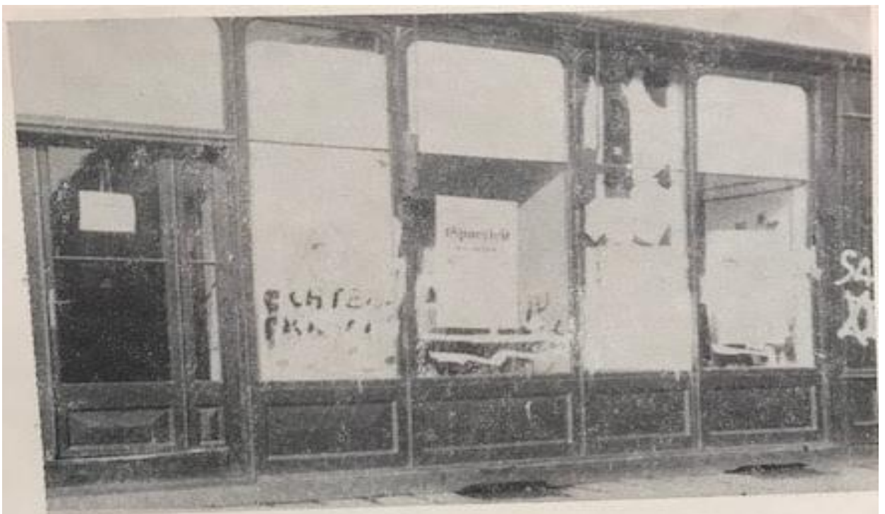
Ze znojemských ulic – zří 1938