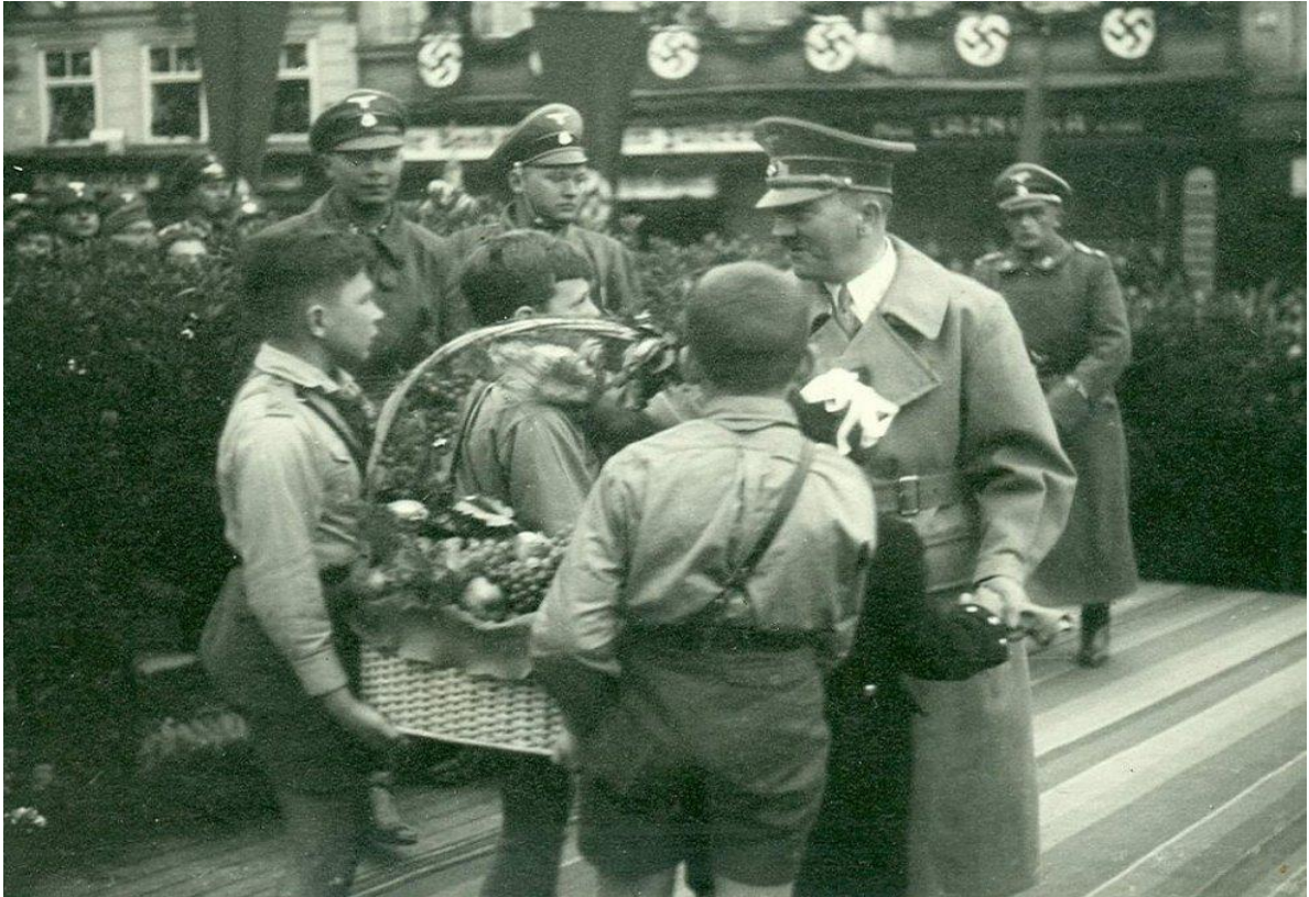
Obrázek 3: Adolf Hitler ve Znojmě dne 26. října 1938.