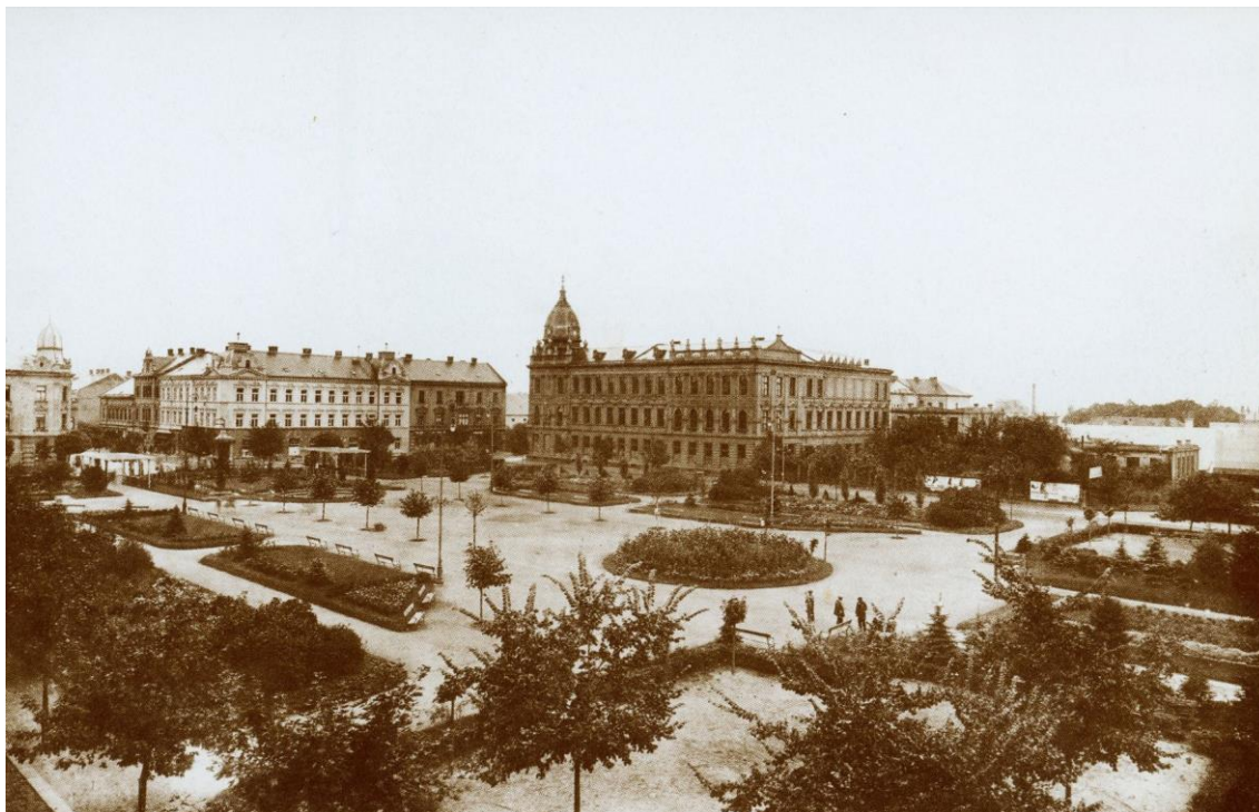
Obrázek 4: Nedostavěné náměstí Čs. legií s parkovou úpravou

dodnes výstavní částí Pardubic. 87 S výstavbou v této lokalitě je spojeno zejména živnostenské družstvo, které tu postavilo množství domů s obchody. Převážně zde však stavěli soukromníci.