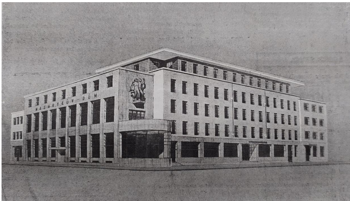
Obrázek 7: Vizualizace okresního domu z března 1928. Výsledná podoba je až na nepatrné detaily totožná.