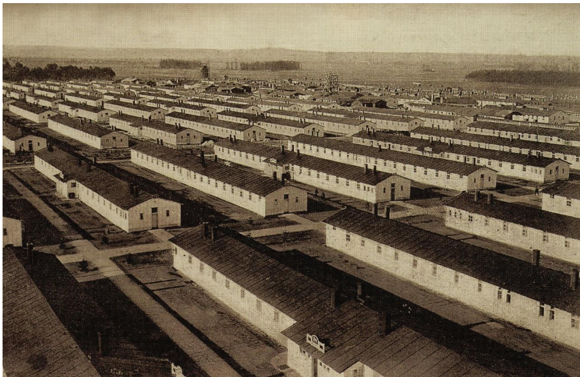
Obrázek 5: Karanténa

Během první světové války byla karanténa v Pardubicích velice důležitou součástí městského dění, jak je popsáno v první kapitole. Zřejmě nikdo ale nečekal, že tak důležitá bude i po válce a vlastně i po celá dvacátá léta. Byl to následek ohromné bytové krize, která se nedařila vyřešit. Město tak v bývalých nemocničních barácích zřizovalo provizorní bytové jednotky a karanténa sehrála v řešení bytové nouze velice specifickou roli.