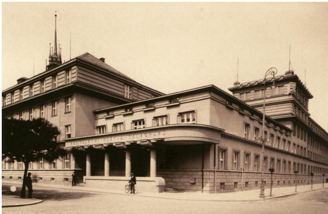
Obrázek 6: Hlavní průčelí budovy Ředitelství pošt a telegrafů