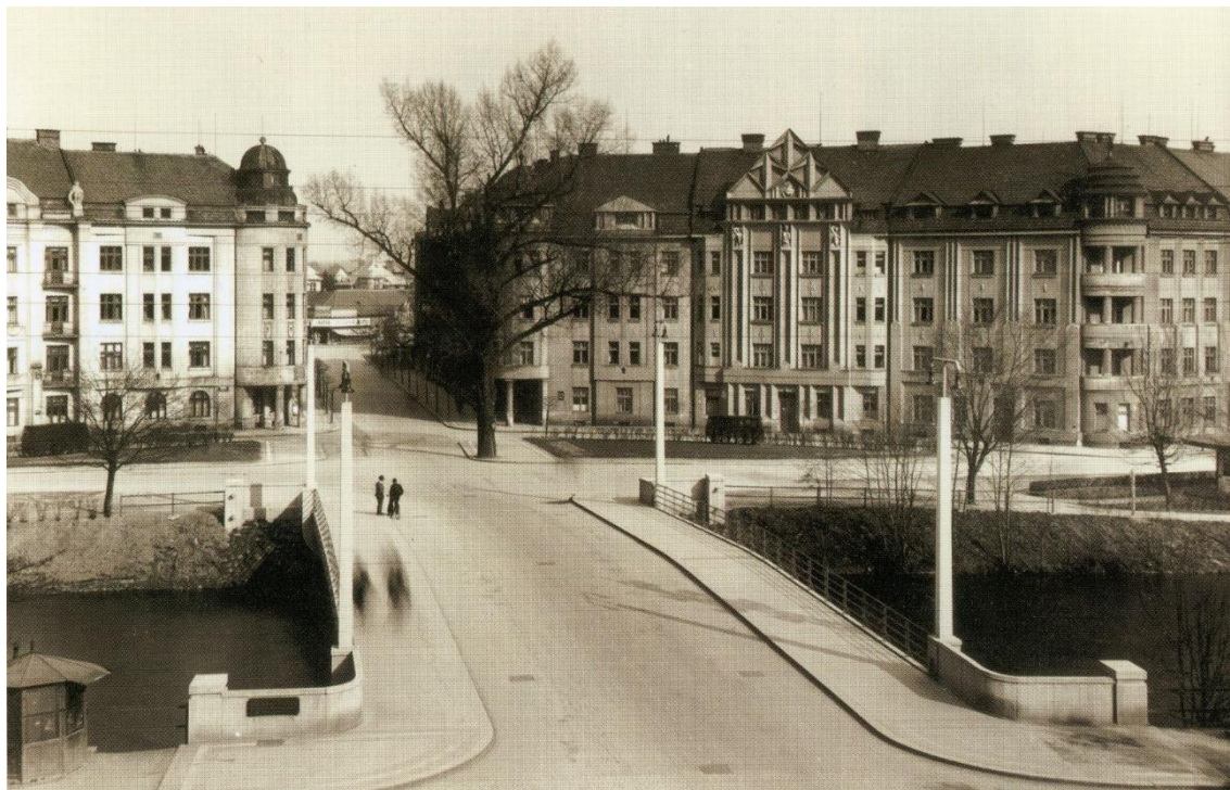
Obrázek 3: Čechovo nábřeží

prvních domků započala na podzim 1927 a o dva roky později jich stálo již 15 a další byly v přípravě. Možnost zakoupit si domek však neměli pouze členové družstva. Nečlenové sice přicházeli o některé výhody, ale hotový domek si mohli koupit za stejnou cenu, jelikož družstvo nebylo výdělečný podnik. Podle Městské spořitelny, která celý projekt zastřešovala, se této kolonii začalo říkat Spořilov. 76