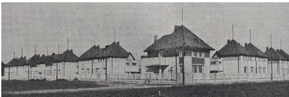
Obrázek 2: Sporilov (zdroj: Východočeský Republikán , 27. 9. 1929)