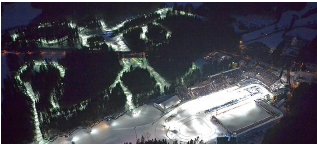
Obrázek 2: Vysočina aréna během MS v biatlonu, zdroj: vysocina-arena.cz

Z grafu číslo 1 můžeme vidět celkové náklady od začátku rekonstrukce, která byla započata v roce 2005 a skončila v roce 2016. Celkové náklady byly ve výši 443 mil. Kč. V první části rekonstrukce bylo zainvestováno 120 mil. Kč. Financování dalších etap bylo zajištěno pomocí dotací od MŠMT, kraje Vysočiny, Nového Města na Moravě a Evropských dotací.