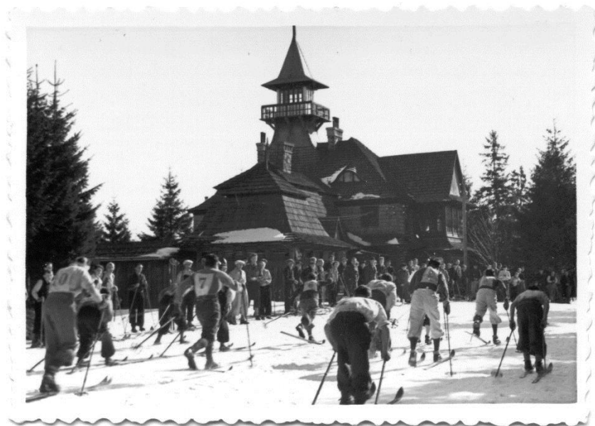
Obrázek 1: Chata na Harusově kopci

Svému účelu sloužila chata do 29. září 1942, kdy ji zničil požár. Chata vyhořela do základů. Uvažovalo se o výstavbě nové chaty, ale finanční prostředky to nedovolily a dalším důvodem byl nedostatek vody na Harusově kopci. (Honzlová, 2003)