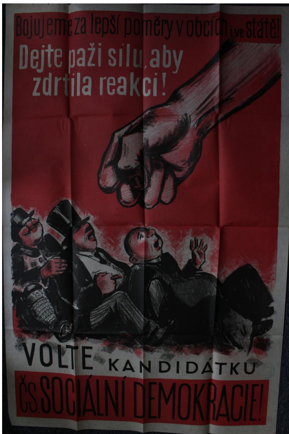
Obrázek 2 – Volební plakát Československé sociálně demokratické strany dělnické. 69