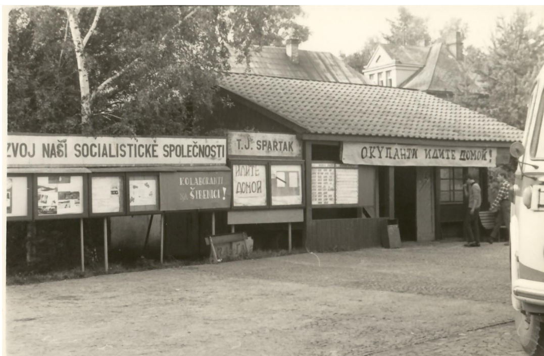
Obrázek 22: Nápis na svratecké autobusové zastávce „Okupanti, jděte domů“, (archiv města Svatky).