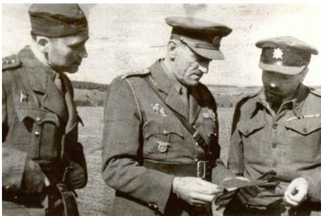
Obrázek 3: Velitel 2. čsl. samostatné paradesantní brigády Pplk. Vladimír Příkryl (uprostřed), (zdroj: http://www.acr.army.cz/informacni-servis/zpravodajstvi/bojovnici--kteri-byli-prepravovani-vzduchem-60800/ ).