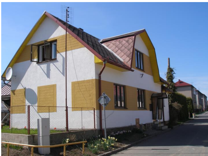
Obrázek 8: Současný pohled na dům Jaroslava Preislera, kde se ukrývala radistka skupiny Vpřed Tamara, (vlastní archiv autora).