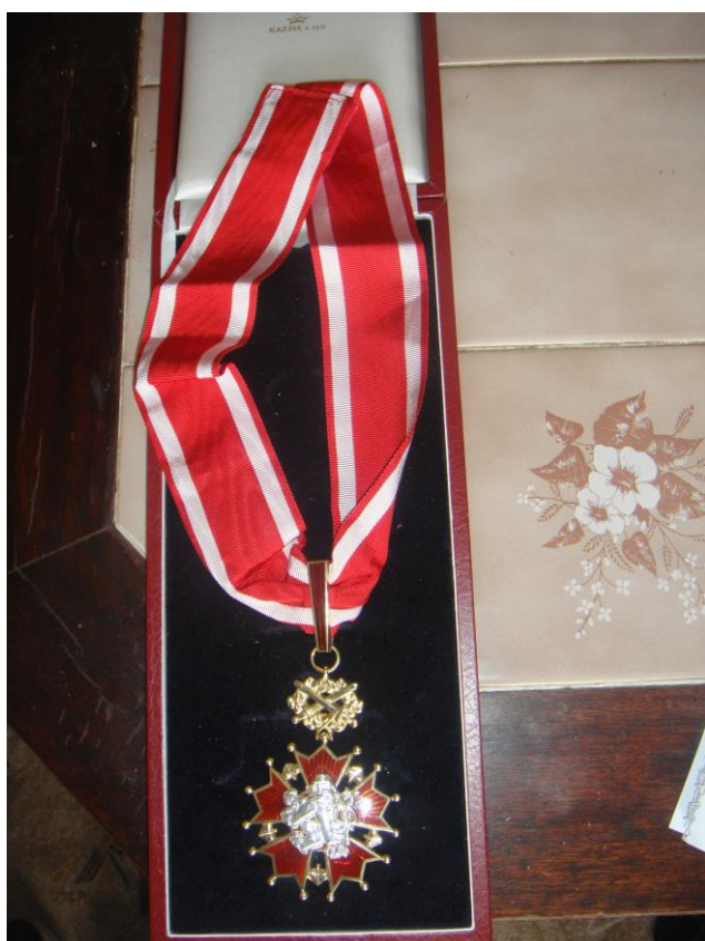
Obrázek 29: Řád Bílého lva, (vlastní archiv autora).