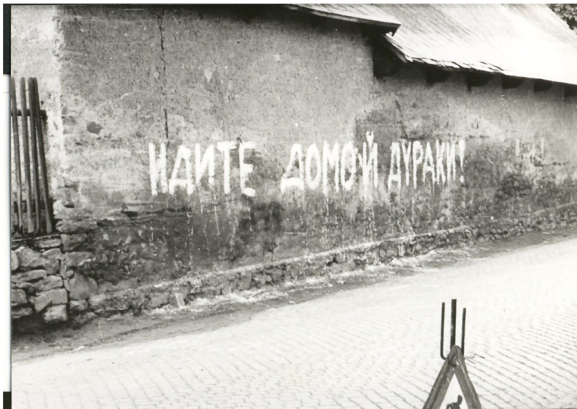
Obrázek 23: Nápis na Hanychově statku „Jděte domů, hajzlové!“.