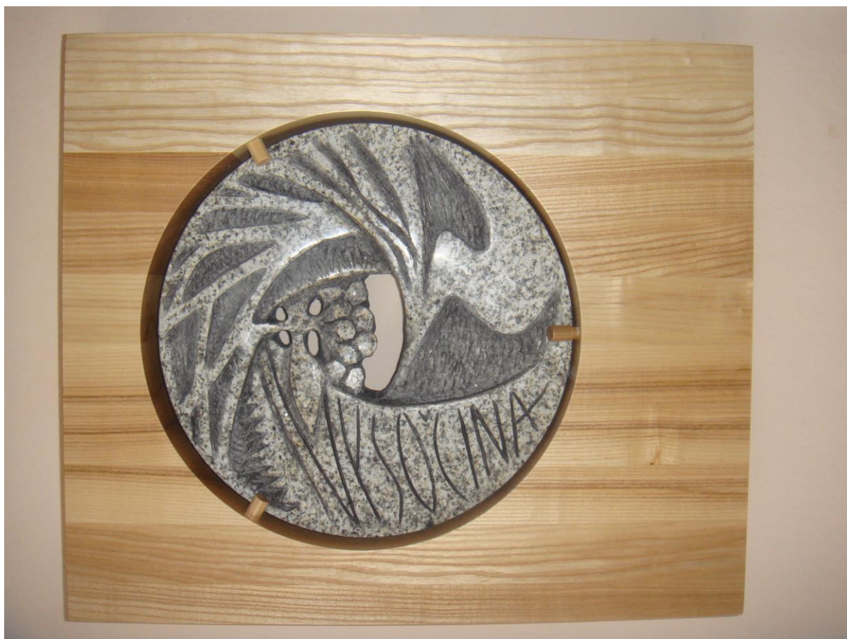
Obrázek 26: Nejvyšší ocenění kraje Vysočina, které se uděluje pravidelně lidem, kteří se svou dlouhodobou prací zasadili o významný prospěch obyvatel Vysočiny, (vlastní archiv autora).