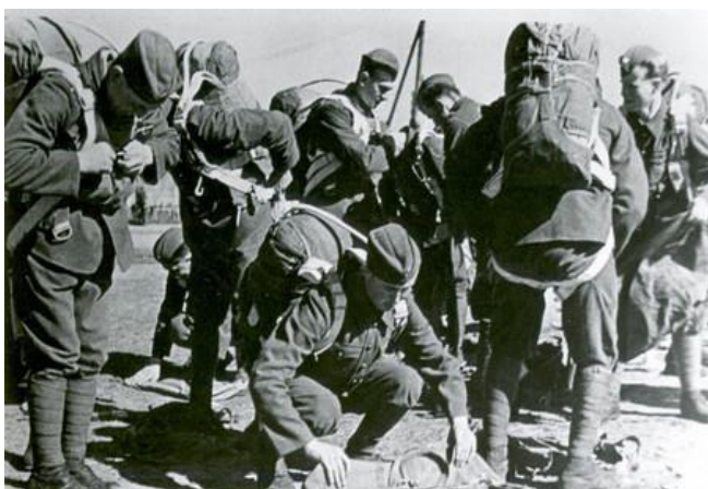
Obrázek 4: Upínání padákových postrojů v Jefremově, (zdroj: http://www.acr.army.cz/informacni-servis/zpravodajstvi/bojovnici--kteri-byli-prepravovani-vzduchem-60800/ ).