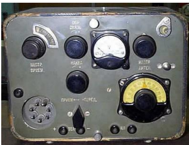
Obrázek 10: Ilustrační foto sovětské radiostanice SEVER, kterou používal Jan Velík, (zdroj: http://forum.valka.cz/viewtopic.php/t/81822 ).