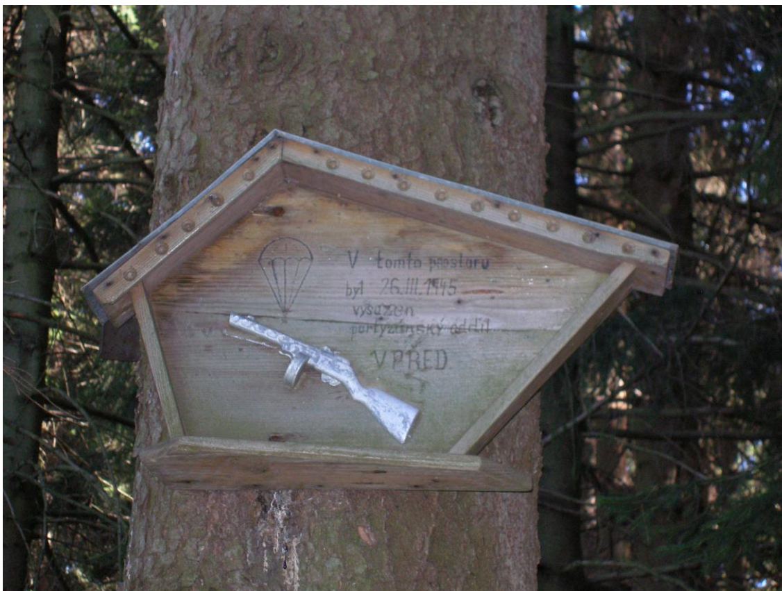
Obrázek 7: Místo seskoku partyzánské skupiny Vpřed na Moravské Svatce.