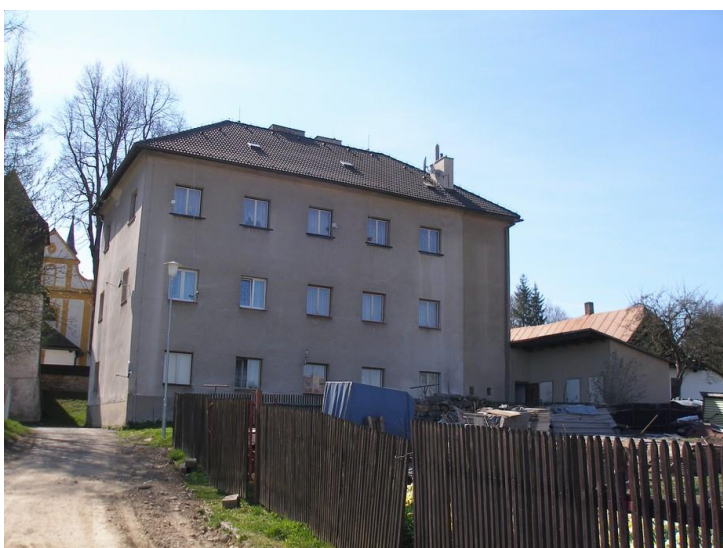
Obrázek 13: Současný pohled na bývalou stanici Jagdkommanda, pohled od domu Jar. Perislera, (vlastní archiv autora).