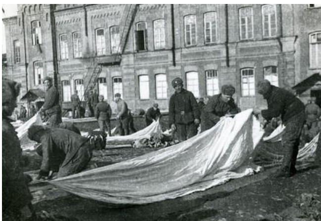
Obrázek 5: Balení padáků.