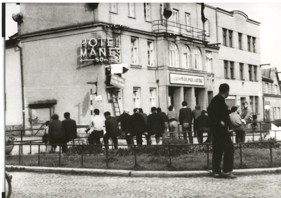
Obrázek 24: Sundávání směrových cedulí na náměstí 9. května ve Svatce, srpen 1968, (archiv města Svatky).