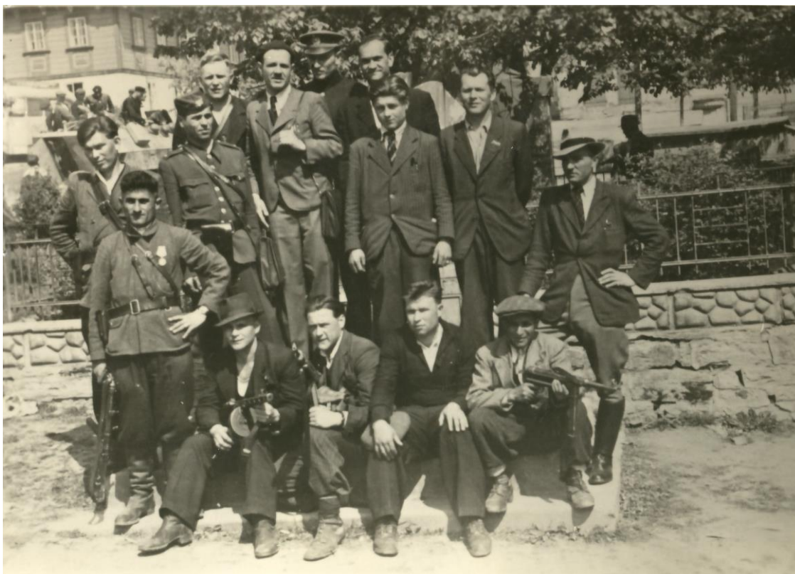
Obrázek 12: Partyzáni skupiny Vpřed, květen 1945.