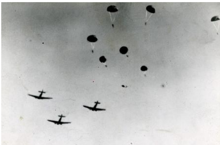
Obrázek 6: Seskoky příslušníků 2. čl. parabrigády, (zdroj: http://www.acr.army.cz/informacni-servis/zpravodajstvi/bojovnici--kteri-byli-prepravovani-vzduchem-60800/ ).