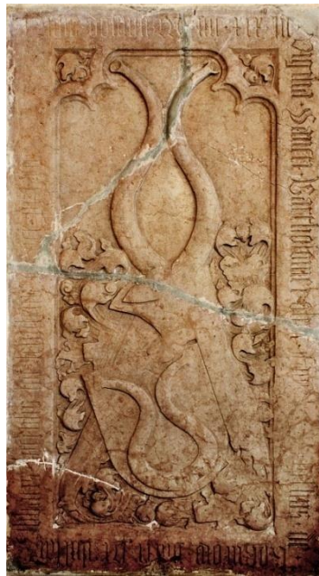
Náhrobek Beneše z Kocúrova