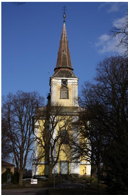
Kostel sv. Filipa a Jakuba v Trhové Kamenici