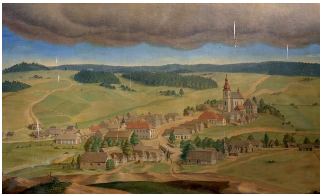
Pohled na Trhovou Kamenici roku 1852 – spodní část oltářního obrazu v kostele sv. Filipa a Jakuba