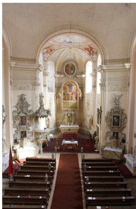
Obr. příloha 2