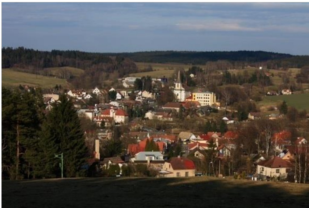
Pohled na Trhovou Kamenici v současnosti