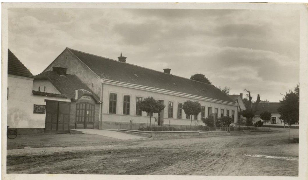
Obr. 2 Stará škola v Jezeřanech