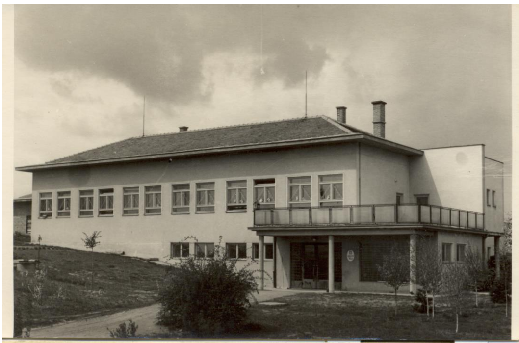
Obr. 9. Nová školní budova pro obce Jezeřany a Maršovice postavená v roce 1950