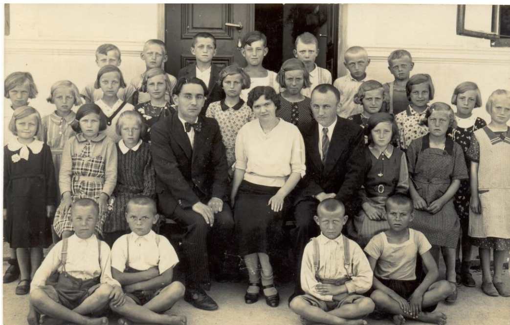
Obr. 5 Žáci jezeřanské školy v roce 1933