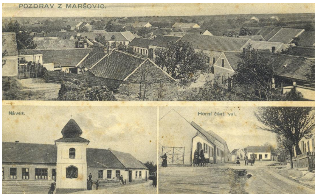
Obr. 8 Komponovaná pohlednice Maršovic, na spodní fotografii vlevo je za zvonící patrná budova maršovické školy (asi 1925)