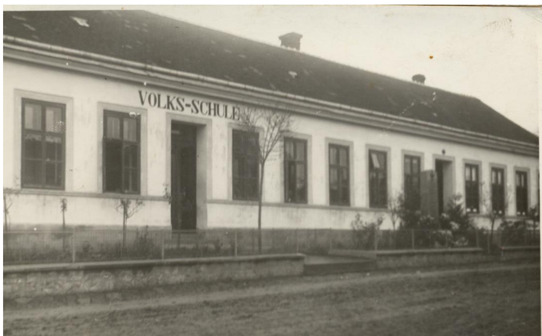
Obr. 3 Stará škola v Jezeřanech v době okupace