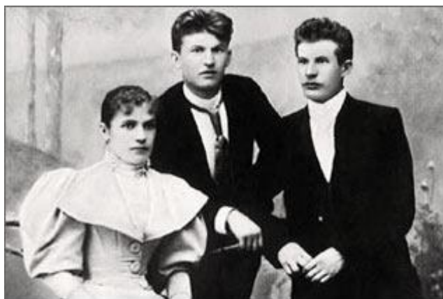
Obrázek č. 4: Tomáš Baťa s rodinou