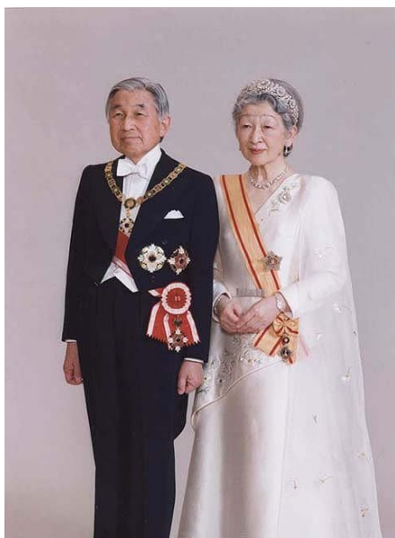
Obrázek č. 2: Jejich Veličenstva