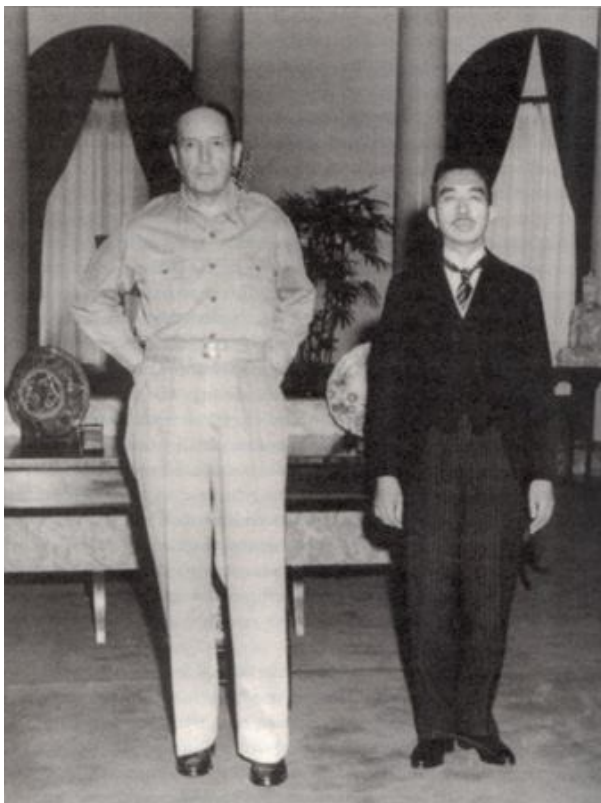
Obrázek č. 7: MacArthur a císař Hirohito