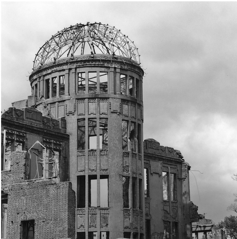
Obrázek č. 6: Kostra průmyslového paláce v Hirošimě

zdroj: http://www.ceskatelevize.cz/porady/10262550261-sumne-stopy/210522162350001-jan-letzel/