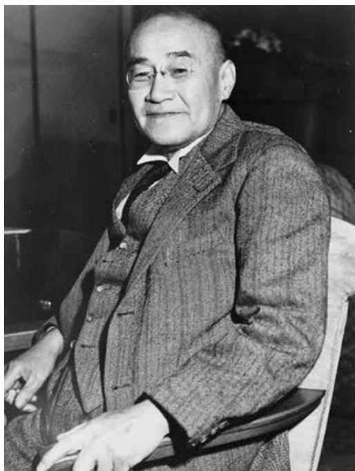
Obrázek č. 8: Šigeru Jošida