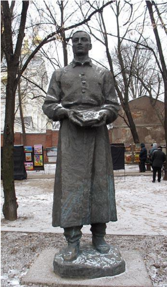
Пам'ятник Г.С. Сковороді вул. Університетська, 10. Скульптор Кавалерідзе І.П. 1992 р.

Життя Г. С. Сковороди. Єдиним, але вельми славетним діячем науки у Слободській Україні був Григорій Савич Сковорода — великий філософ і богослов, перший самостійний філософ не тільки в Україні, але і в Росії, бо таким його признала тепер і російська філософична наука. Родився Г. С. Сковорода у 1722 р. у Гетьманщині у с. Чернухах і був сином козака Лубенського полка, значить, козачого роду, і ім'я його батька Сави я знайшов у компуті (спискові) козаків Лубенського полка. Іще малим хлопчиком він співав на клиросі, бо мав гарний голос. Батько оддав його по його охоті в науку до Київської Духовної Академії, де він гарно учився, але його було вибрано у півчі у царську капелу в Петербург, де воцарилася Лизавета Петрівна, котра дуже любила свою капелу. Цариця через якийсь час поїхала до Києва, і туди знов в Академію поступив Г. С. Сковорода, щоб продовжувати там своє учення. В Академії у початку XVIII ст. професором філософії і богословія був славетний Феофан Прокопович , котрий стояв за відродження богословської науки, а в часи Сковороди вельми звісний Георгій Кониський; у нього Сковорода слухав лекції по філософії, котра