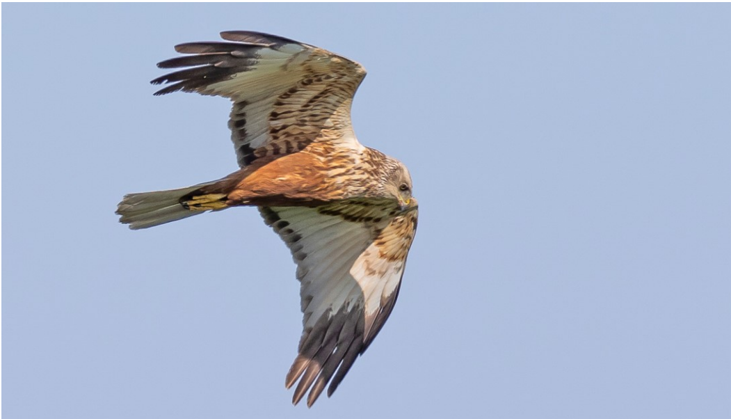
Rørhøg yngler med flere par i områdets rørskove.

For Natura 2000-områder med habitatnatur eller levestedskortlagte arter og fugle på udpegningsgrundlaget, er arealet af habitatnatur samt antallet af småsøer og levesteder, kortlagt i tredje kortlægningsperiode, vist nedenfor. For de naturtyper og levesteder for arter og fugle, hvor der er udviklet et tilstandsvurderingssystem, er den beregnede tilstand ligeledes angivet. For arter og fugle uden tilstandsvurderingssystem henvises til basisanalysen og MiljøGIS . Se desuden basisanalysen for beskrivelse af metoder og en mere detaljeret omtale af naturens tilstand i området.