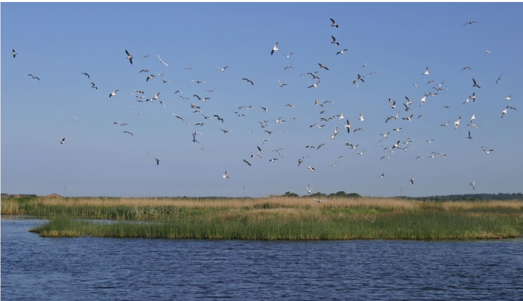
Udsigt over Husby Sø.

Dette Natura 2000-område er specielt udpeget for at beskytte områdets to store næringsrige søer. Området er primært karakteriseret ved de to søflader omkranset af store arealer med højt rørskov. Af arter bør nævnes en lang række undervandsplanter, herunder bl.a. vandranke, der findes med en lille bestand i Nørresø samt odder. Blandt ynglefuglene bør nævnes rørdrum, rørhøg og blåhals, der alle har solide bestande i området.