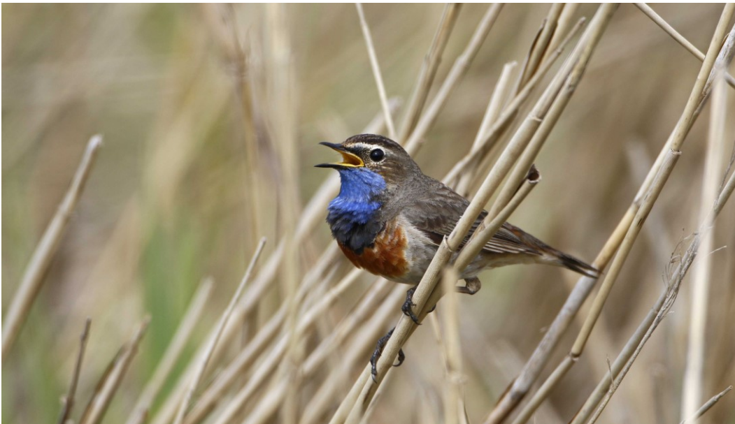
Blåhals på yngleplads i området rørskove.