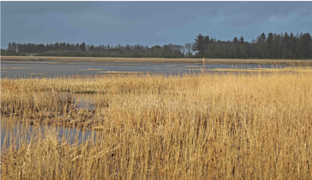
Nørresø med udbredt rørskov omkring.

Udvalgte forvaltningsbare parametre i tilstandssystemet gennemgås i basisanalyserne, og det kan heraf ses hvilke tiltag, der kan iværksættes for at sikre eller genoprette naturtyperne eller arterne/fuglenes levesteder.