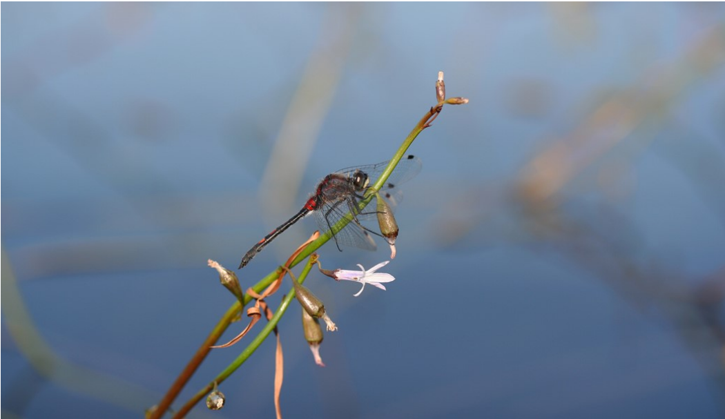
Skørsø er naturtypebestemt som lobeliesø, hvor tvepibet lobelie er en karakteristisk art for naturtypen.

bestandstæthed, hvilket er karakteristisk for næringsfattige og survandede søer. Miljømålet for Skørsø er en god økologisk tilstand. I basisanalysen for vandområdeplaner 2021-2027 er søen vurderet til at have en moderat økologisk tilstand.