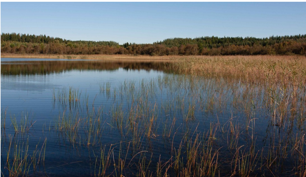
Udsigt over Skørsø som er naturtypebestemt som lobeliesø.

Dette Natura 2000-område er specielt udpeget for at beskytte Skørsø som er en lav- og klarvandet lobeliesø. Derudover er området udpeget for odder. Størstedelen af arealet udgøres af søflade, mens resten af arealet udgøres af en bredzone som søen periodisk oversvømmer, især i vintermånederne og de tidlige forårs måneder. Søen er beliggende i et smeltevandsområde nordvest for Vinderup, og er antageligt dannet i et dødishul. Skørsø er uden egentlige tilløb og afløb. Søen har en maxdybde på 2,3 m i den nordøstlige del og en middeldybde på 0,85 m. Inden for oplandet på ca. 60 hektar, som primært består af skov, er der kun en bebyggelse og ingen større forureningskilder.