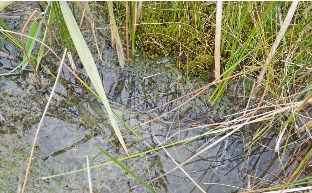
Kildevæld med udfældning af kildekalk samt kransnålalger og artsrig mosflora.

Udvalgte forvaltningsbare parametre i tilstandssystemet gennemgås i basisanalyserne, og det kan heraf ses hvilke tiltag, der kan iværksættes for at sikre eller genoprette naturtyperne eller arterne/fuglenes levesteder.