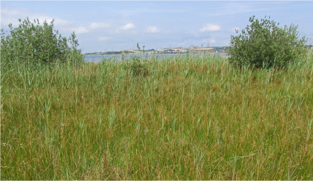
Kildevæld og rigkær i Tvedkæret er fortsat domineret af butblomstret siv og tagrør.

Størstedelen af den gamle havskrænt er helt tilgroet i vedplanter, og kun en mindre del indeholder stadig lysåbent kalkoverdrev. Engarealet mod vest har ikke været omlagt i mange år, men har været gødsket og indeholder en del kulturbetingede plantearter.