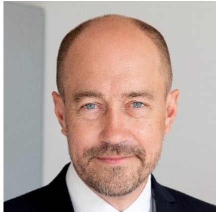
Miljøminister Magnus Heunicke

Natura 2000-områder rummer nogle af Europas og Danmarks største og mest værdifulde naturområder og repræsenterer en stor del af biodiversiteten. De danske Natura 2000-områder bidrager til det fælles EU-mål om 30 pct. beskyttet natur på land og til havs.