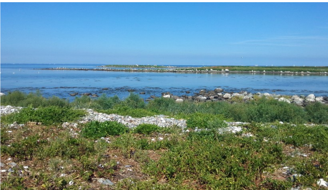
Naturtypen strandvold med flerårige planter.

Geologiske interesser har også været i spil ved udpegningen. Nordre Rønner er opstået ved landhævning og med koncentrationer af store sten, friskyllet fra istidsaflejringer. Nordre Rønner består af en gruppe stenøer, som ligger for enden af et 8 km langt sandrev, som udgår fra nordkysten af Læsø. På den største af rønnerne, Spirholm står der et fyrtårn, og der har tidligere været beboelse. Vandet i området er generelt lavvandet med dybder under 10 m, enkelte steder dog op til 20 m dybde. Det centrale revområde er omgivet af sandbund og sandbanker, og i området findes desuden som nævnt en forekomst af boblerev, som er undersøiske formationer dannet af udstrømmende gas. Boblerevene forekommer særligt langs områdets nordlige afgrænsning og har forskellige strukturer med plader, huler, udhæng og hylde.