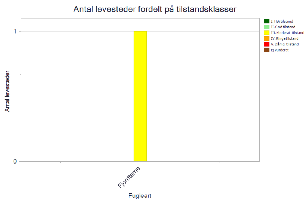
Antal og tilstand af de kortlagte levesteder for ynglefugle.

De enkelte levesteders tilstand kan ses på Miljøstyrelsens digitale kort i MiljøGIS .