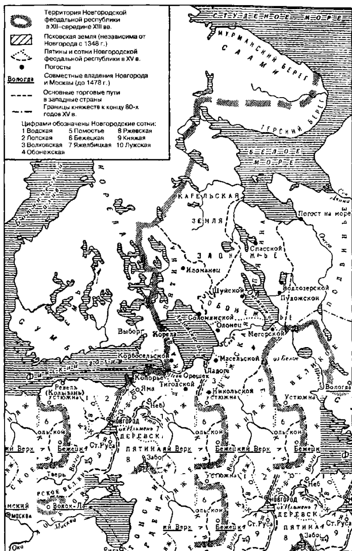
Новгородская феодальная республика в XII—XV вв. (Муравьев А.В. и др. Историческая география эпохи феодализма. Западная Европа и Россия в V—XVII вв. М., 1973)

У подножия социальной пирамиды находились черные люди . В самом Новгороде и его пригородах к этой категории населения принадлежали мелкие торговцы, ремесленники и рабочие, которые жили своим трудом, нередко кредитуюсь у высших классов. Жители пятин — смерды — были свободными крестьянами, которые обрабатывали государственные земли Великого Новгорода, и половники — арендаторы частной земли, которые расплачивались с хозяином частью (нередко половиной) собранного урожая.