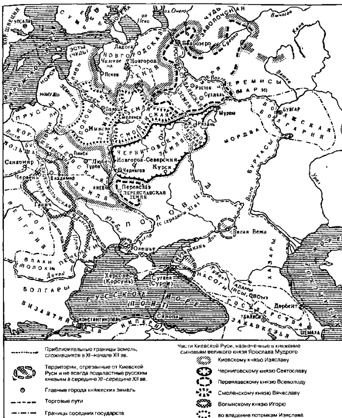
Киевская Русь во второй половине XI — первой трети XII вв. (Муравьев А.В. и др. Историческая география эпохи феодализма. Западная Европа и Россия в V—XVII вв. М., 1973)

Русские также торговали с печенегами, половцами и другими кочевыми народами, сбывая им мед, меха, бронзовые зеркала, бусы, возможно, кольчуги и невольников и т. д. в обмен на рогатый скот, лошадей, овец. 27 Как и в других случаях, торговлю отличал исключительно меновой характер. 28 Хлеб из Руси в рассматриваемый период не вывозился. Русское зерно не поступало даже в византийские владения в Крыму. Также не сохранилось известий о его поставках печенегам и половцам в обмен на товары кочевого хозяйства. 29