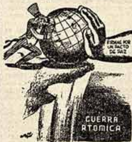
Остановить поджигателей войны!