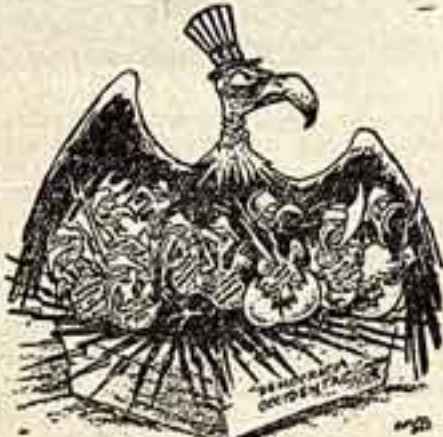
Паседка и ее выводок

Все шире развертывает сегодня кубинский народ.