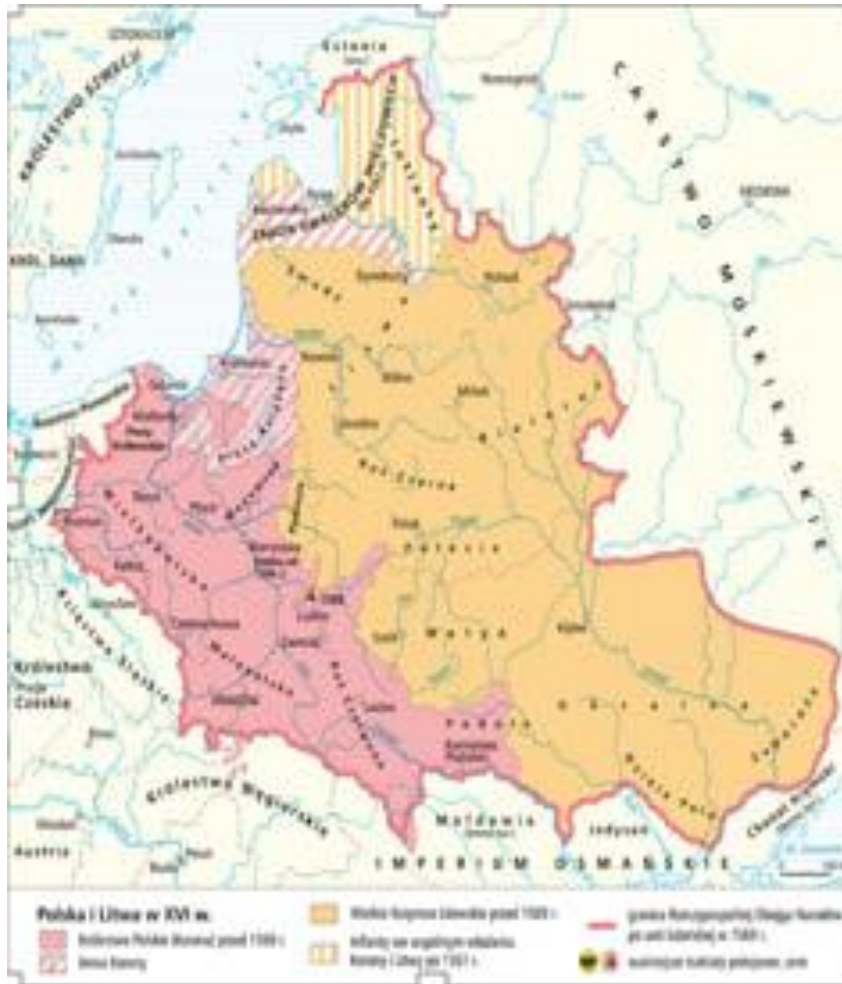
Рис.3.1. Польща та Литва до утворення Речі Посполитої

складали по 10% кожний землевласників [13,с.65].