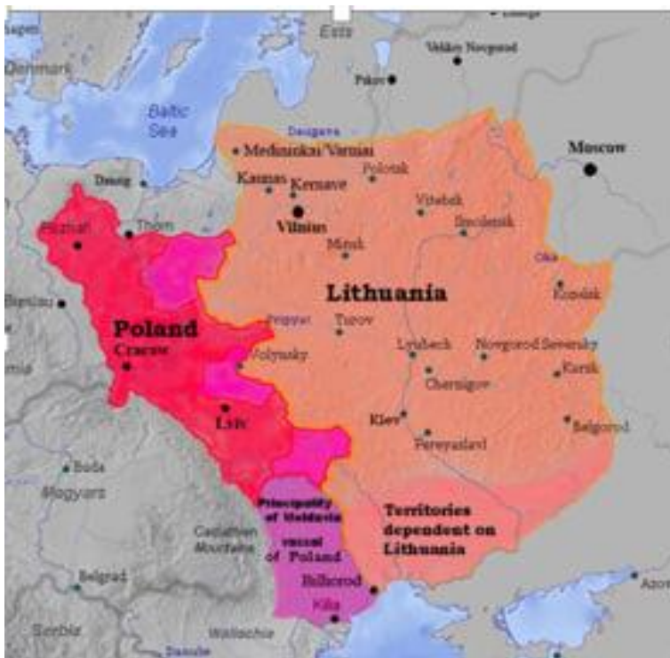
Рис.1.1 Польсько-литовська держава, 1387 рік

В 1385 році, через загострення зовнішньої та внутрішньополітичної ситуації (внутрішні конфлікти серед литовської верхівки та загрози з боку Тевтонського ордену та інших), великий князь Ягайло приймає рішення про об'єднання з польськими феодалами з метою зміцнення своєї влади. На замку Крево (сучасна Білорусь), Ягайло та польські представники підписали акт про унію (союз), яка отримала назву Кревської унії [34].