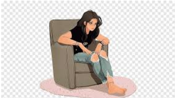
Mae'r ferch yn eistedd ar y gadair.