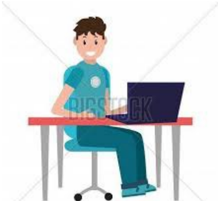
Mae'r bachgen yn eistedd wrth ei ddesg.