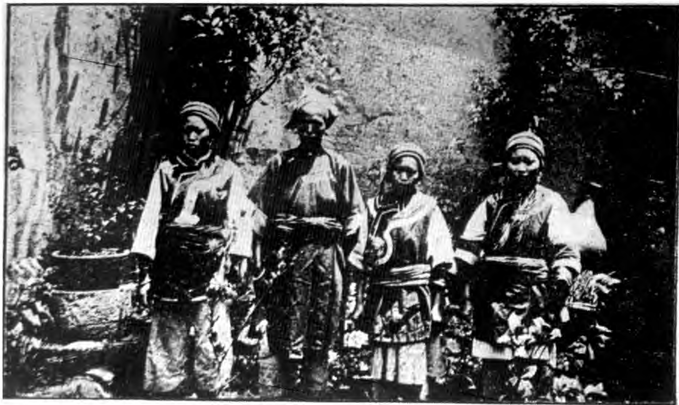
昆明西鄉「盧鹿」的三個少女及婦人