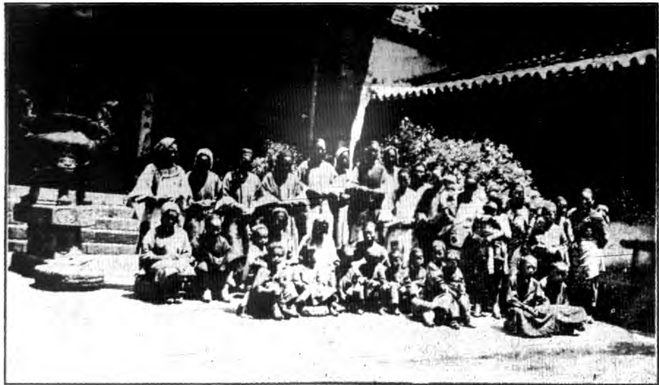
昆明南鄉大斗村「子君」族的婦人及幼女