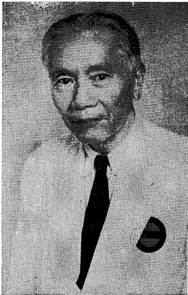
Di ảnh Cụ TRẦN TRỌNG KIM