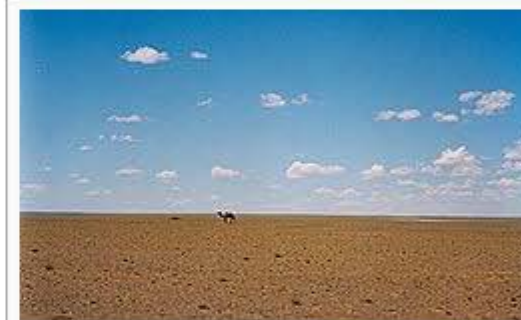
Gobi Desert landscape in Ömnögovi Province , Mongolia