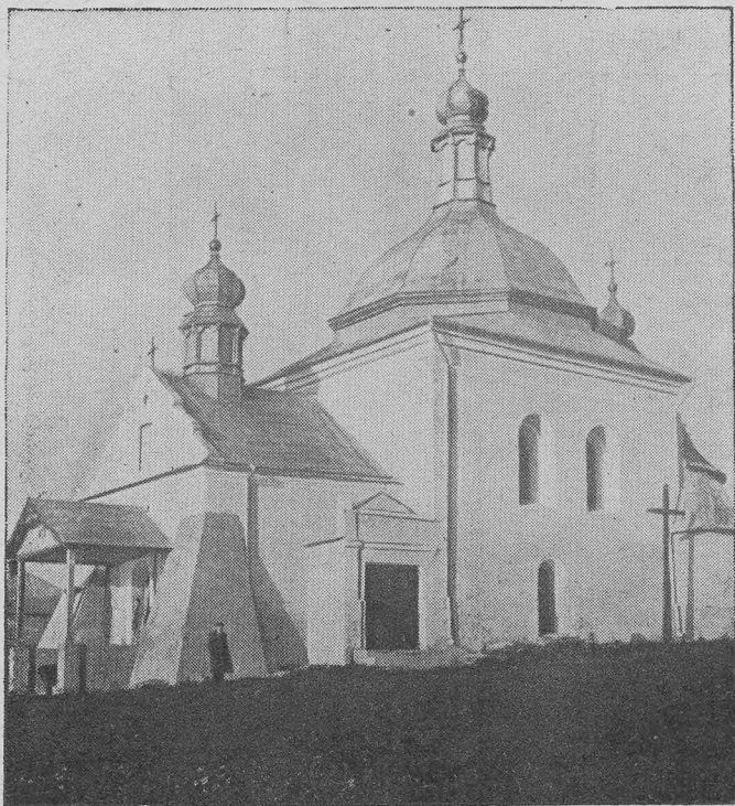
Церква св. Миколи з XVI в.