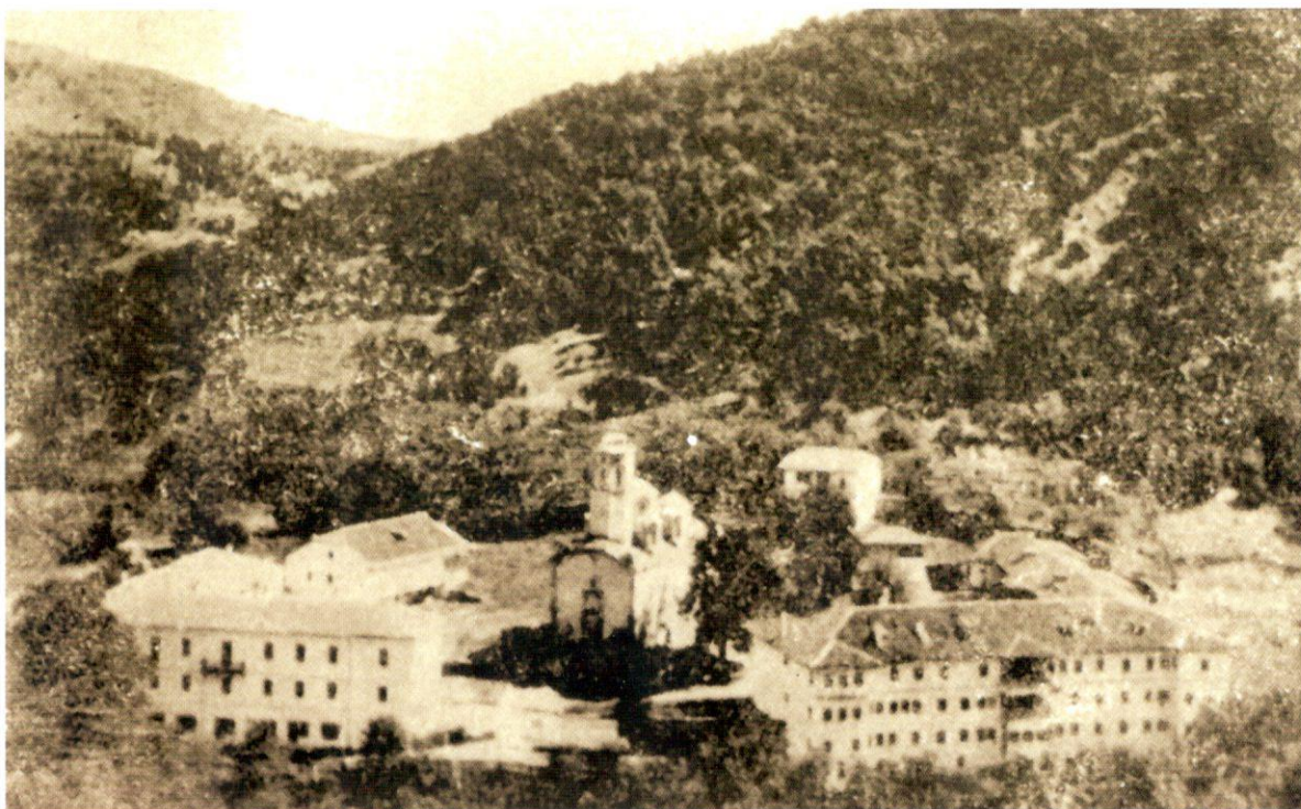
„Св. Прохор Пчински“, снимено на деној на одржувањето на Првото заседание на АСНОМ (2 август 1944)