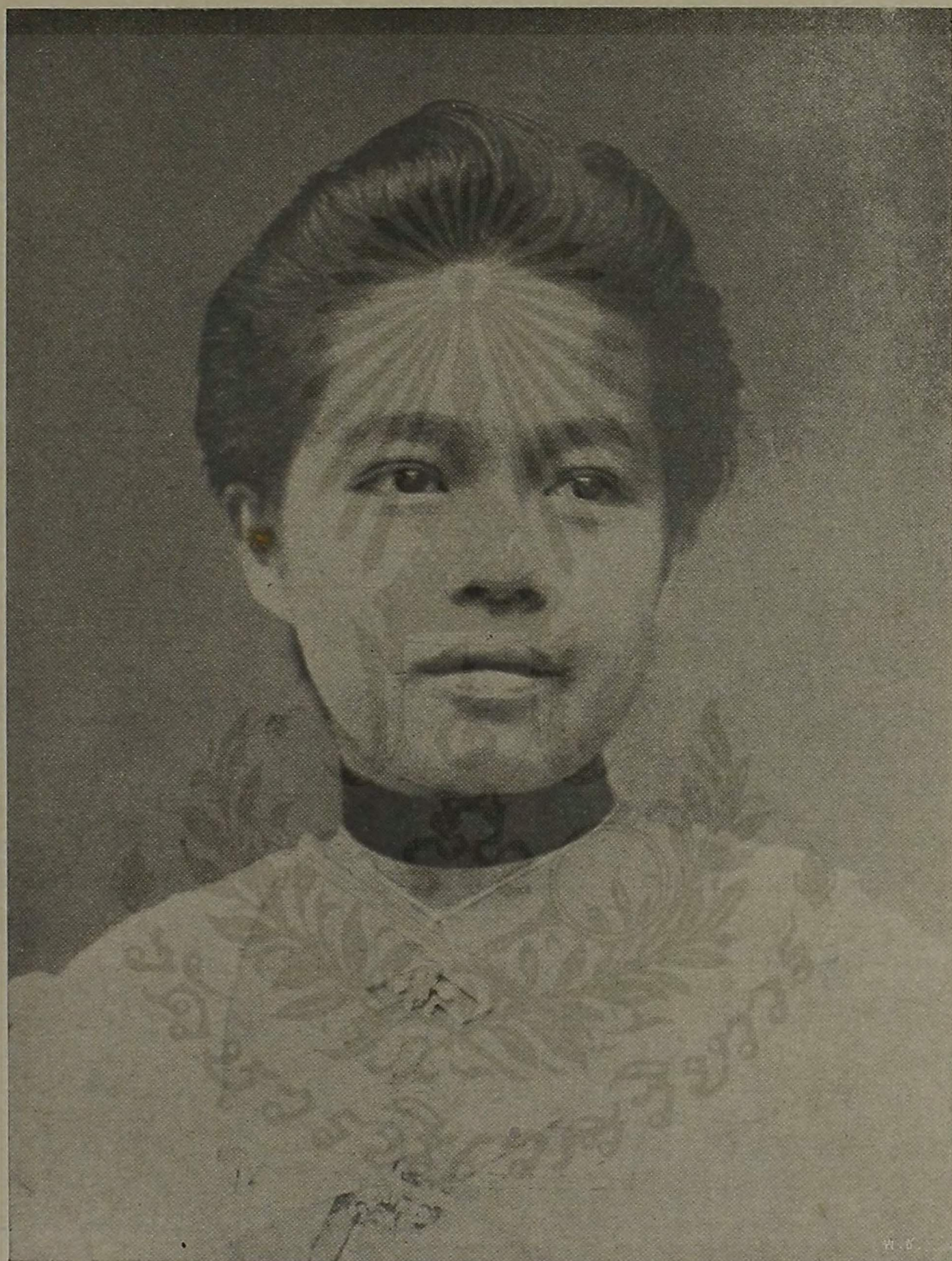
หม่อมเจ้าหญิงพร้อมเพราพรรณ ท จ.