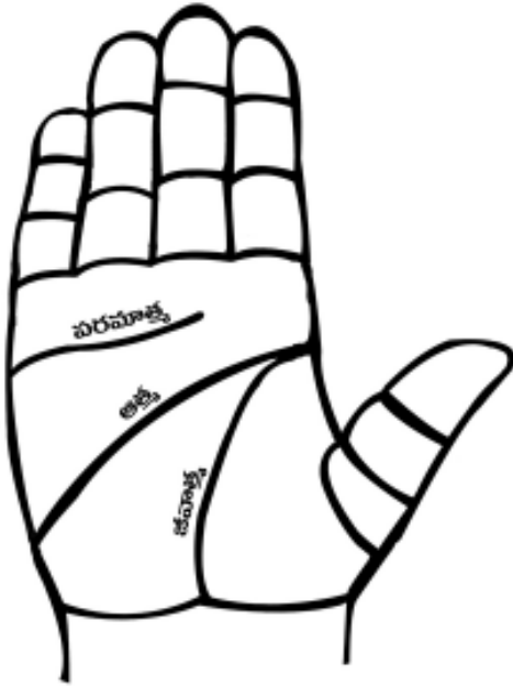
మూడు ఆత్మల గుర్తింపు