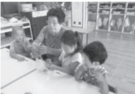
▲真剣に作品を作る園児

7月10日、昨年に続き、福寿学級と東保育園の交流会が行われました。夏祭りを前に、祭りに使うお店やさんごっこの品々を園児と一緒に作り、交流を深めることが出来ました。おばあちゃんたちと魚やうちわ、パフェと一緒に作る園児の真剣な眼差しが印象的でした。