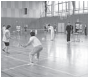
▲好プレー珍プレー続出