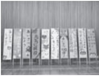
▲完成した6地区の看板

6月29日、恒例になった中学生によるあいさつ看板作りが体育センターで行われました。町1区、町2区、河原町、北割、南割、大原地区から170人の生徒が参加しました。これまでは中学生のみの取り組みでしたが、今年は商工会と役場職員有志20名も加わり、広範な取り組みに発展しました。パソコン文字を駆使した看板も登場するなど、新たな工夫も。看板を見た地域の皆さんが日常的にあいさつを交わせることを願いながら、中学生が一筆一筆真剣に看板と向き合っていました。