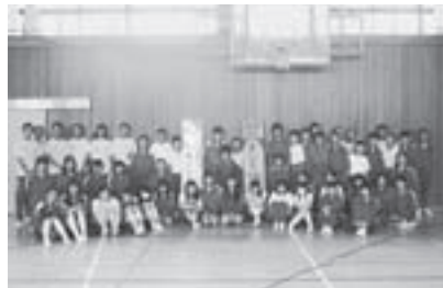
▲みんなで看板作りに取り組みました