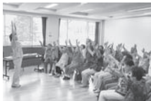
▲思いを歌に込めて