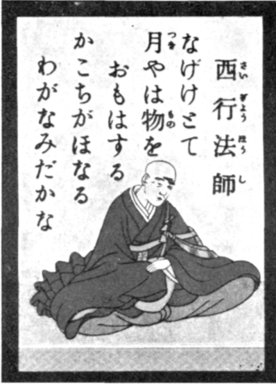
Le bonze Saigyō (XII e s.)

un aspect, elle évoque une impression contenue dans la mémoire. Là se borne son œuvre, l'esprit du lecteur lui-même accomplit le reste. Avec les éléments suggérés par le poème, il se reconstitue à lui-même une ambiance, une