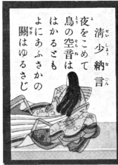
La poétesse Sei Shonagon (X e s.)