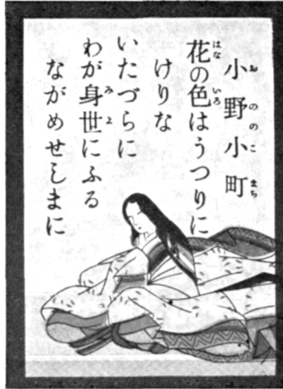
Le poème de Ono no Komachi sur la 9 e carte

La couleur des fleurs, Hélas ! s'est évanouie, Tandis que, vainement, Sur mon corps vieillissant, Je lisais mon passage en ce monde.