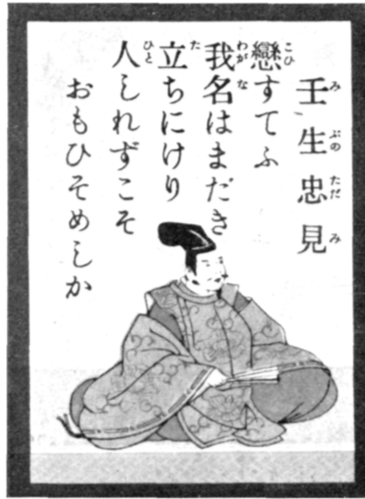
Le poème de Mibu no Tadami sur la 41 e carte

Je suis amoureux, dit-on. Déjà la rumeur En circule.