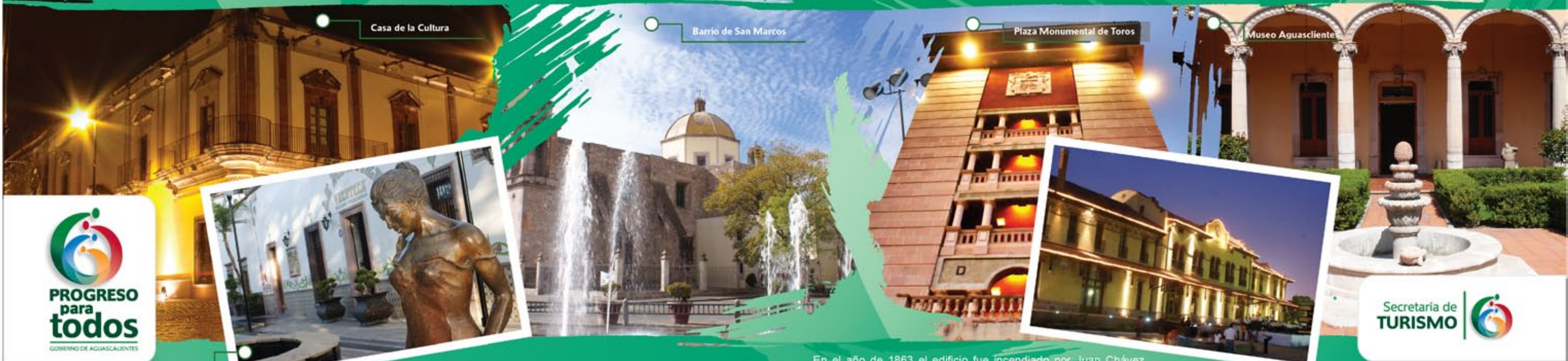
Casa de la Cultura

Su arquitectura es de estilo neoclásico y su fachada es de estilo jónico, este edificio funcionó en 1904 como escuela para niñas católicas y de 1911 a 1975 fue Escuela Normal para Maestras, y el 22 de octubre de 1975 se convierte en el Museo de la Ciudad, el cual cuenta con 7 salas de exposición, una de ellas para conciertos. En este recinto se encuentran obras de Saturnino Herrán y Jesús F. Contreras, pintor y escultor famosos en Aguascalientes.