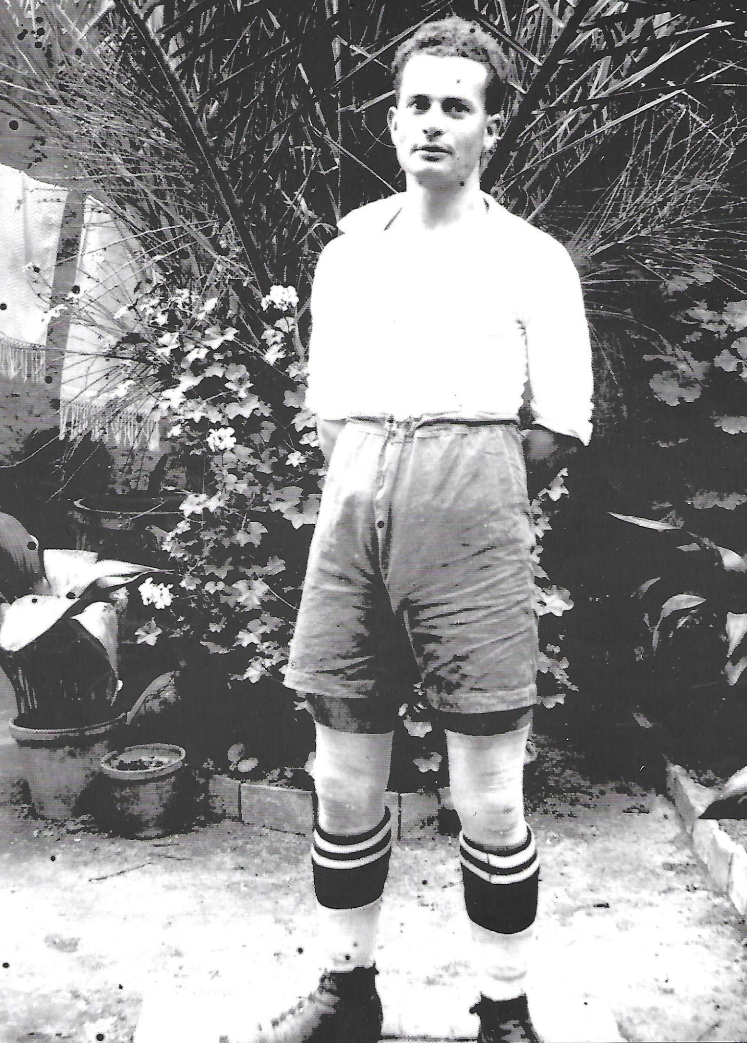
25. Jugador del SC Hospitalenc d'identitat desconeguda, circa 1920.