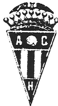
33 L'ESCUT DE L'ATLÈTIC CLUB HOSPITALET, DE SANTA EULÀLIA, DE L'ANY 1927. AL'H-AH

Si els explico que aquest només va ser un dels sis o set camps de joc que va tenir el Torrasenc abans de la guerra, com ja veurem més endavant, es podran adonar del sacrifici d'aquests seguidors, que no abandonaven l'equip tot i que canviessin d'instal·lacions gairebé cada dos anys... Malgrat aquestes dificultats, el club va aconseguir finalment federar-se, després de canviar de camp durant el 1925. Ja hem vist abans com la manca d'un terreny de joc en condicions va fer que, tot i els seus intents durant el 1923, haguessin d'esperar fins a aquesta temporada 1925-26 per poder disposar d'un camp en condicions i poder jugar competicions federades. Curiosament, el club va aconse-