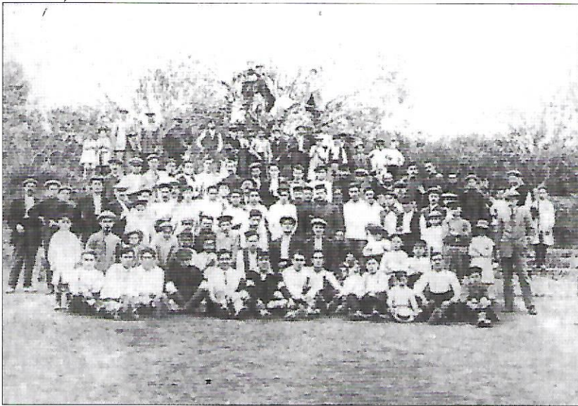
40 EL CAMP DE FUTBOL DE LA FONTETA, AL 1917. OBSERVEU ELS JUGADORS A PRIMERA FILA.