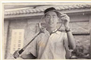
中學時期愛好體育運動

基於對音樂的酷愛，他很早就在報刊上發表音樂評論。湛太透露，當他獲得第一次稿費時，就請全家人吃了一頓豐富的早餐。「記得那次早餐是到