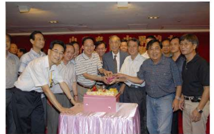
勁社校友同慶畢業40周年