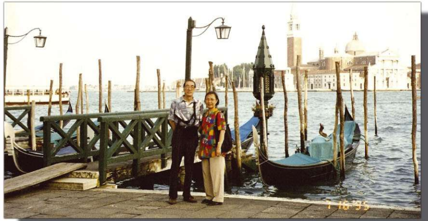
夫婦倆在外國旅遊留影

會形式的，餐室的伙記帶備食物到來，在大桌子上放上一套套的刀與叉，吃得十分正規的，如今還記憶猶新。後來，舅父更和朋友辦了一份叫《熱風》的雜誌，家中堆滿大疊刊物，他的音樂評論生涯就這樣逐步地展開了。」