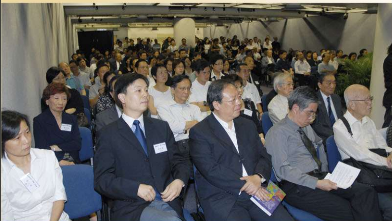
民政事務局局長何志平先生(前排中)剛由外地返港，隨即趕至會場。

儘管一向敬重黎保裕老師，但自從07年6月14日傍晚參加了「黎保裕(黎鍵)先生追思會」，步出會場時，心情仍然是沉重的，實實在在地感受到老師的離去，使香港演藝研究與評論這塊園地裡，倏然留下了大片的遺憾與寂寞，來自不同領域的演藝界朋友同為失去一位良師益友，由衷地感到萬般的捨不得！