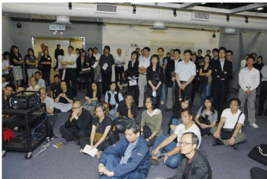
由於座無虛席，遲來者唯有坐下或站着