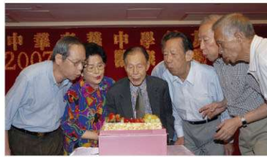
60年前的展社畢業生同慶甲子之會

聯歡聚餐得以順利進行，籌備小組的校友們應記一功。更期望08年有更多的校友、家屬能參加每年一度的聯歡聚餐，以加強我們的友誼和凝聚力，讓愛國教育的優良傳統能繼續發揚下去，不斷勾起我們那段富有特殊意義的集體回憶。在此我們相約於08年9月6日(星期六)，再聚友情。