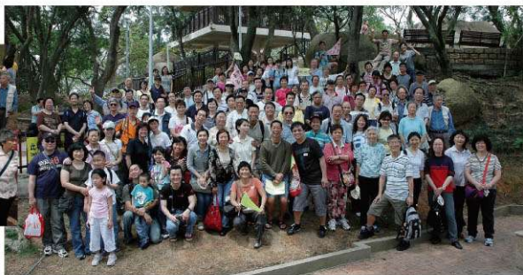
由126人組成的長洲大旅行隊伍