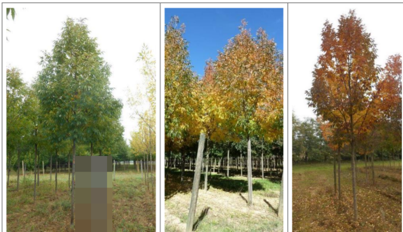
Photographies du frêne rouge', Fraxinus pennsylvanica 'cimmaron' à différentes saisons