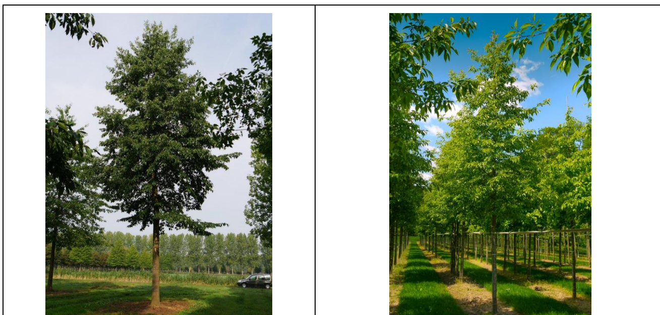
Photographies Aulne de Spaeth, Alnus 'spaethii' à différentes saisons