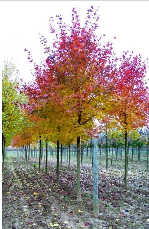
Photographies de l'érable 'Pacific Sunset', Acer platanoides 'pacific Sunset' à différentes saisons