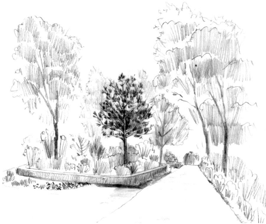
Parc de l'Hôtel de Matignon janvier 2024