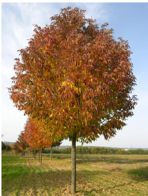
Photographies du frêne blanc, Fraxinus americana 'skyline' à différentes saisons