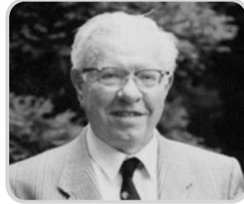
خارقاً قد صمم الفيزياء مع الكيمياء والبيولوجيا" وأنه "لا توجد قوى عمياء في الطبيعة تستحق الذكر".

من لوازم الحياة على الأرض، وجود كم وافر من الكربون الذي يتصنع من اندماج ثلاثة أنوية هيليوم أو اندماج نواتي الهيليوم والبيريليوم.. اكتشف العالم الفلكي الشهير "فريد هويل" أن حدوث هذا التصنيع يقتضي ضبطاً دقيقاً لمستويات الطاقة الأساسية لكل نواة مقابل الأخرى، وتسمى هذه العملية بظاهرة الرنين، فلو زاد التفاوت عن 1٪ أكثر أو أقل عن هذه المستويات، فلا يمكن للكون تأمين وجود الحياة.. أقر هويل فيما بعد بأن هذا الاكتشاف دون أي شيء غيره قد هز إلهاده، بل إن هذه الدرجة من الضبط الدقيق كانت كافية لإقناعه بأن "عقلاً