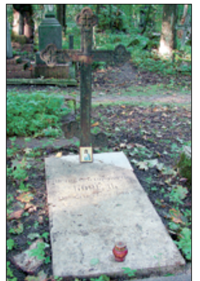
Захоронение П.Ф. Бореля на Смоленском православном кладбище