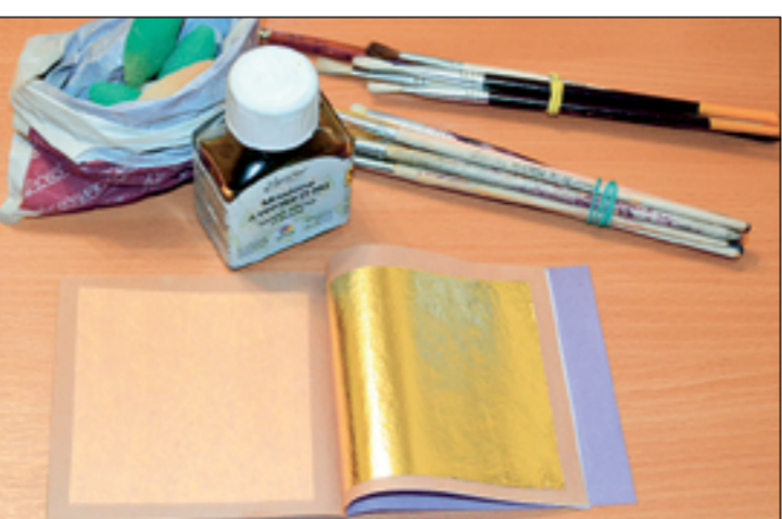
Нанесение надписей сусальным золотом — самый трудоемкий процесс, который приносит самый долговечный результат. Необходима идеальная вырубка по глубине и качеству сколов, потом производится грунтовка, а само сусальное золото укладывается губкой на слой специального лака