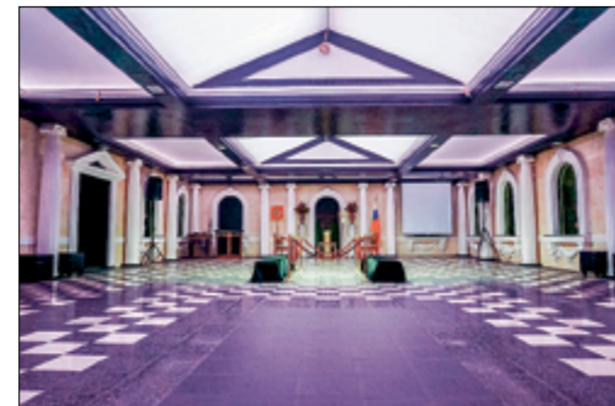
На фото сверху: Новосибирский крематорий, на фото внизу: колумбарные стены на территории Парка памяти рядом с крематорием и Большой зал для прощаний