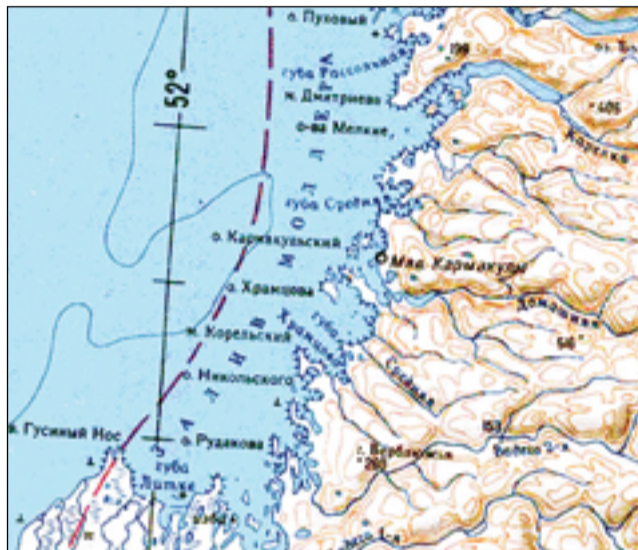
Залив Моллера на западном побережье южного острова Новой Земли