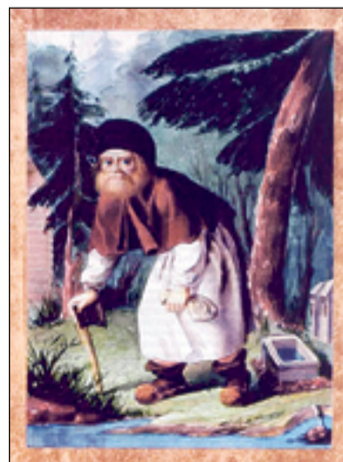
Старец Серафим Саровский. 1840-е годы, без подписи, акварель. Российская государственная библиотека, Москва

Петру Борелю принадлежат прижизненные портреты Филарета Дроздова, Филарета Амфитеатрова, а также Феофана Затворника и других русских святых.