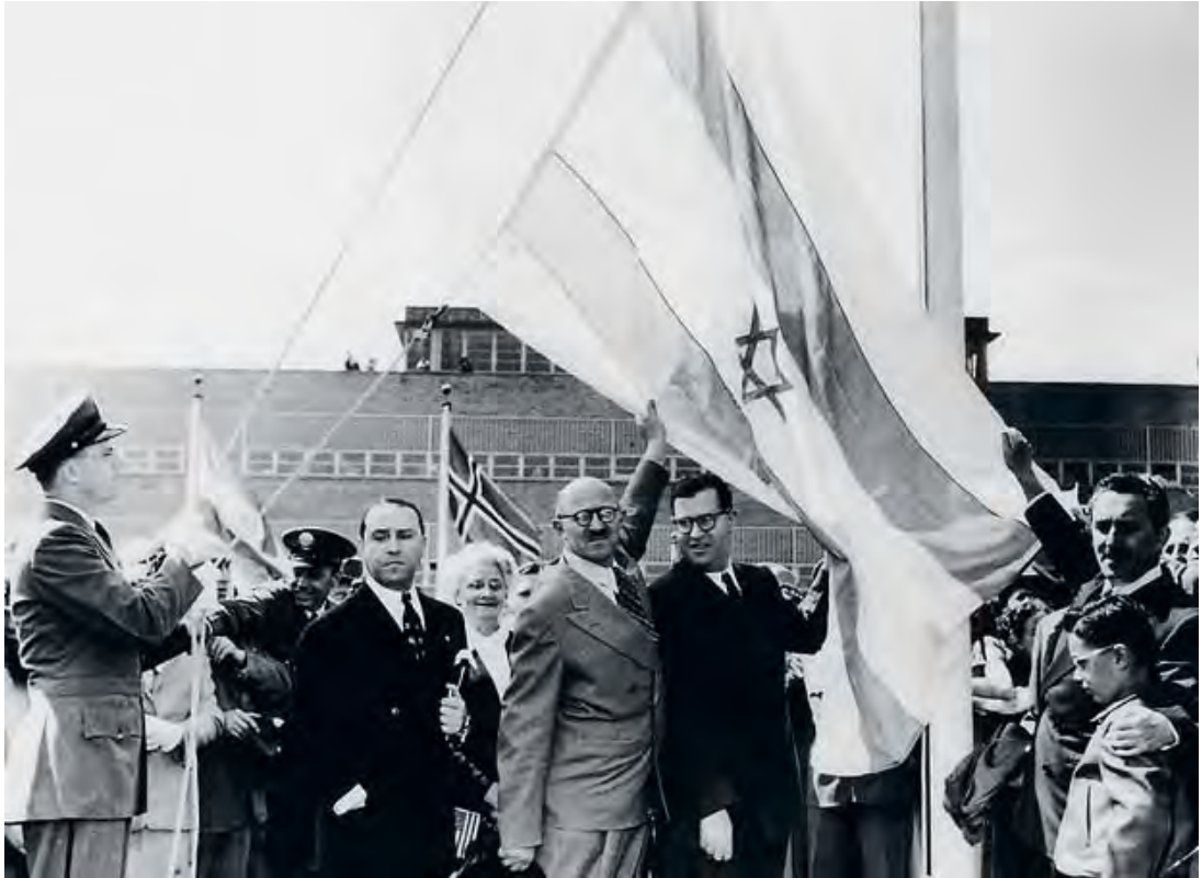
Proclamación de independencia de Israel en la sede de la ONU en Nueva York, en 1948.

Proclamation of Israel's independence at the UN headquarters in New York in 1948.