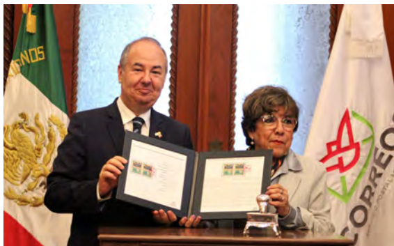
El embajador de Israel en México, Zvi Tal, con la directora general del Servicio Postal Mexicano, Rocío Bárcena Molina, durante la presentación del timbre conmemorativo de los 70 años de relaciones diplomáticas entre México e Israel, Ciudad de México, 13 de septiembre de 2022.