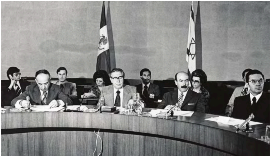
Primera reunión de la Comisión Conjunta México-Israel, 1978.

First meeting of the Mexico-Israel Joint Commission, 1978.