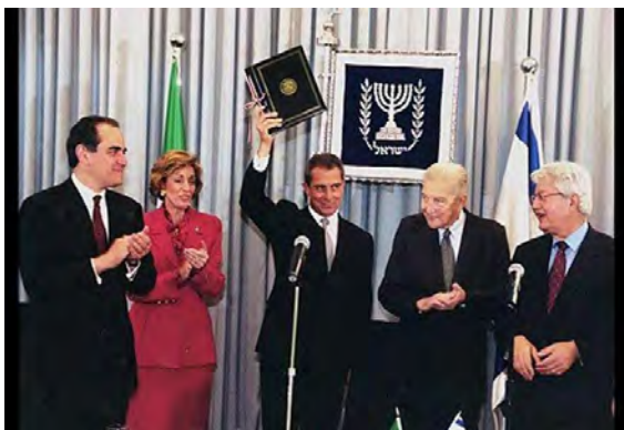
Los presidentes de México e Israel, Ernesto Zedillo y Ezer Weizman, en la firma del Tratado de Libre Comercio con Israel. A su alrededor, Rosario Green, secretaria de Relaciones Exteriores, David Levi, ministro de Asuntos Exteriores, y Herminio Blanco, secretario de Comercio y Fomento Industrial, 6 de marzo de 2000.

First meeting of the Mexico-Israel Joint Commission, 1978.