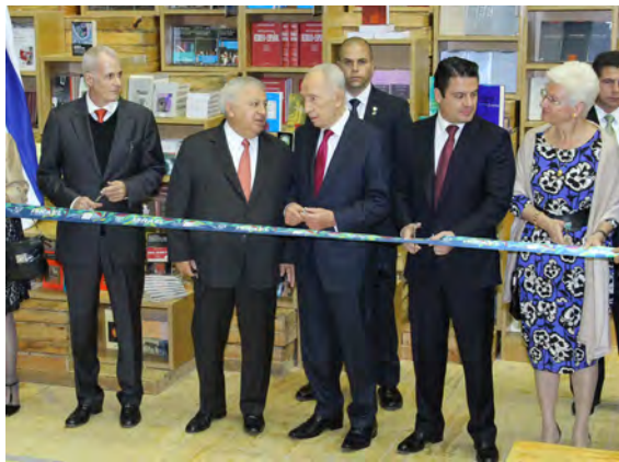
Inauguración del pabellón de Israel en la Feria Internacional del Libro de Guadalajara 2013, en compañía del presidente Shimon Peres, 1 de diciembre de 2013.

Shimon Peres, President of the State of Israel, during his working visit to Mexico, Mexico City, November 27, 2013.