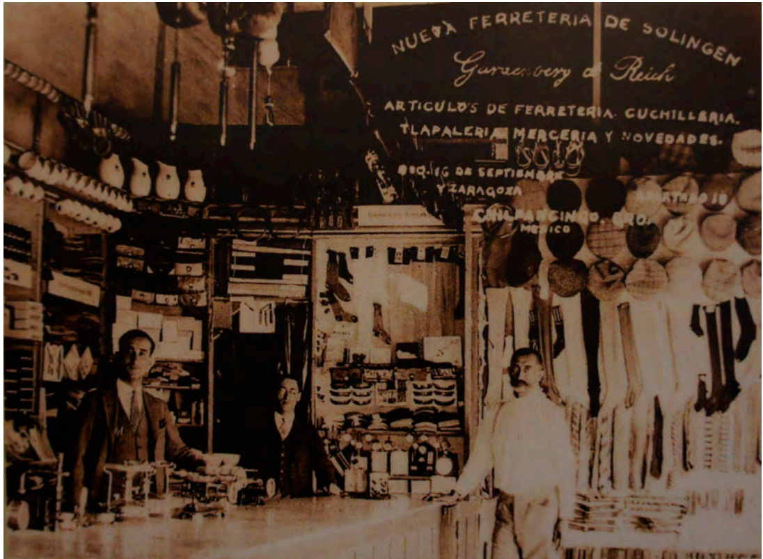
Primeros establecimientos judíos en México: Ferretería de Solingen, en Chilpancingo, Guerrero, s/f.