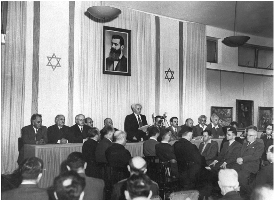
David Ben-Gurion lee la Declaración de Independencia de Israel en el Museo de Tel Aviv. Tel Aviv, 14 de mayo de 1948.