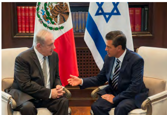
El presidente de la República, Enrique Peña Nieto, recibió al primer ministro del Estado de Israel, Benjamin Netanyahu, quien realizó una visita de trabajo a México, Ciudad de México, 14 de septiembre de 2017.

Inauguration of the Israel Pavilion at the Guadalajara International Book Fair 2013, in the company of President Shimon Peres, December 1, 2013.