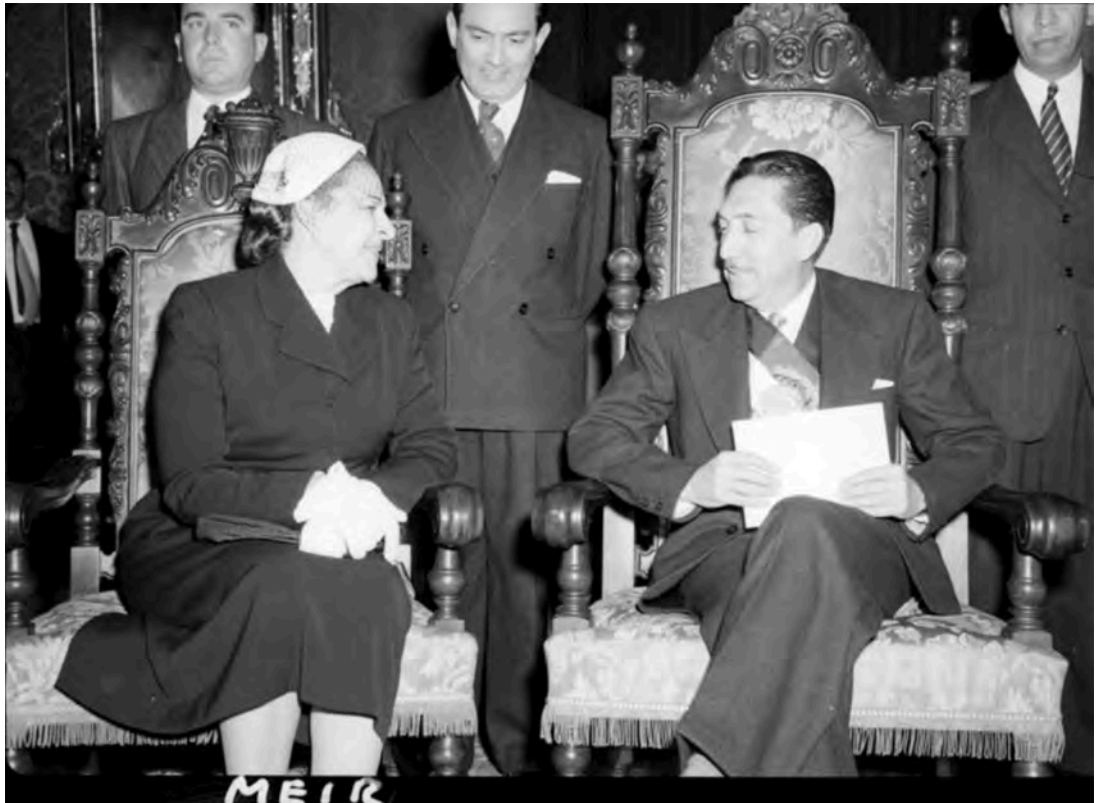
El presidente Miguel Alemán conversando con Golda Meir en Palacio Nacional, ca. 1950.