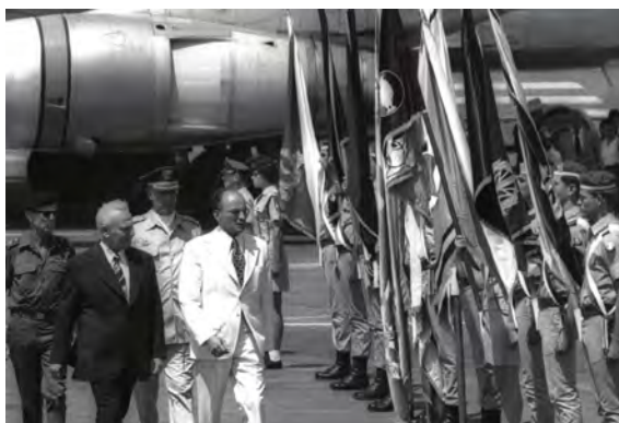
El presidente Luis Echeverría Álvarez en compañía del presidente Efraim Katzir inspecciona la guardia de honor en el aeropuerto de Ben Gurion durante su visita oficial a Israel, 1975.

President Luis Echeverría Álvarez with President Efraim Katzir inspecting the guard of honour at Ben Gurion Airport during his official visit to Israel, 1975.