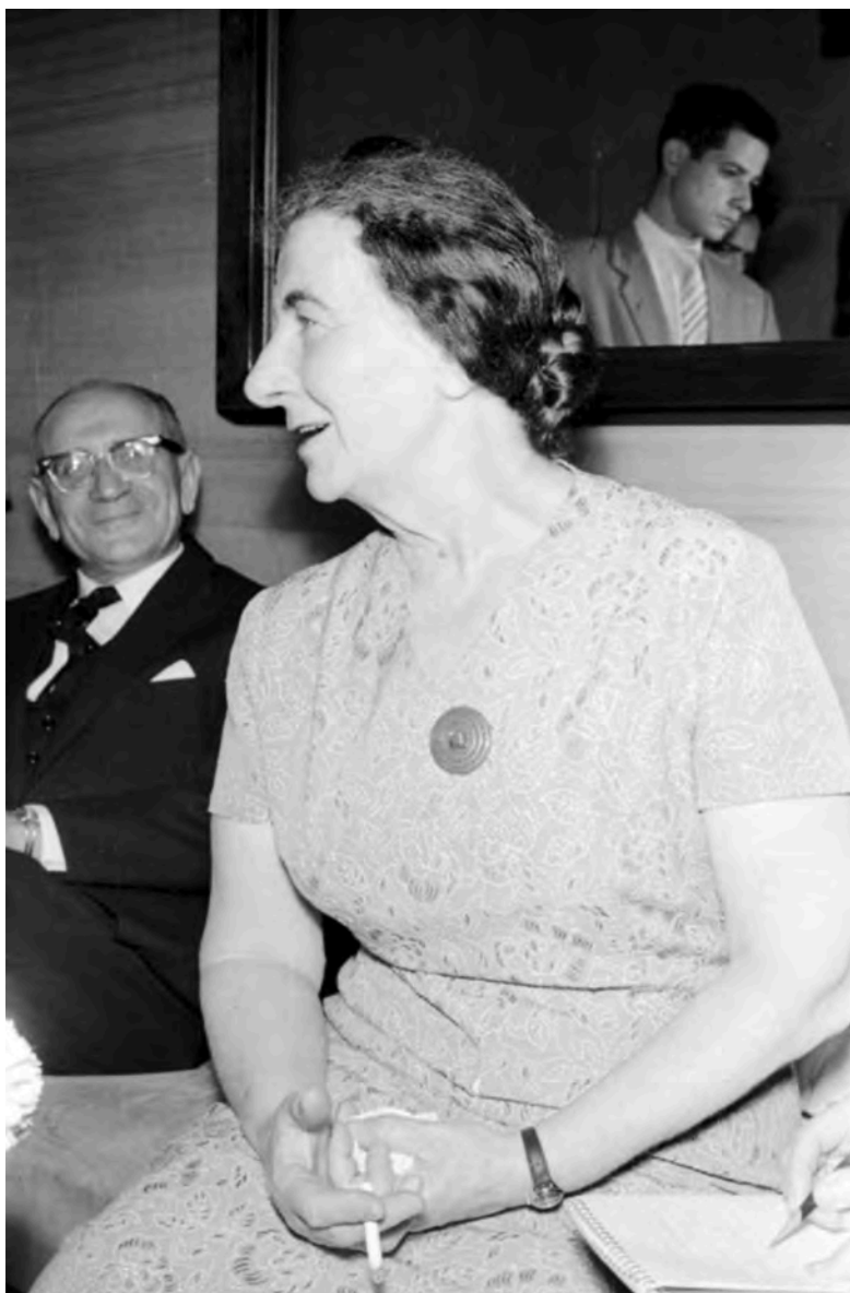
Visita a México de la ministra de Asuntos Exteriores Golda Meir, Ciudad de México, 1959.