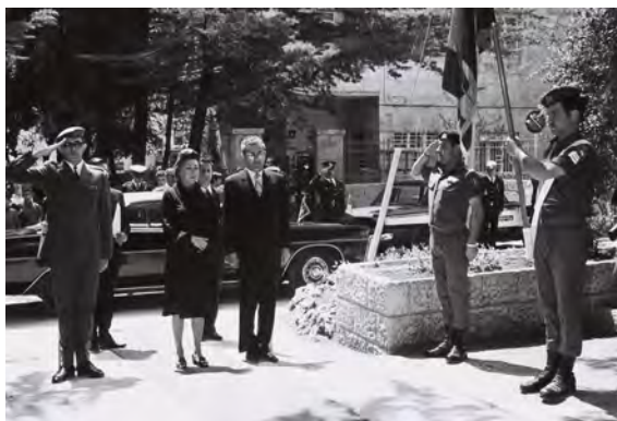
La embajadora de México en Israel, Rosario Castellanos, después de la presentación de sus cartas credenciales. Beit Hanassi, Jerusalén, Israel, 8 de abril de 1971.