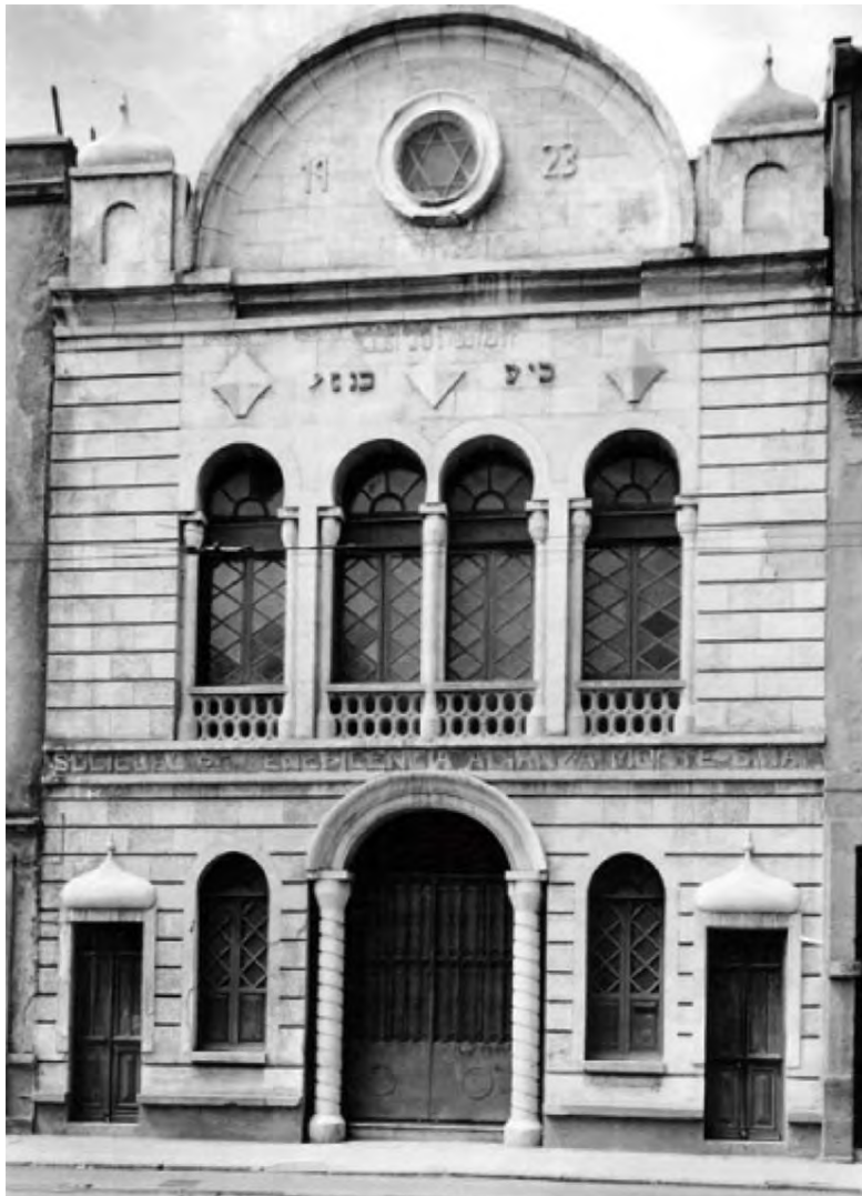
Primera sinagoga askenazí construida en la Ciudad de México: la Sinagoga Nidjei Israel, mejor conocida como Sinagoga Histórica Justo Sierra 71.

First Ashkenazi synagogue built in Mexico City: the Nidjei-Israel Synagogue, better known as the Sinagoga Histórica Justo Sierra 71.