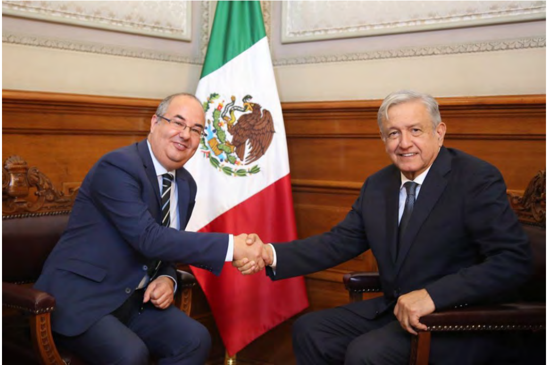
El embajador de Israel en México, Zvi Itzhak Tal, durante la presentación de sus cartas credenciales al presidente Andrés Manuel López Obrador.