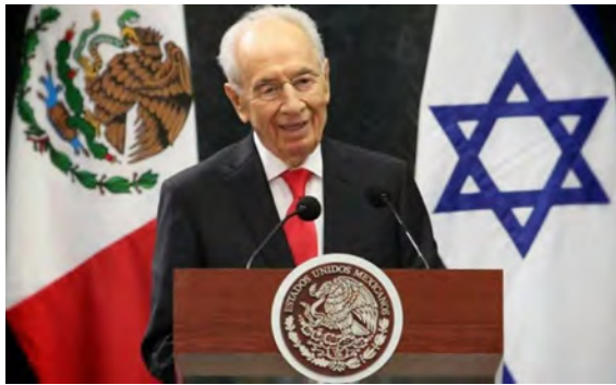
Shimon Peres, presidente del Estado de Israel, durante su visita de trabajo a México, Ciudad de México, 27 de noviembre de 2013.

Shimon Peres, President of the State of Israel, during his working visit to Mexico, Mexico City, November 27, 2013.