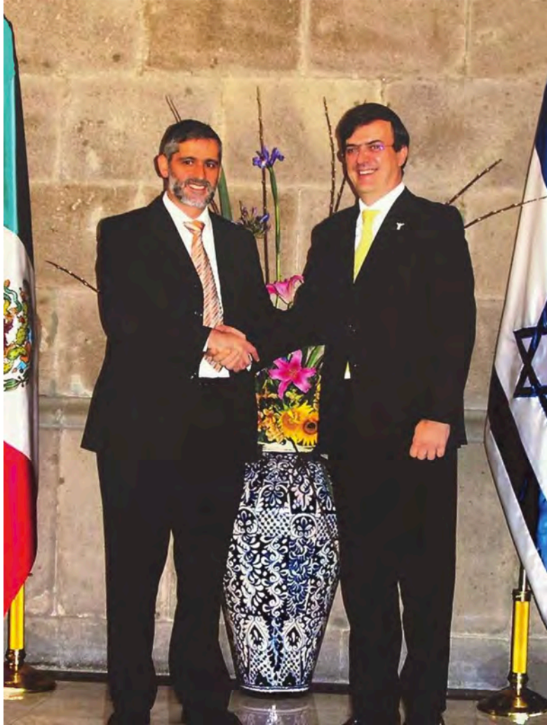
Marcelo Ebrard, jefe de Gobierno de la Ciudad de México, recibe a Eliyahu Ishai, ministro israelí de Industria y Comercio. Embajada de Israel en México, 2007.