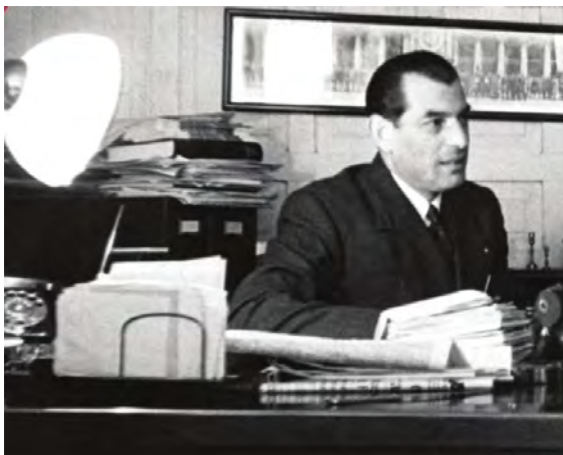
Adolfo Fastlicht, primer cónsul de Israel en México, 1952.