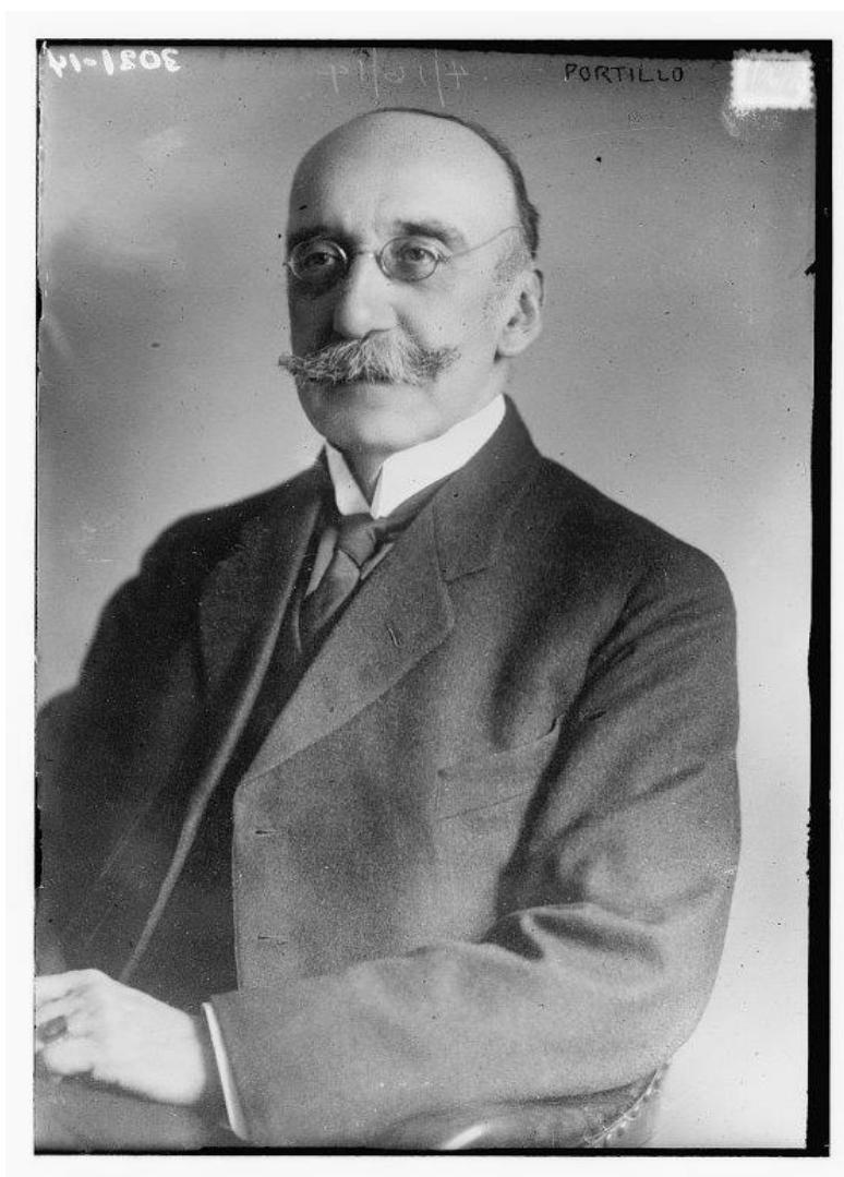
José López Portillo y Rojas, 16 de abril de 1917.