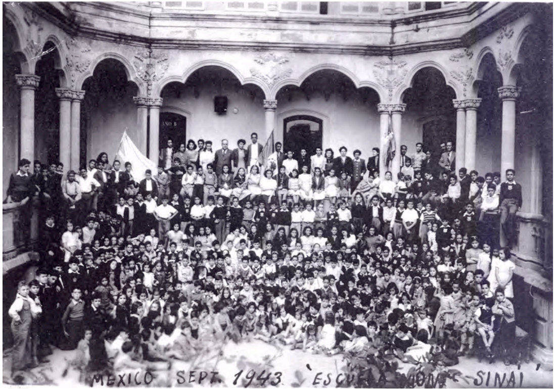
Colegio Hebreo Monte Sinai, 1943.