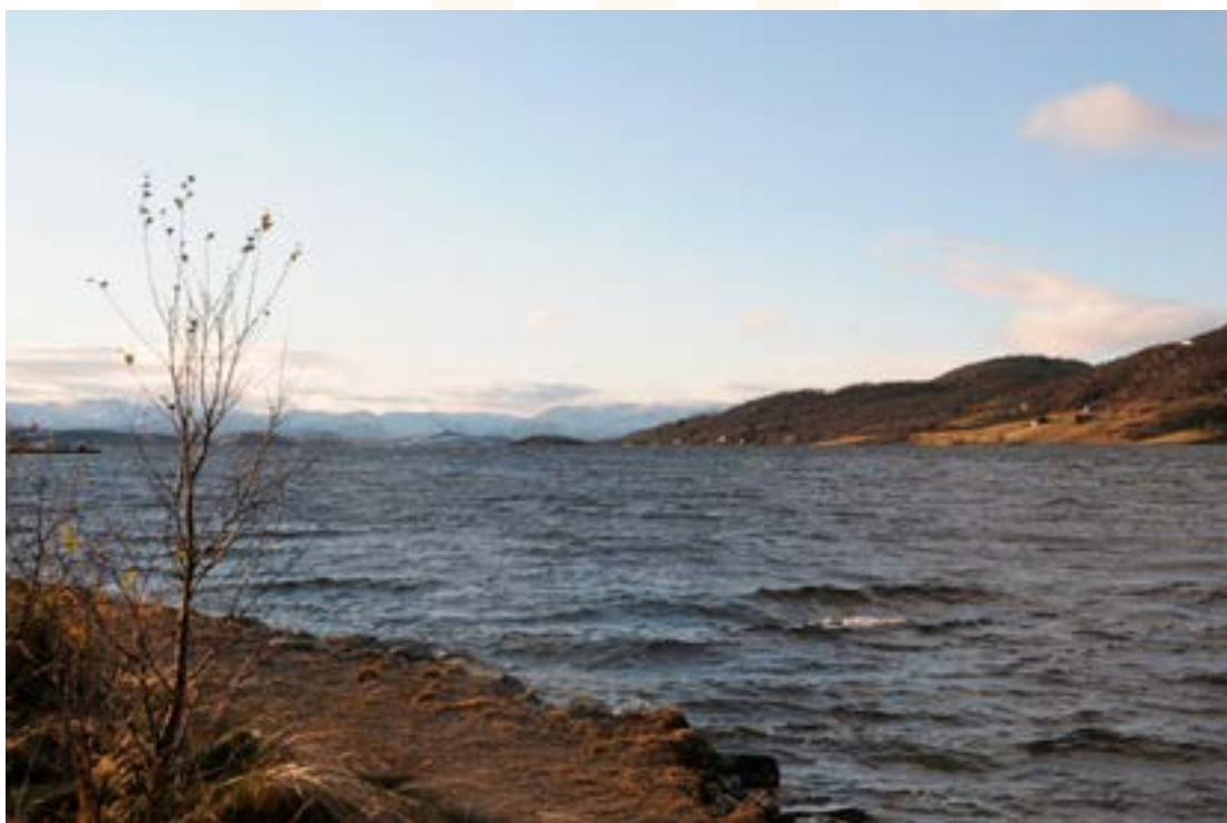
Del av verdsarven Møsvatn, sett vestover. Holvik til høgre.

Likevel er det von om at UNESCO-statusen òg kan gjeva føremonar for dei som bur langs vatnet. Soga om den vesle og spesielle bygda som ofra så mykje for industrialiseringa av Noreg og fekk så lite att, er ein del av historia om industrieventyret. Det skulle berre mangle at storsamfunnet no legg til rettes for å sikre næringsgrunnlaget og busetnaden på Møsstrond, for å berje ein del av det kulturelle mangfaldet me seier me er så stolte av, og for å ta vare på evna til å nytte ressursane våre over heile landet på ein berekraftig måte.