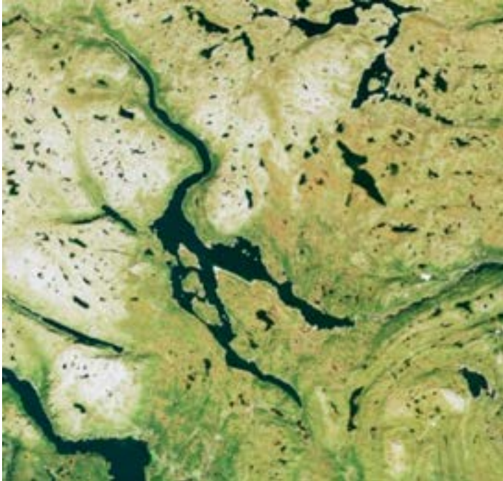
Møsvatn og Vestfjorddalen ned mot Rjukan.