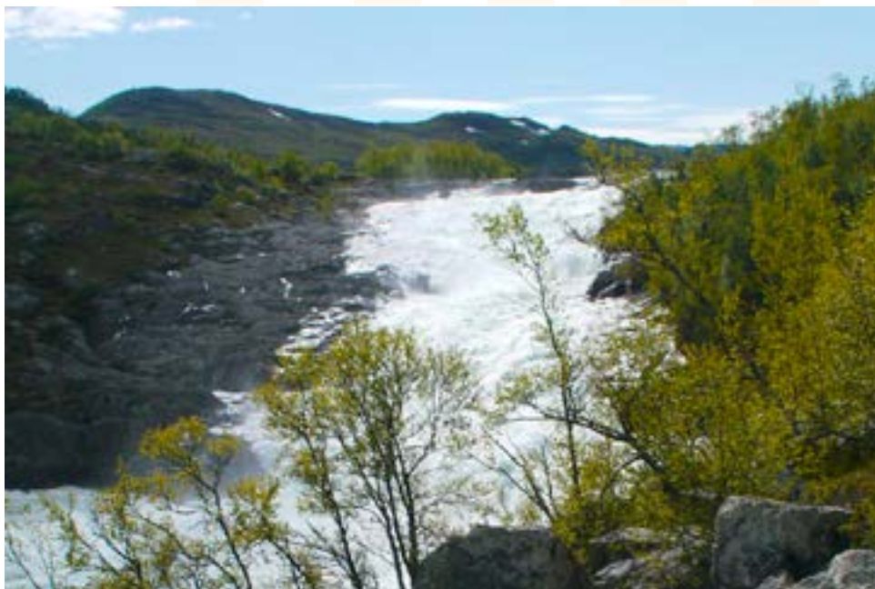
Argehovdfossen i Kvenna.

Salet av fallrettar svekte i utgangspunktet ikkje næringsgrunnlaget, og då oppkjøparane melde si interesse, fekk dei ofte tilslaget for det me må kalle småpengar. Men etter tradisjonen var det ikkje alle som let seg overtale. Då det kom ein kar til garden Argehovd innanfor Mogen og ville kjøpe retten til Argehovdfossen i Kvenna, svara Nils og Olav Argehovd: «Anten vil me hava hundre tusen hellå ein million. Forresten kan fossen renne som'n heve runne.» 5