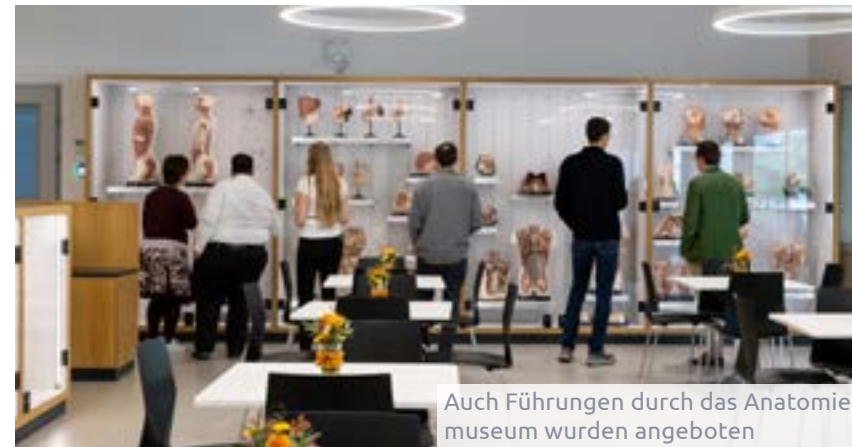
Auch Führungen durch das Anatomiemuseum wurden angeboten

chirurgie am LKH-Universitätsklinikum Graz. Die Lehrsammlung der Anatomie wurde an diesem Tag der Öffentlichkeit zugänglich gemacht.