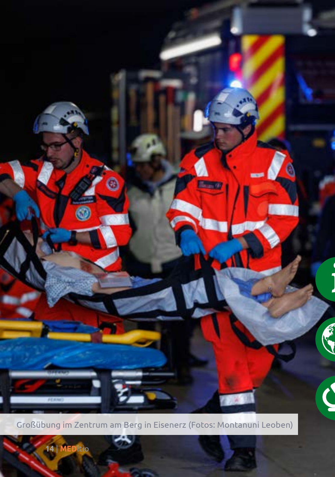
Großübung im Zentrum am Berg in Eisenerz