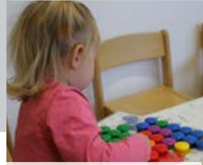
Erweiterung um 2 Krippengruppen