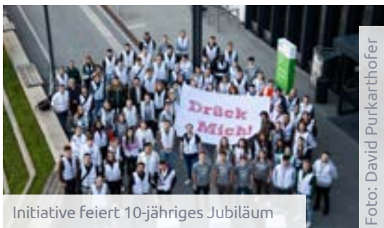
Initiative feiert 10-jähriges Jubiläum

Der Tag der Wiederbelebung, international als „World Restart a Heart Day“ bekannt, wird jährlich am 16. Oktober begangen. Rund um diesen Tag wird weltweit auf die Bedeutung und das Handeln bei einem unerwarteten Herzstillstand aufmerksam gemacht. In bewährter Weise wurden im Rahmen des Tags der Wiederbelebung Passant*innen in der Grazer Innenstadt bereits zum zehnten Mal diese lebensrettenden Maßnahmen von über 100 Studierenden der Med Uni Graz in Zusammenarbeit mit der Initiative „Drück mich!“ vermittelt. Auf diese Weise konnten interessierte Personen selbstständig Wiederbelebung lernen und diese Fertigkeit auch in ihren Familien und im engen sozialen Umfeld verbreiten. Jede*r von uns kann einen großen Beitrag leisten, indem man die Fertigkeit Wiederbelebung in der eigenen Familie und im unmittelbaren sozialen Umfeld anspricht. Denn für den Fall der Fälle sollten wir alle gerüstet sein.