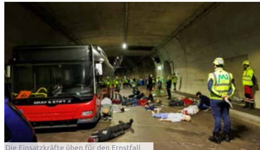
Die Einsatzkräfte üben für den Ernstfall

„Im Rahmen der Realübung einer Großschadenslage wurde erstmals nachgewiesen, dass die entwickelte Web-Applikation für alle Beteiligten sehr gut funktioniert, ohne dass dafür Infrastrukturen im Netz der Bahn oder Straße gesperrt werden mussten“, bekräftigt Robert Galler, Leiter des Zentrums am Berg und Professor für Subsurface Engineering – Geotechnik und Tunnelbau an der Montanuniversität Leoben. Gleichzeitig wurden von den Einsatzkräften auf freiwilliger Basis Biosignal- und Stressmessdaten erhoben, die im Nachgang zur Übung nun wissenschaftlich ausgewertet werden, um zukünftig ein möglichst realistisches virtuelles