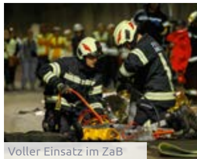
Voller Einsatz im ZaB

„Die Tunnelnotfallübung war aus Sicht der Med Uni Graz ein voller Erfolg. Das Potenzial der Zusammenarbeit der beteiligten Universitäten, der Militärakademie sowie von Einsatzkräften aus den unterschiedlichsten Bereichen ist beeindruckend, die Forschungs- und Übungsbedingungen vor Ort waren ideal.“