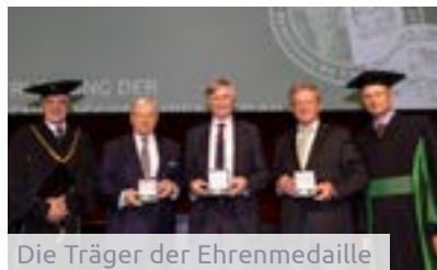
Die Träger der Ehrenmedaille

Der Festakt startete mit dem traditionellen Einzug der akademischen Würdenträger*innen