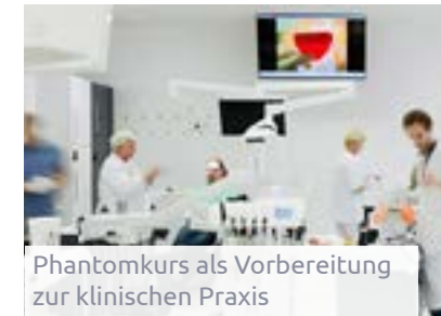
Phantomkurs als Vorbereitung zur klinischen Praxis

„Im Fokus dabei stand für uns immer eine übersichtliche und didaktisch sinnvolle, strukturierte Wissensvermittlung, um die Studierenden bestmöglich auf das klinische Praktikum und die Patient*innenbetreuung vorzubereiten.“