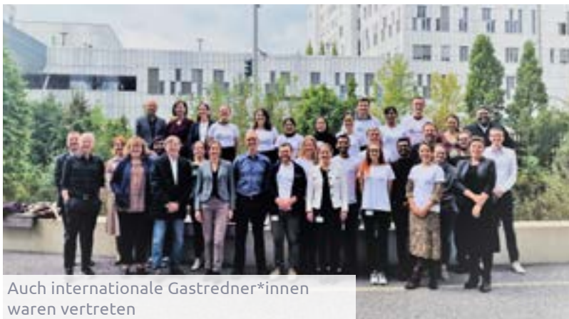
Auch internationale Gastredner*innen waren vertreten