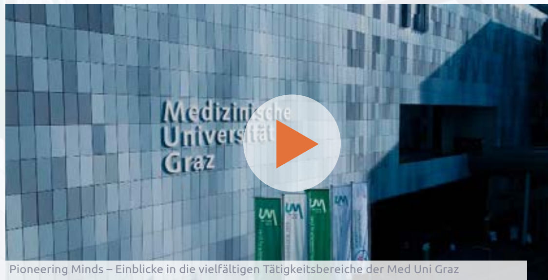
Pioneering Minds – Einblicke in die vielfältigen Tätigkeitsbereiche der Med Uni Graz