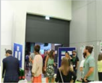
Das Interesse war groß