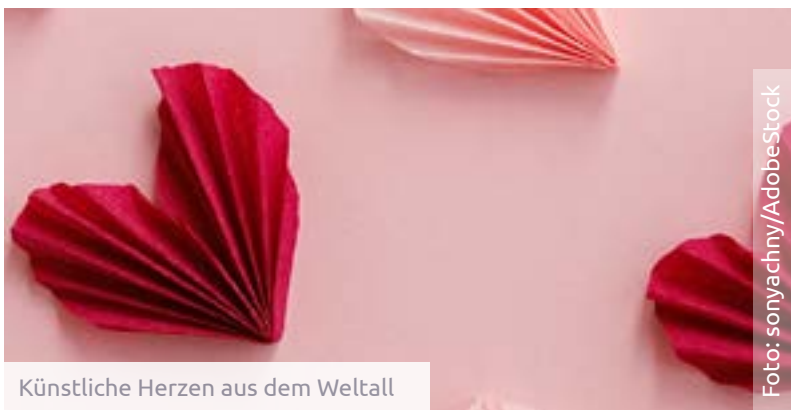
Künstliche Herzen aus dem Weltall