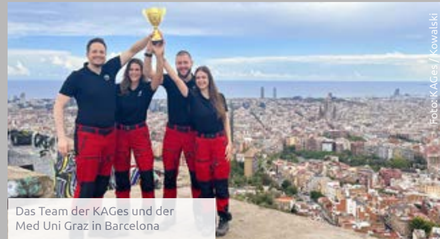
Das Team der KAGes und der Med Uni Graz in Barcelona