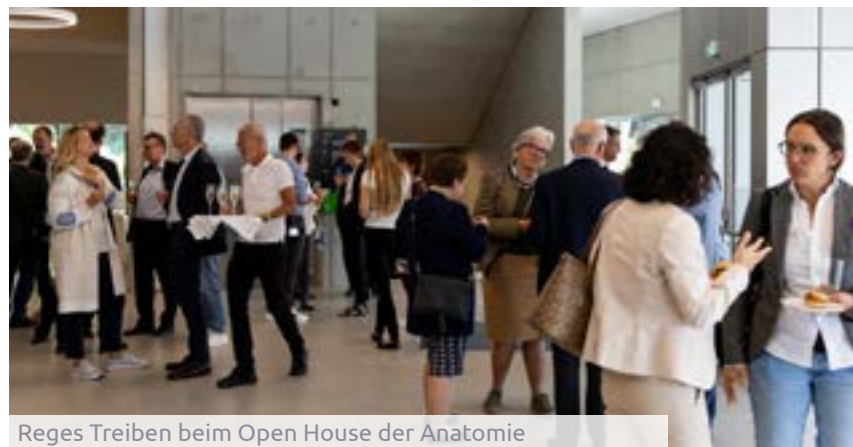
Reges Treiben beim Open House der Anatomie