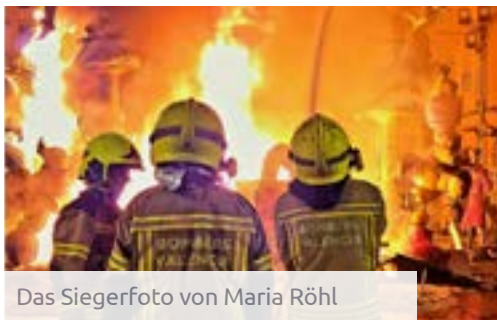
Das Siegerfoto von Maria Röhl

Im Rahmen des International Days am 10. Oktober ging auch das Finale des Med Uni Graz-Abroad-Fotowettbewerbs 2023 über die Bühne. Insgesamt 35 Fotos zu studienbezogenen Auslandsaufenthalten gingen dabei ins Rennen um den Sieg. Über den Sommer standen diese auf den Social-Media-Kanälen des International Office zur Abstimmung. Die fünf beliebtesten Fotos erreichten das Finale und wurden beim International Day ausgestellt. Dort stimmten die Besucher*innen der Veranstaltung über die Gewinner*innen ab. Am Ende machte das Foto von Maria Röhl, das sie im Rahmen ihres Erasmus+-Studienaufenthaltes an der Universidad de Valencia in Spanien aufgenommen hat, das Rennen. Das Bild mit dem Titel „Cremà de las Fallas“ zeigt die Verbrennung der Fallas, ein traditionelles Ritual in Valencia.