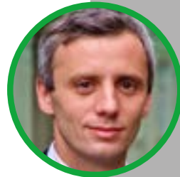
Assoz. Prof. Priv.-Doz. Dr.med. univ. Michael Khalil

Die Multiple Sklerose (MS) ist eine chronische Erkrankung des zentralen Nervensystems, die in Österreich etwa 12 500 Menschen betrifft. In einer internationalen Studie, an der auch die Med Uni Graz beteiligt war, wurde nun der erste genetische Marker gefunden, der mit Krankheitsprogression assoziiert werden konnte. Die überzeugenden Ergebnisse, die kürzlich im renommierten Journal „Nature“ veröffentlicht wurden, stellen einen maßgeblichen Erfolg bei der Erforschung des Fortschreitens der Erkrankung dar, was schlussendlich neue Behandlungsoptionen eröffnen könnte.