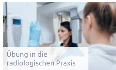
Übung in die radiologischen Praxis

im dritten Studienabschnitt des Diplomstudiums Zahnmedizin war es für die Curricularkommission Zahnmedizin ein nächster logischer Schritt, auch das sechste Semester modular zu strukturieren. Es war dies das letzte verbliebene Semester des Curriculums ohne Modulstruktur. Ausschlaggebend für die Einführung einer durchgängigen Modulstruktur waren unter anderem die Anpassung an den österreichweit ersten, in Graz entwickelten und etablierten Lernzielkatalog „Zahnmedizin“ und die Neuorganisation der Lehrveranstaltungen entsprechend aktuellen Qualitätsstandards.