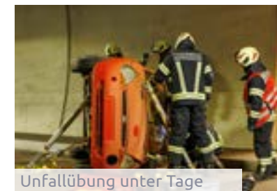
Unfallübung unter Tage

Training zu entwickeln. Ein Vergleich beider Methoden gibt Aufschluss über zukünftige Verbesserungspotenziale.