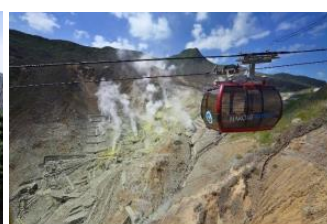
(索道業) 箱根ロープウェイ