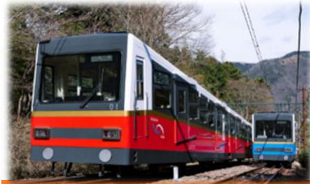
箱根登山ケーブルカー