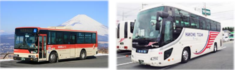
乗合・貸切バス業