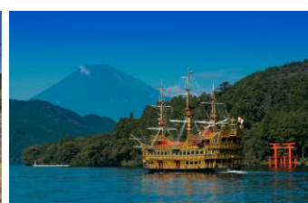
(船舶業) 箱根海賊船