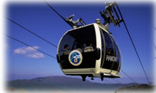
箱根ロープウェイ