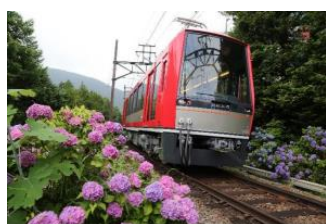
(鉄道業) 箱根登山電車