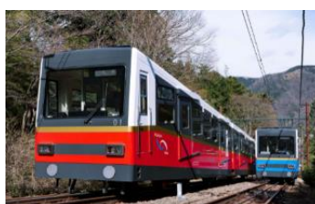
(鋼索業) 箱根登山ケーブルカー